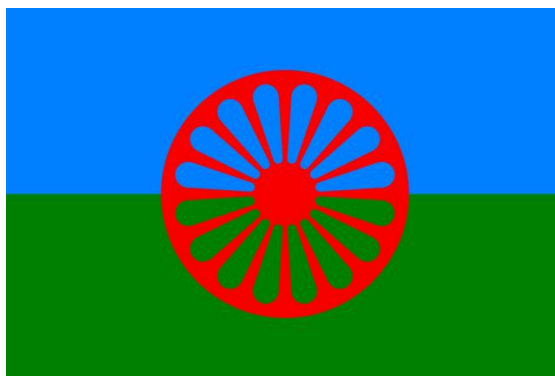
Slika 1. Zastava Roma