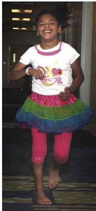
Slika 3. Dijete sa spastičnom hemiplegijom