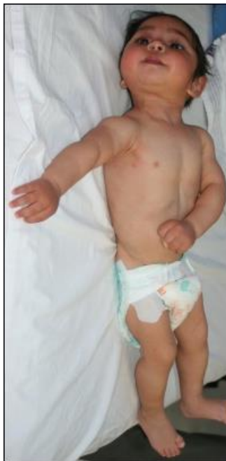
Slika 2. Dijete sa spastičnom kvadriplegijom

(https://theratogs.com/quadriplegic-cp/)