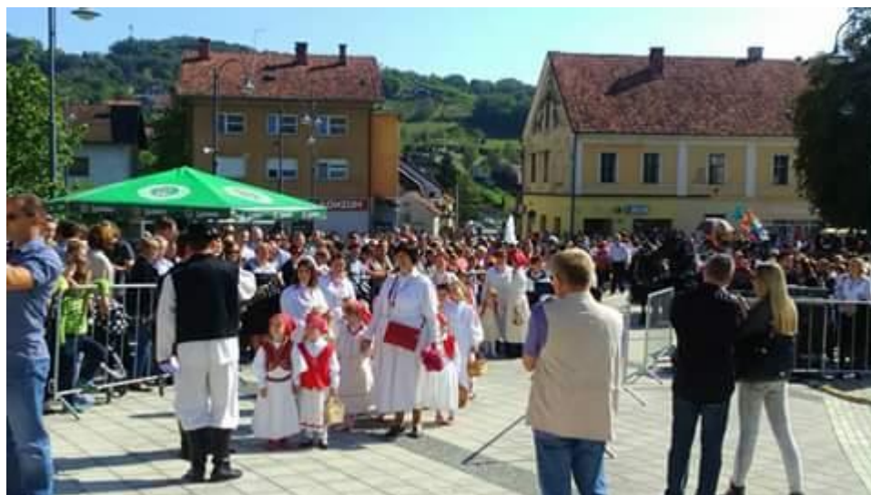
Slika 5. „Povorka berača i beračica“, djeca iz DV „Naša radost“, „Branje grojzdja“, Pregrada, 2016.

Tradicionalno, djeca iz Dječjeg vrtića „Naša radost“ sudjeluju i u završnoj „Povorki berača i beračica“ na zatvaranju manifestacije „Branje grojzdja“, zadnju nedjelju u mjesecu rujnu.