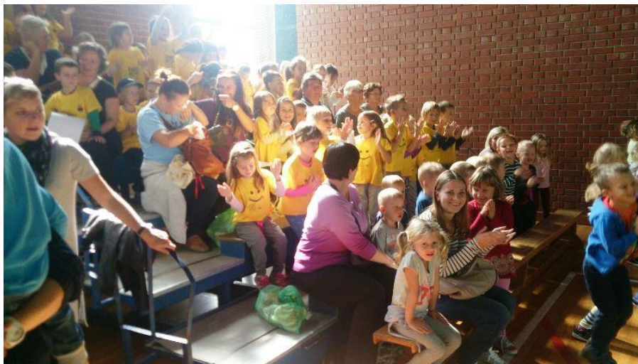
Slika 4. „Pregradske dječje berbarije“, Sportska dvorana OŠ J. Leskovara, Pregrada, 2016.

Svaku godinu, već osamnaest godina, „berbarije“ su mjesto druženja, igre, pjesme i plesa za vrtićku djecu, njihove roditelje, bake i djedove, a naročito za djecu s teškoćama u razvoju.