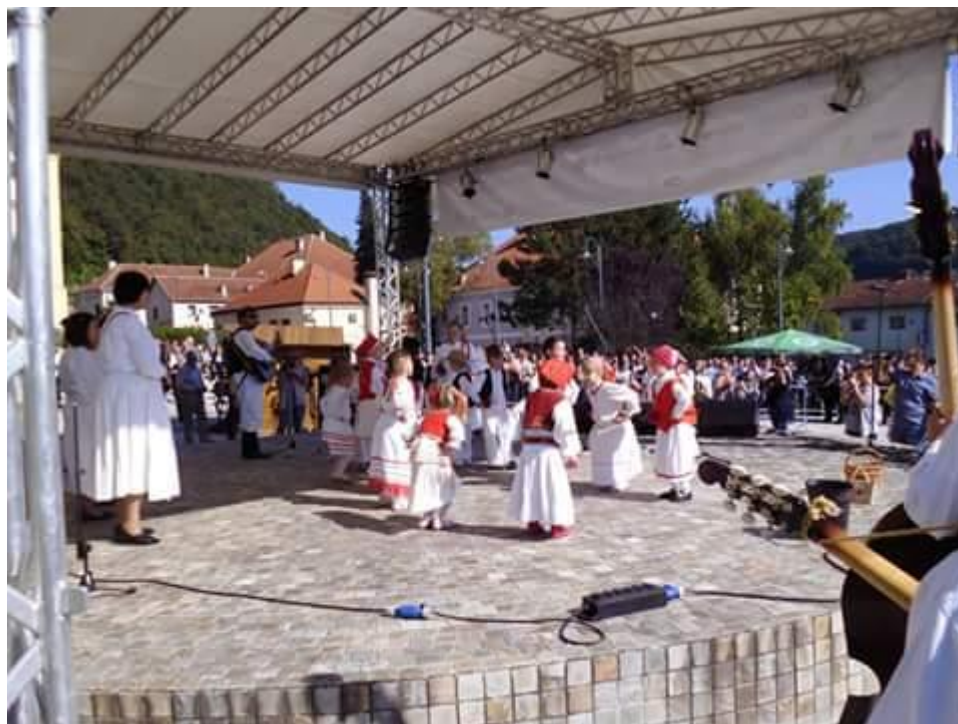
Slika 6. Pjesma i ples „Tančaj, tančaj crni kos“, djeca iz DV „Naša radost“, „Branje grozdja“, Pregrada, 2016.

Ove su godine djeca izvela pjesmu i folklorni ples „Tančaj, tančaj crni kos“.