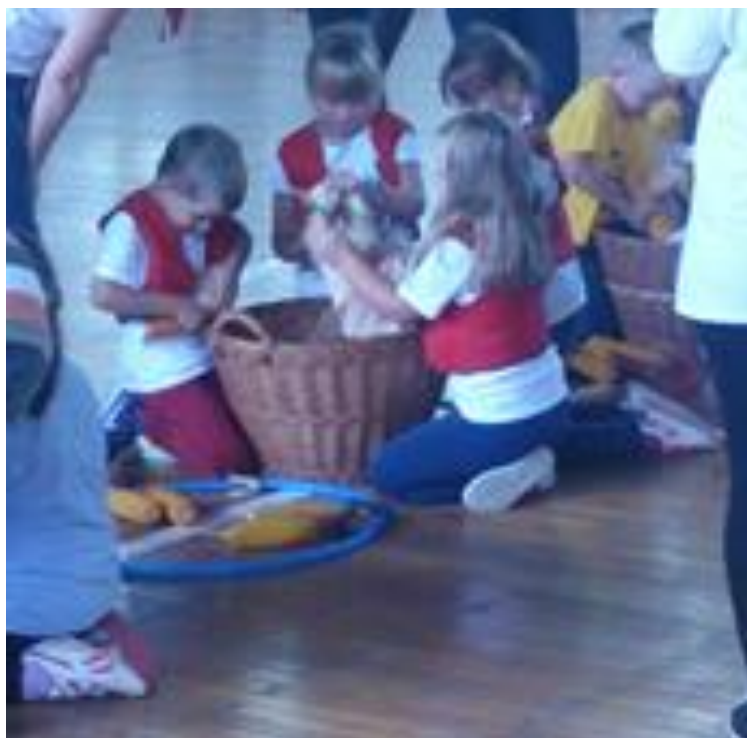
Slika 3. „Pregradske dječje berbarije“, Sportska dvorana OŠ J. Leskovara, Pregrada, 2016.

U sklopu manifestacije „Branje grojzdja“ održavaju se „Pregradske dječje berbarije“. To su natjecateljske igre koje okupljaju djecu predškolske dobi (5-7 godina) iz petnaestak dječjih vrtića s oko pet stotinjak djece s područja Krapinsko-zagorske županije, Grada Zagreba i Republike Slovenije. U brojnim igrama osmišljenim na temu jesenskih radova („ Skapanje krumpira “, „ Ježek vu snubokah “, „ Belatva kuruze “, „ Podiranje kuruznice “, „ Zagorski podrumari “...) djeca su pokazala brzinu, spretnost i preciznost u izvršavanju postavljenih zadataka.