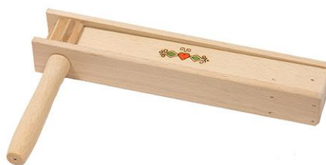
Slika 22. Čegrtaljka