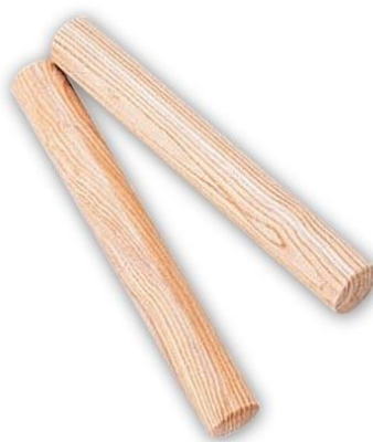
Slika 15. Štapići