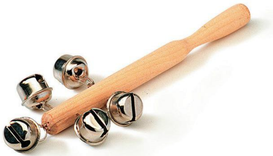
Slika 20. Praporac