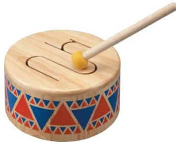
Slika 12. Drveni bubnjić

Drveni bubnjić (Slika 12.) – svira se drvenim batićem. Ako je četvrtastog oblika, veličina mu je, otprilike kao veća pločica ksilofona. Zvučnost mu daju jedan ili dva proreza u kojem su zubići (Gospodnetić, 2015).