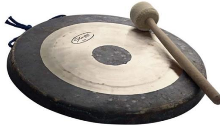
Slika 16. Tam-tam