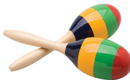
Slika 19. Zvečke