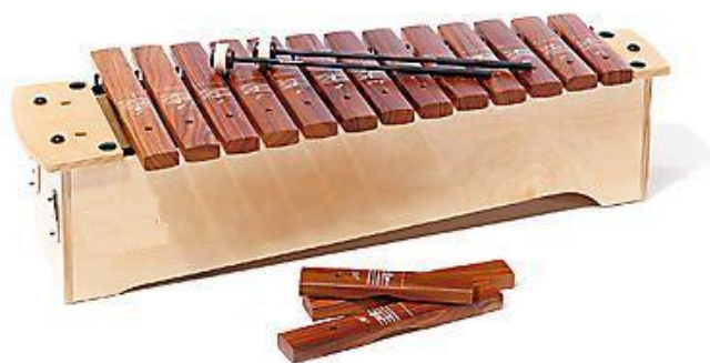
Slika 2. Ksilofon