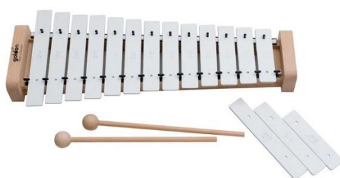
Slika 5. Zvončići

Zvončići su vrlo slični metalofonu. Temeljna razlika između ova dva instrumenta je visina proizvedenog tona (zvuči oktavu više) i njegova boja (Gospodnetić, 2015). Njihov zvuk je čist i svijetao, a za udaranje se upotrebljava laki metalni batići ili lagane palice s glavama od drva (Manasteriotti, 1982).