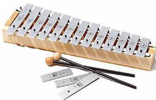
Slika 3. Metalofon