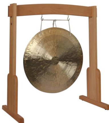
Slika 9. Gong