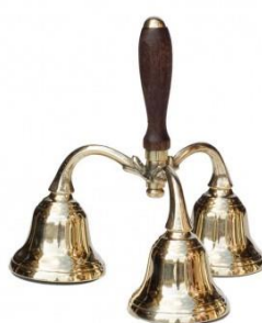
Slika 25. Zvonca