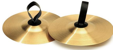
Slika 17. Činele