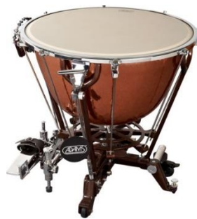
Slika 8. Timpani