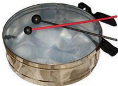
Slika 11. Mali bubanj