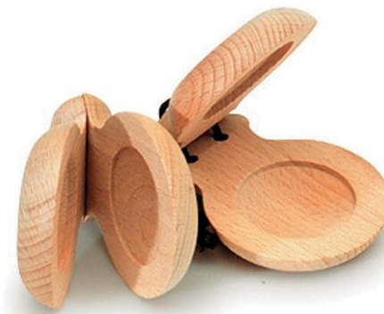
Slika 21. Kastanjete