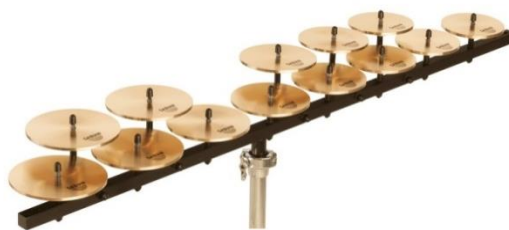
Slika 7. Crotales