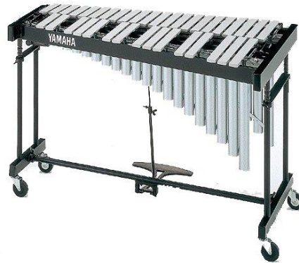
Slika 6. Vibrafon