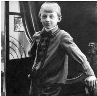
Slika 1. Mladi Carl Orff