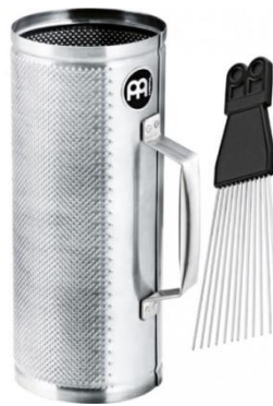
Slika 27. Guira