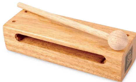
Slika 13. Četvrtasti drveni bubnjić