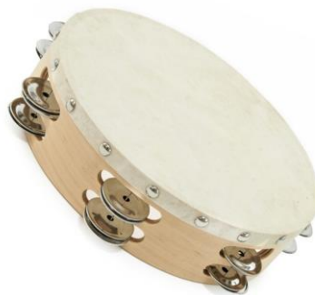
Slika 18. Tamburin