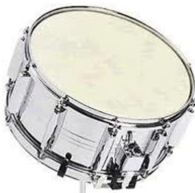
Slika 14. Veliki bubanj