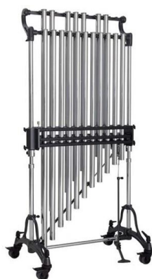
Slika 4. Zvona