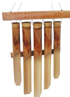
Slika 28. Bambusove visilice