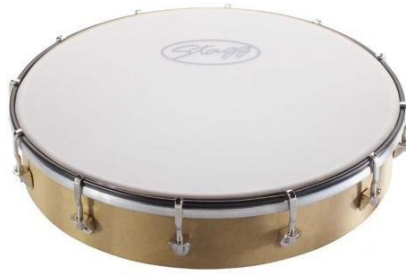
Slika 10. Ručni bubanj