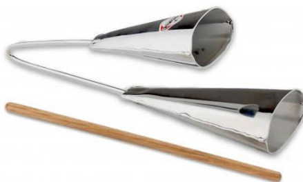
Slika 26. Agogo