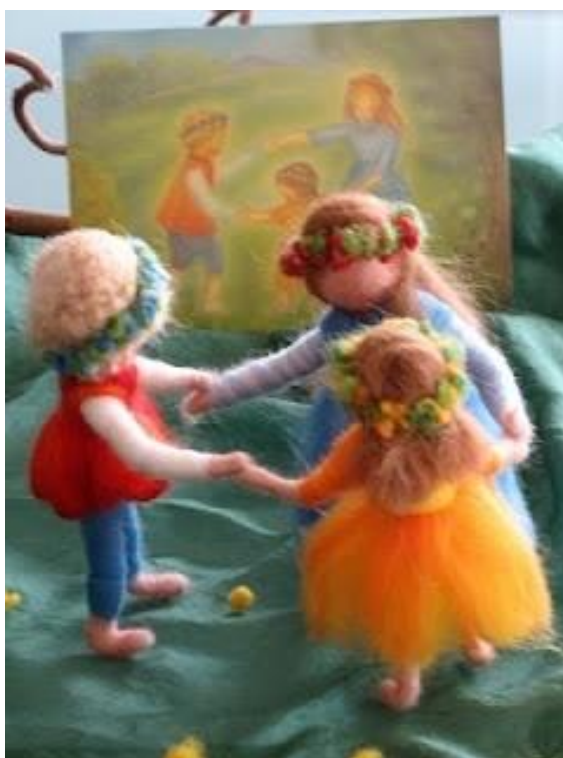
Slika 8: Vunene lutkice koje se drže u kolu 14

Kolo je igra koja se izvodi u krugu, a glavni elementi su joj govor i pokret. Ritmičkim kretanjima u kolu potiče se dječja prirodna radosti pri samom kretanju. Pokret je neodvojiv segment djetetova bića; dijete je stalno u pokretu, a ono uz pomoć ritmičkog kola uči kako uskladiti pokrete svoga tijela. Djeca se spontano pridružuju kolu i u skladu sa svojim mogućnostima oponašaju pokrete i zauzimaju određene uloge. Pokreti koji se oponašaju u kolu mogu biti na primjer; vjetar kako puše, seljak koji sadi, let ptice, cvijeće kako se njiše na vjetru, itd. Smisao ritmičkog kola je da se u njemu izmjenjuju govor, glazba i pokret kako bi dijete doživjelo cjelovitost riječi, zvuka i pokreta. Također djeca, osim navedenog, pomoću ritmičkog kola usvajaju osjećaj pripadnosti grupi, razvijaju toleranciju jedni prema drugima, razvijaju govor i fleksibilnost tijela, razvija im se koncentracija i pažnja kao i osjećaj za lijepo te razvijaju osjećaj za pravilnu izmjenu ritmova.