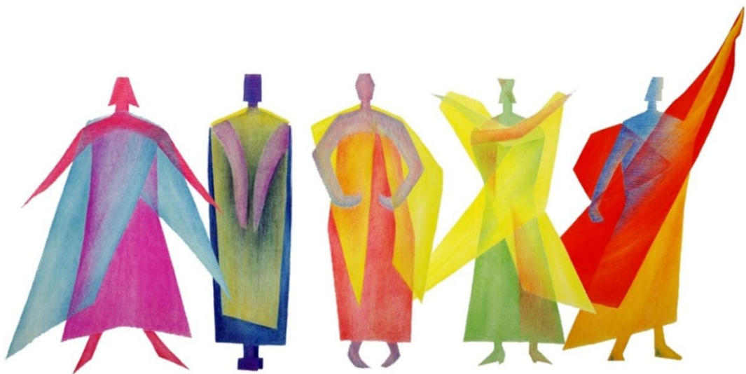
Slika 9: Pokreti u euritmiji 15

Rudolf Steiner u svojim predavanjima navodi kako euritmija proizlazi iz osjećanja naše duše te da je ona zapravo gimnastika duše. Euritmija je dakle, stvaranje koje je proisteklo iz duše, a koje se služi čovjekovim pokretom i tijelom kao izražajnim sredstvom. Steiner navodi kako je etersko tijelo čovjeka u neprekidnom pokretu, a da rođenje eteričnog čovjeka počinje jezikom (Steiner, 1995). „Euritmija je vidljiv govor“ – navodi Steiner (1995, str. 24.). Drugim riječima, euritmija je umjetnost izražavanja pokretom gdje ulogu riječi preuzima pokret tijela. Različitim gestama i pokretima u euritmiji pokušava se izraziti sam zvuk i govor kroz različite pokrete. U euritmiji svako slovo i zvuk ima svoj izraz u