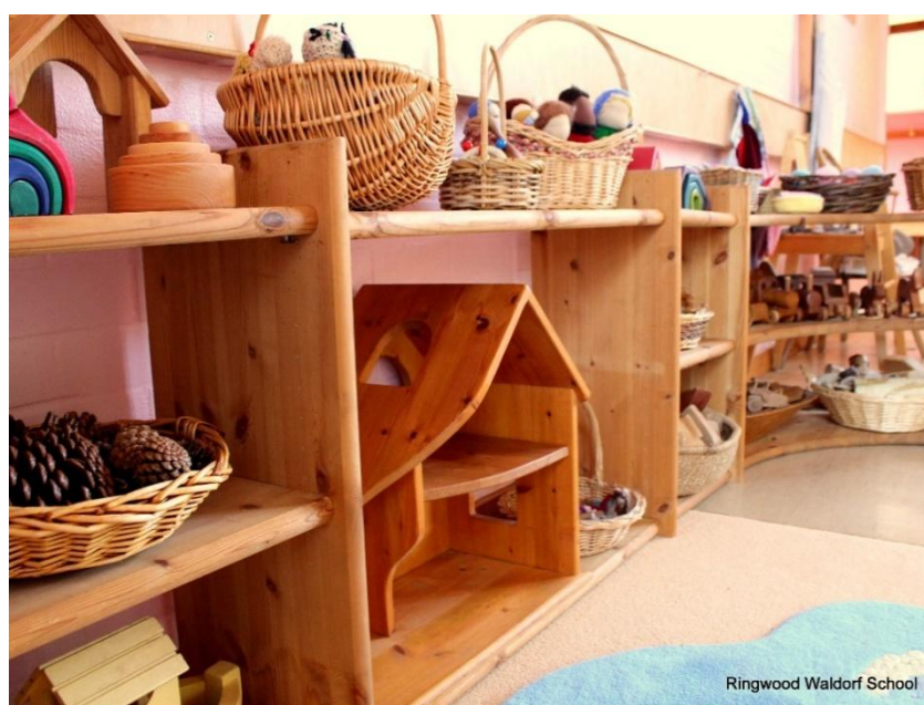
Slika 7: Waldorfske igračke od prirodnih materijala 13

nju izrazi ujedinjenje prirode, materije i duha. Prvotno je bila izgrađena iz drveta. U skladu s time, waldorfska pedagogija teži pri oblikovanju prostorija u waldorfskim vrtićima organskog arhitekturi gdje prevladavaju oblost, glatki rubovi i skladnost čitavog prostora u kojem djeca borave. Također, djeci treba omogućiti boravak na svježem zraku i u prirodi. Njima priroda nije strana već im je čak bliža nego nama odraslima. Ključno je djetetu omogućiti povezivanje sa četiri elementa prirode, a to su zemlja, voda, zrak i vatra. To se može ostvariti kroz pričanje priča u kojima se provlači tema o četiri elementa, zatim kroz različite umjetničke aktivnosti koje su primjerene dobu u kojem se provode, slavljenje svetkovina, itd.