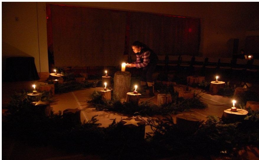
Slika 4. Spiralni krug od borovih grančica koji se radi za vrijeme Adventa 9

Djeca se opraštaju od ljeta, jedna od drugih, od svojih odgojiteljica, a neka djeca sa sljedećim ciklusom kreću u školu te započinju novo razdoblje svojega života (Seitz i Hallwachs 1996).