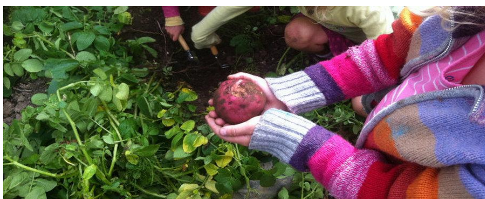
Slika 6: Rad djece u vrtu 12

Radne i praktične aktivnosti u waldorfskom vrtiću zauzimaju bitno mjesto. One su ključne kako bi dijete moglo odrasti u zdravu, odgovornu osobu. U radne i životno - praktičke aktivnosti spadaju; održavanje osobne higijene, samostalnost djeteta i ostale aktivnosti u koje ulaze kućanski poslovi (pospremanje, peglanje, šivanje, kuhanje, itd.), briga o životinjama i biljkama (hranjenje, zalijevanje, itd.) te izrada predmeta, igraćaka i poklona. Ukoliko se dijete od malih nogu privikava na zdrave i pozitivne navike, kasnije dijete neće imati poteškoća i problema u izvršavanju svakodnevnih radnih aktivnosti. Kroz ovakav odgoj djeca nauče kako napraviti kruh, kako šivati odjeću, nauče heklati ili štrikati, kako napraviti kompost ili kako napraviti hranilište za ptice ili hotel za kukce. Kroz brigu o životinjama dijete nauči kako uvažavati potrebe drugih bića te kako se prilagoditi njihovom ritmu postojanja. Jedno kroz njegovanje ovakvog odgoja djeca mogu odrasti u zdrave odrasle osobe i osigurati sebi, a i drugima, bolju budućnost.