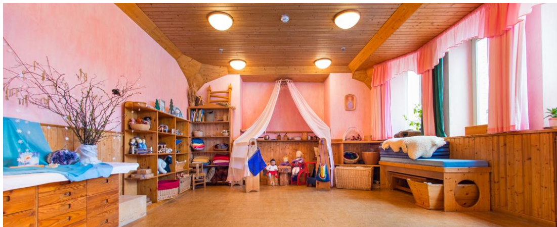
Slika 3 : Interijer waldorfskog vrtića 5

Koncept waldorfskog vrtića je takav da nema klasičnog plana i programa, a osnovni principi odgojitelja u waldorfskom vrtiću su ritam i ponavljanje te primjer i oponašanje. Glavna misao vodilja je težnja za usklađivanjem djetetova duhovnog i zemaljskog dijela, pružajući mu veću slobodu u odgoju. Umjesto klasičnog plana i programa, tijekom pedagoške godine u waldorfskim vrtićima temelji se na ritmu povezanom s izmjenom godišnjih doba, a sastoji se od proljetnog, ljetnog, jesenskog i zimskog ciklusa. Također, bitnu ulogu u waldorfskom programu ima i obilježavanje važnih datuma kroz godinu. Ti datumi kroz godinu podrazumijevaju različite svetkovine u navedenim ciklusima. Osim navedenog, sklad planu i programu daje povezanosti između izmjene doba dana i izmjenom dana u tjednu.