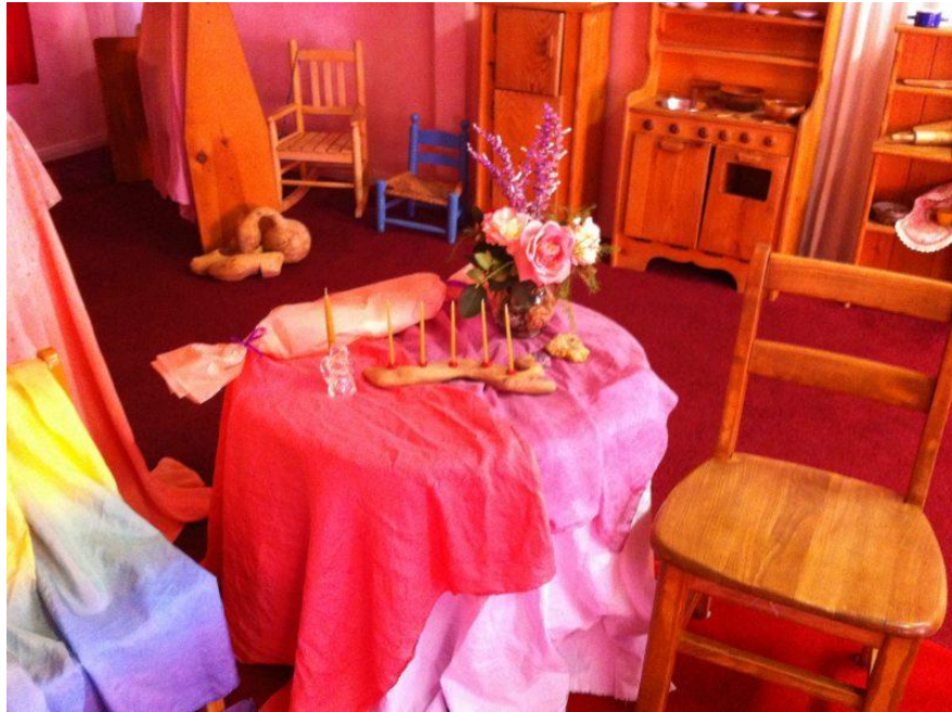
Slika 5: Proslava rođendana u waldorskom vrtiću 10

kronološkom dobi. Osim poklona za slavljenika, tu se nalaze i pokloni za ostalu djecu kako bi i oni također sa slavljenikom podijelili njegovu radost.