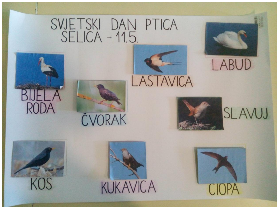
Slika 2 – Plakat s fotografijama ptica i njihovim nazivima