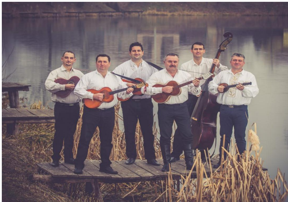
Slika 16. Tamburaški sastav Dike

Neke od njihovih poznatih pjesama su: Slavonac sam ja , Dado stari budi vridan , Bački ručak i Pisma Zvonku Bogdanu .