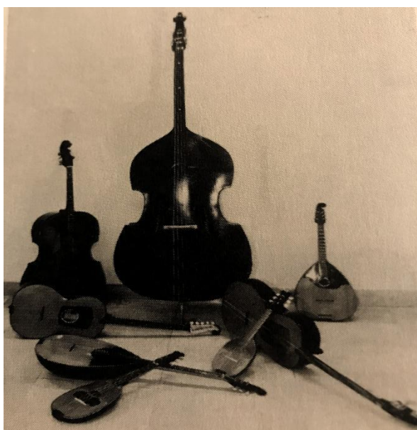
Slika 3. Troglasni kvintni sustav tambura (Leopold, 1995., str. 20)

Troglasni kvintni sustav nastao je koncem 19. stoljeća, otprilike onda kada je nastao i troglasni kvartni sustav. Troglasne kvintne tambure gotovo posve potiskuju dvoglasne, tzv. Farkaševske tambure 1 . Troglasne kvintne tambure najviše je promovao Slavko Janković 2 . Sastav tih tambura bio je: prva i druga bisernica (a 2 -d 2 -g 1 ), treća bisernica (d 2 -g 1 -c 1 ), prvi, drugi i treći brač (a 1 -d 1 -g), čelović (d 1 -g-c), čelo-brač (a-d-G), prva bugarija (g 1 -d 1 -h), druga bugarija (d 1 -h-g) i berde (Aa-Dd-G). Takav sustav tambura zbog nježnijega zvuka i većega broja dionica prikladan je za orkestralno muziciranje. Danas se taj sustav koristi u tamburaškom orkestru Hrvatske radiotelevizije (Leopold, 1995).