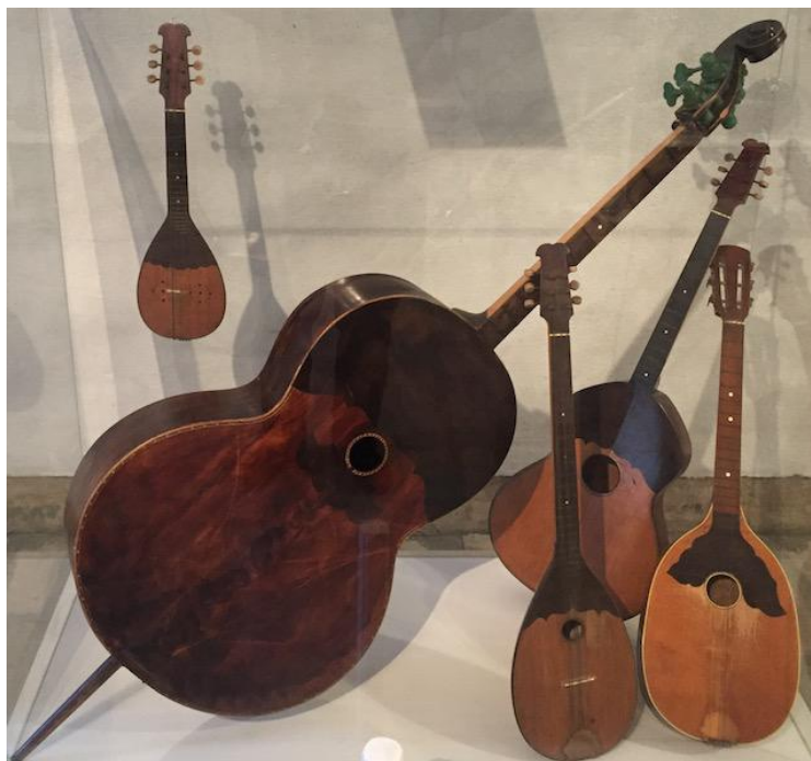
Slika 5. Dvoglasni kvintni ili Farkašev sustav tambura 3