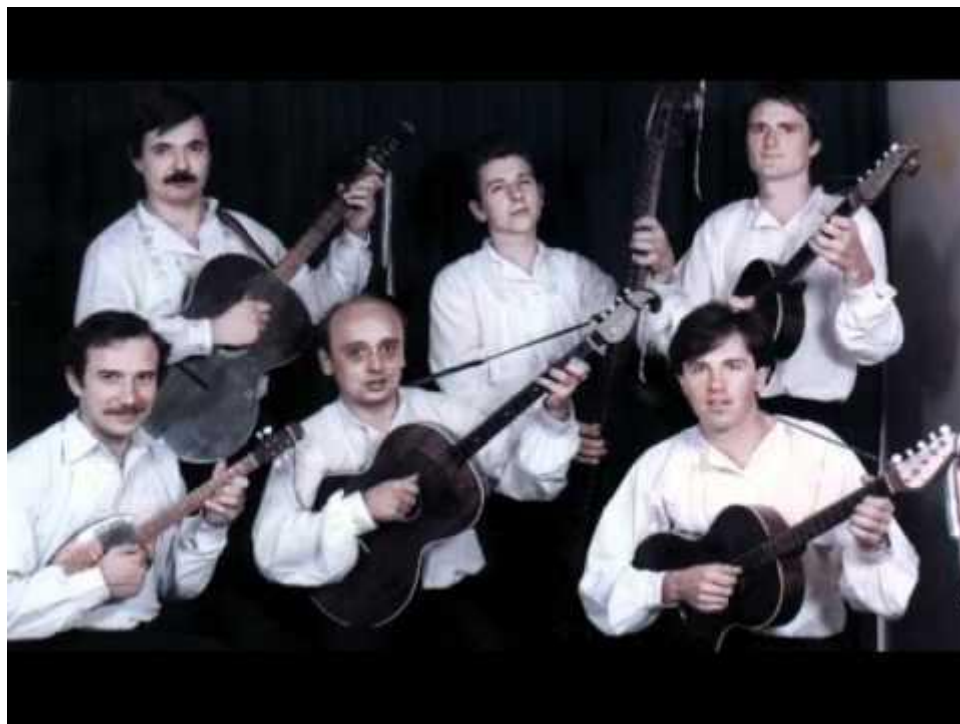
Slika 13. Tamburaški sastav Ex Panonia 23

Estradom se smatra usmjerenje glazbenika i drugih scenskih umjetnika na lakše i kratke zabavne forme i sadržaje koji se izvode na pozornici. Takva je glazba dominantna na medijskoj sceni i diskografiji. U tamburaškoj glazbi svoj vrhunac doživljava krajem 20. i početkom 21. stoljeća (Ferić, 2011).