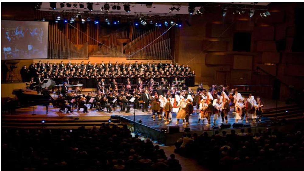
Slika 6. FA Ivan Goran Kovačić 8

Sveučilišni odbor 1948. godine osniva Kulturno-umjetničko društvo studenata Sveučilišta u Zagrebu Ivan Goran Kovačić . Gore spomenuti ansambl već sedamdeset i dvije godine pjesmama, plesovima i sviranjem čuva narodnu kulturnu baštinu Republike Hrvatske. Ansambl je sa svojim repertoarom sudjelovao na brojnim smotrama folkloru u Hrvatskoj, a predstavio se Hrvatima i strancima u većini zemalja Europe, zatim u SAD-u, Kini, Kanadi, Brazilu, Venezueli, Peruu, Novom Zelandu, Australiji, Ujedinjenim Arapskim Emiratima i Izraelu. Veliko bogatstvo ansambla, kojim se naročito ponose, predstavlja i 650 kompleta narodnih nošnji iz cijele Hrvatske, dijelom originalnih, a dijelom rekonstruiranih, od kojih se neke procjenjuju kao muzejska vrijednost. Ovaj bogati fond plod je, ponovno, dugogodišnjega rada folklornih istraživača na terenu, gdje su brižljivo birani i otkupljivani dijelovi nošnji, a koje su potom generacije goranovaca čuvale, održavale i obnavljale. Danas Ansambl djeluje pod vodstvom vrsnih folklornih stručnjaka, a broji 80 članova – plesača, pjevača, tamburaša – većinom studenata iz cijele Hrvatske. 7