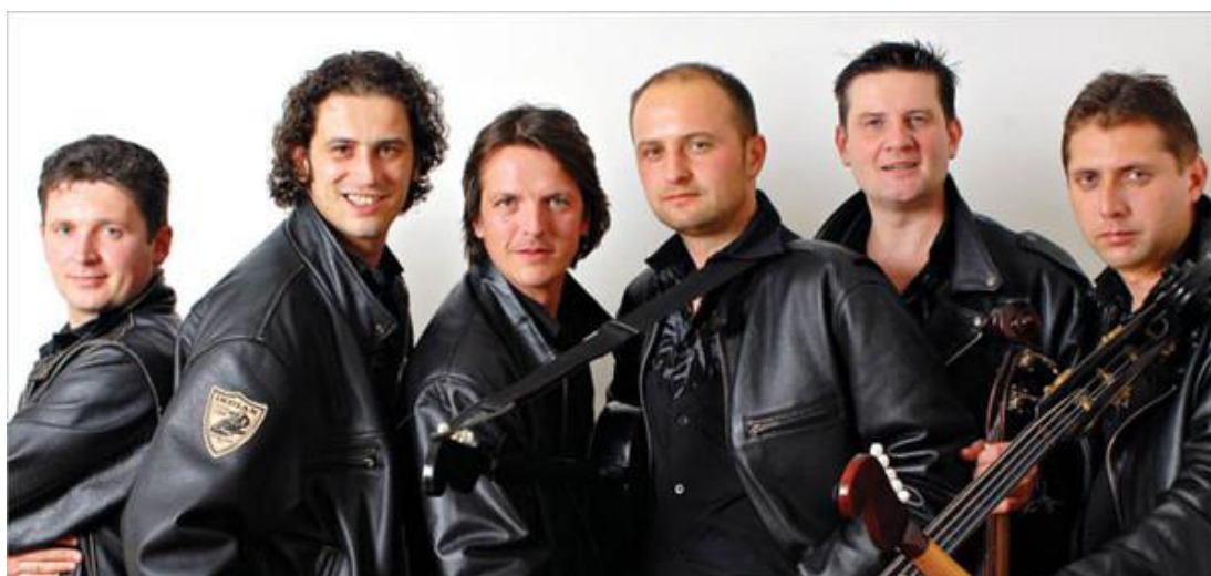
Slika 18. Gazde 29

Prvi put pojavili su se na Požeškom festivalu 1993. godine s pjesmom Zbog tebe sam to što jesam . Na pozornicu su izašli u kožnim jaknama i hlačama što je kasnije postao njihov svojevrsan simbol. Tamburu su približili mladima.