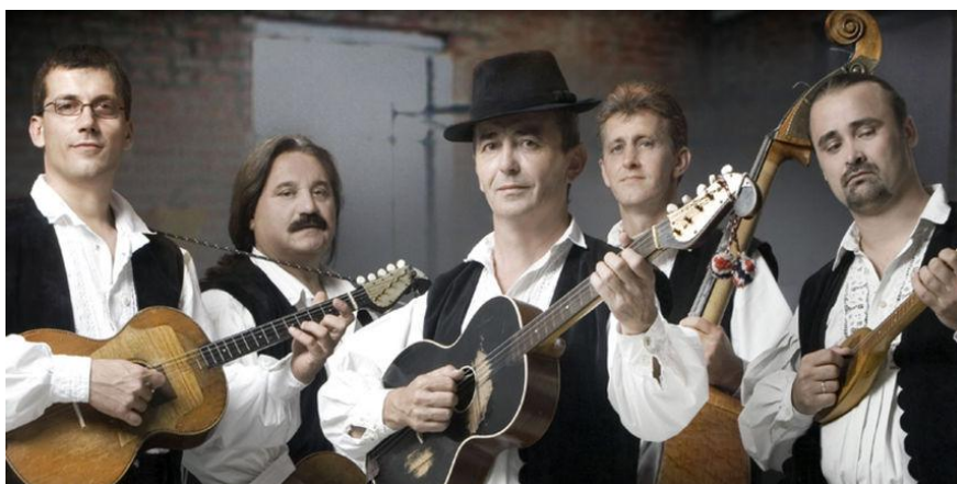
Slika 17. Tamburaški sastav Slavonske lole 28

Među najpoznatije i najplodonosnije sastave svakako spadaju i Tamburaški sastav Slavonske lole . Sastav potječe iz mjesta Velika Kopanica. Pod imenom Slavonske lole djeluju od 1981. godine. Kako navodi Ferić (2011), Slavonske lole , uz Tucine Slavonske bećare , najuvjerljivije stvaraju pjesme čiji su stihovi bliski pučkoj lirici i tradicijskoj glazbi ukrašeni šablonskim harmonizacijama pučke glazbe, ali akordno osuvremljene i obogaćene. Sastav ima mnogo uspješnih i poznatih pjesama od kojih svakako valja istaknuti: Sve je ona meni , Prijatelju nije lako , Mojoj Kati , Ledina i druge.