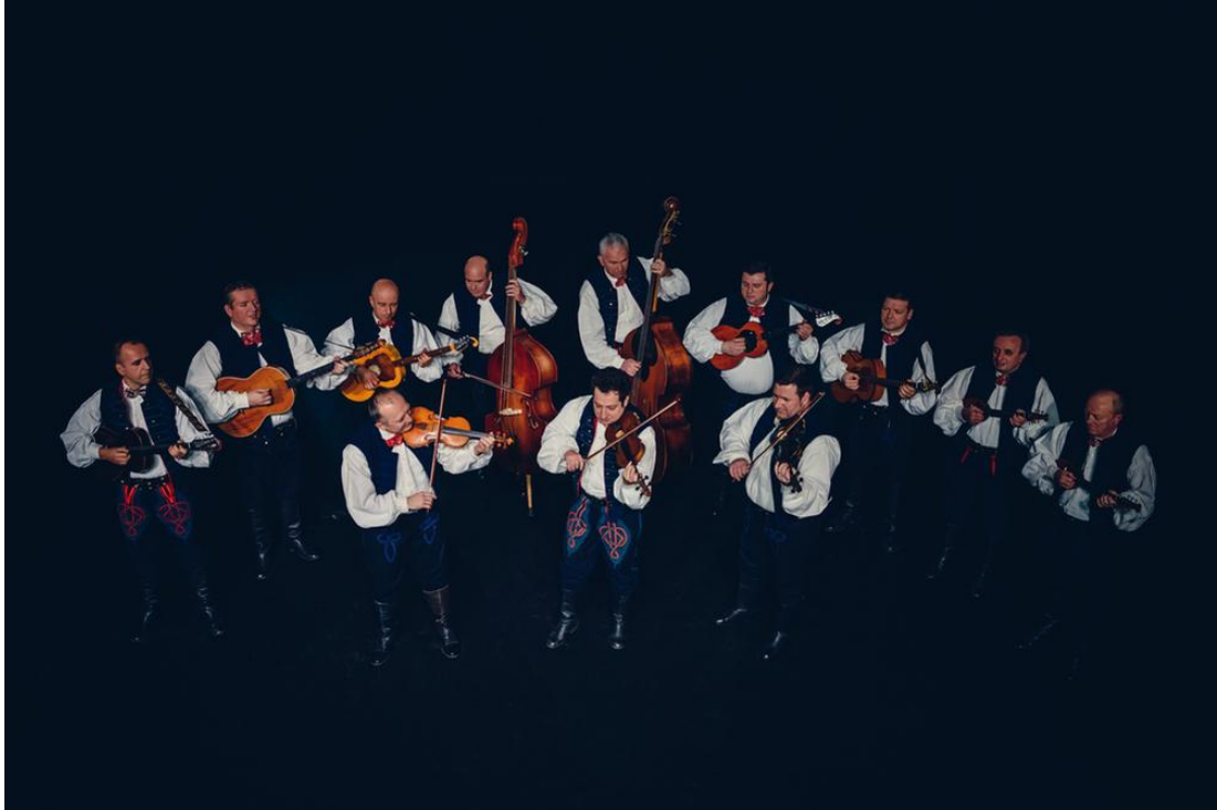
Slika 7. Tamburaški orkestar ansambla Lado

Članovi ansambla Lado imaju nebrojeno zapaženih nastupa diljem svijeta. Nastupali su na najpoznatijim svjetskim pozornicama i podijima, a neki od njih su: Royal Albert Hall u Londonu, teatar na njujorškom Broadwayu, moskovska Koncertna dvorana Čajkovski, kao i na brojnim festivalima, svjetskim izložbama, Olimpijskim igrama i ostalim manifestacijama i događanjima. Za svoj rad i zasluge dobivaju mnoge zahvale i priznanja kao što su 24 Porina , pet Nagrada grada Zagreba, nagradu Orlando na 54. Dubrovačkim ljetnim igrama, Povelju Predsjednika Republike Hrvatske za 60 godina umjetničkoga djelovanja 2009. godine. Godine 2002. Lado je bio predstavnik Europe na šestom Svjetskom simpoziju zvorske glazbe u Minneapolisu.