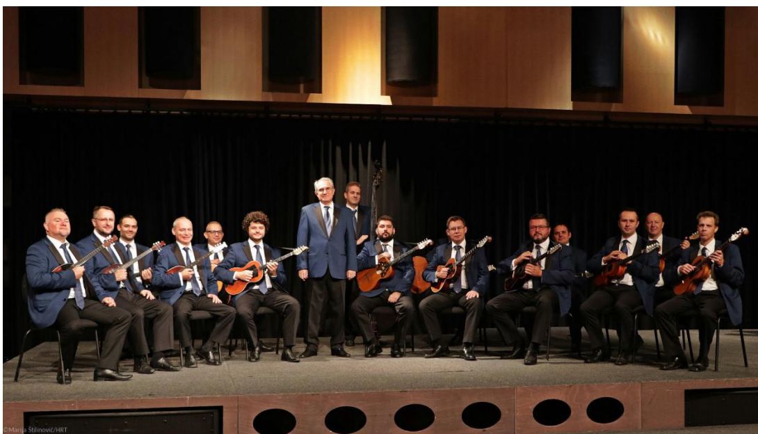
Slika 10. Tamburaški orkestar HRT-a 16

U Republici Hrvatskoj, a i šire, djeluje puno tamburaških orkestara kao što su Tamburaško društvo Ferdo Livadić , Tamburaški orkestar glazbene škole u Požegi i mnogi drugi, ali svakako, na vrhu tamburaškoga orkestralnog muziciranja nalazi se Tamburaški orkestar Hrvatske radiotelevizije. Orkestar je osnovan 1941. godine, a od 1985. godine, pa sve do danas njime ravna dirigent Siniša Leopold. Sam u svojoj knjizi Tambura u Hrvata (1995) navodi kako je orkestar poznat po visokim interpretacijskim dometima i po širini programa koji izvode. Njihov cilj je čuvanje hrvatske narodne pjesme, ali i promicanje novih izraza u tamburaškoj glazbi (Leopold, 1995).