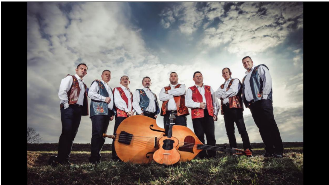
Slika 15. Tamburaški sastav Berde band 26