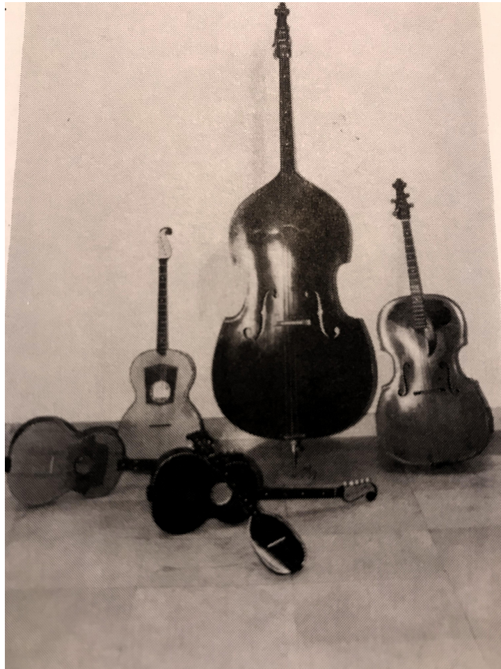
Slika 2. Srijemski sustav tambura (Leopold, 1995. str. 19)

e 1 -h 1 -fis 1 -cis 1 ), prvog i drugog brača, odnosno basprima ili A-brača (oba a 1 -e 1 -h-fis), trećeg ili E-brača (e 1 -h-fis-cis), čela (a-e-H-Fis), bugarije ili E-kontre (e 1 -h-gis-e) i berdeta ili tamburaškoga basa (A-E-H-Fis). Valja spomenuti da tambure toga sustava zvuče čvrsto i rezonantno. Također, tambure toga sustava do Prvoga svjetskog rata imale su kruškolik oblik, ali pod utjecajem peštanskih graditelja, svirači su počeli prihvaćati tambure gitarskoga oblika koji prevladava i danas (Leopold, 1995). Leopold (1995, str. 20) ipak ističe da bi se takav sustav trebao nazivati slavonske tambure : „Analizirajući današnje prilike koje su prisutne u tamburaškoj glazbi i općenito, a s obzirom da se u cijeloj Slavoniji svira isključivo kvartni e-sustav, mislim da bi za taj sustav bio najpriprereniji naziv - slavonske tambure .”