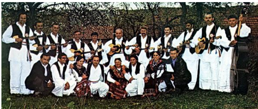
Slika 12. Tamburaški sastav Tamburica iz Starog Petrovog Sela 22