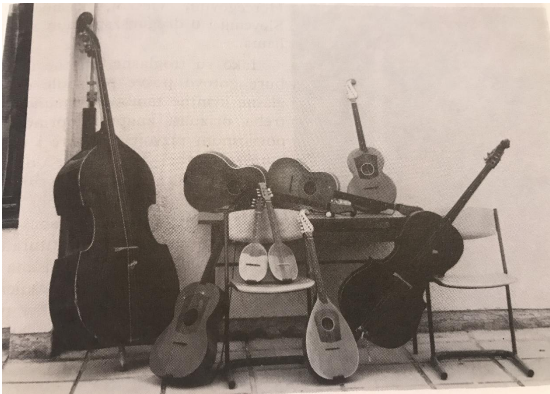
Slika 4. Četveroglasni kvartni g-sustav tambura (Leopold, 1995., str. 21)

Četveroglasni kvartni g-sustav po svojoj je rasprostranjenosti odmah iza četveroglasnoga kvartnog e-sustava. Vrlo je sličan e-sustavu, jedino je u tom sustavu ishodišni ton g. Sastav dionica takvoga sustava je: prva i druga bisernica ( g_2-d_2-a_2-e_1 ), treća bisernica ( d_2-a_1-e_1-h ), prvi, drugi i treći brač ( g_1-d_1-a-e ), čelović ( d_1-a-e-H ), čelo ( g-d-A-E ), prva bugarija ( g_1-d_1-h-g ), druga bugarija ( d_1-a-fis-d ) i berde ( G-D-A-Fis ). U ovom sustavu sve diomice imaju jednake nazive žica (osim bugarija) pa je prelazak svirača s dionice na dionicu vrlo jednostavan (Leopold, 1995).