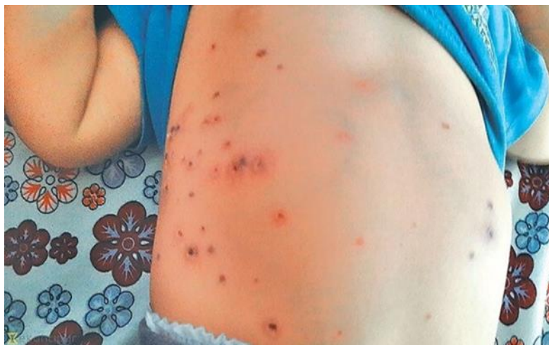
Slika 3. Prikaz rozeola kod trbušnog tifusa.

U Hrvatskoj je 2012. zabilježen samo jedan slučaj oboljelog od trbušnog tifusa (Aleraj, 2013). Isti broj se ponovio 2016. godine (Kurečić Filipović, 2016).