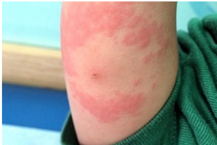
Slika 4. Širenje crvene papule ili osipa nakon uboda krpelja.

Klinička slika ukazuje da se bolest razvija u tri stadija: rani, lokalizirani stadij; rani, diseminirani stadij i kasni stadij. U ranom, lokaliziranom stadiju, uobičajeno 1 do 2 tjedna poslije dodira s krpeljom, na mjestu uboda pojavi se crvena, bezbolna papula koja se širi do promjera 10-15 cm i više (Slika 4.). Uz to moguća je vrućica, glavobolja, regionalni limfadenitis i artralgijska. U ranom, diseminiranom stadiju infekcija se očituje na zglobovima, živčanom sustavu, srcu ili koži (tipičan borelijski limfocitom). Javlja se tjednima ili mjesecima nakon infekcije, dok kasni stadij bolesti počinje jednu ili više godina poslije infekcije. U kasnom stadiju moguć je kronični artritis, kronični progresivni borelijski encefalitis, periferni neuritis i drugi oblici bolesti. Bolest se dijagnosticira na temelju prepoznatljive kliničke slike.