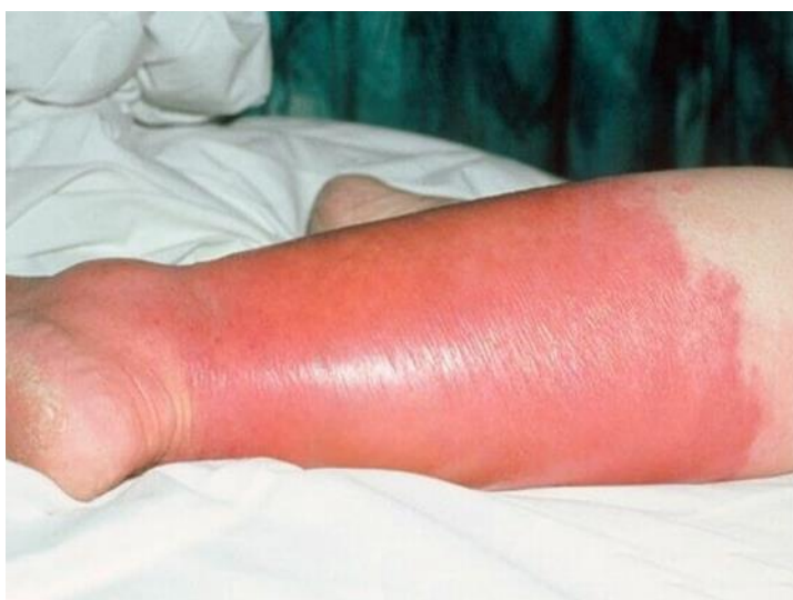
Slika 2. Prikaz crvenila ili upale kože kod erizipela.

flegmone. Erizipel ima oštro ograničeno crvenilo, osjećaj je da koža peče i uvijek počinje općim simptomima infektivne bolesti. Flegmona nema oštro ograničeno crvenilo, bolna je i nastaje širenjem streptokoka u dublje slojeve kože. Liječenje je antimikrobno, isto kao za streptokoknu anginu i skarlatinu (Mardešić i sur., 2003). Razvoj bolesti se može usporediti sa šumskim požarom, najaktivnije i crvenije na rubovima. Bolest najčešće pogađa mlađu djece i starije (Southwick, 2007). U Hrvatskoj je 2012. zabilježeno 1262 oboljelih od erizipela (Aleraj, 2013), dok je 2016. zabilježeno 1028 oboljelih (Kurečić Filipović, 2016).