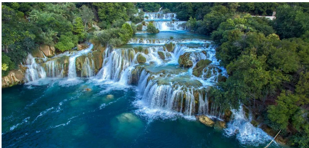
Slika 11. Skradinski buk u NP Krka.

buk sa svojih 17 stepenica na dužini od 800 m, visinom od 45,7 m i širinom 200-400 m najveće je sedreno slapište u Europi. U podnožju Skradinskog buka počinje potopljeni dio Krke (estuarij), odnosno dio u kojem se miješaju riječna i morska voda, stvarajući akvatorij sa specifičnim živim svijetom bočatih voda.