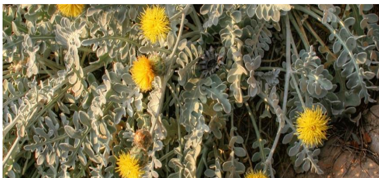
Slika 4. Dubrovačka zečina.