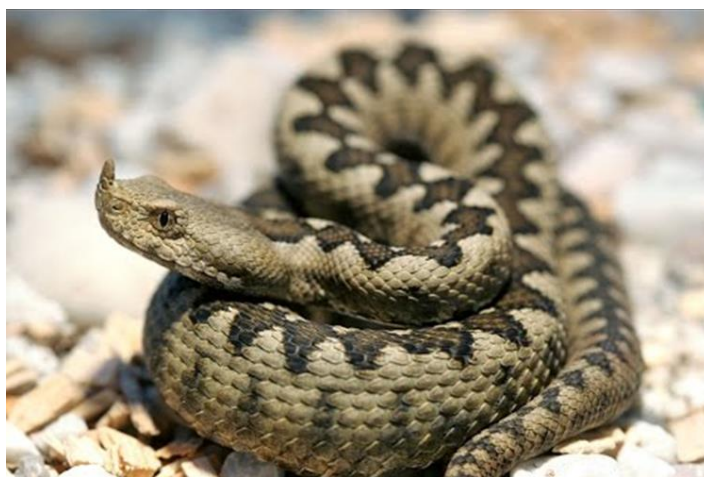
Slika 6. Poskok.

Pari se potkraj travnja do početka svibnja, a ženka od rujna do listopada okoti 10 do 20 mladih, koji odmah poslije izlaska iz majčina tijela probiju nježnu opnu jajeta. Životni vijek mu je do 15 godina. Neprijatelji su mu ptice grabljivice i male zvijeri, posebno orao zmijar i mungosi. Voli suha kamenita područja s dosta grmlja. Aktivan je većinom noću, a danju sklupčan spava probavljajući hranu. Sporiji je, tromiji i otrovniji od ridovke. U hladnijim krajevima spava zimski san, a posebno je opasan u jesen, kada se penje na drveće gdje dočekuje ptice, a tada lako strada i čovjek, ako neoprezno prolazi i dotakne ga. Ugriz poskoka za ljude može biti smrtonosan i zato je potrebno dobro paziti prilikom boravka u prirodi. Zakonom je strogo zaštićen i ne smije ga se ozljeđivati, ubijati te uzimati iz prirode.