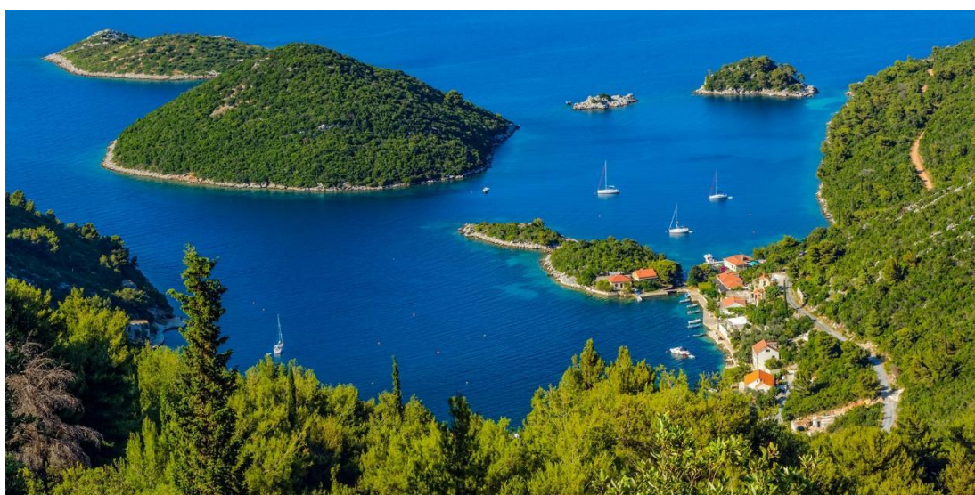
Slika 12. Šume i bujna vegetacija Mljeta.

Nacionalni park Mljet, prvo morsko zaštićeno područje u Hrvatskoj, osnovan je 11. studenog 1960. godine. Obuhvaća površinu od 31 km 2 , uključujući i morski pojas 500 m od obale, otočića i hridi te tako zauzima otprilike 1/3 otoka. Morem potopljene zaljevi, Malo i Veliko jezero, najistaknutije su lokacije ovog područja te važan geomorfološki i oceanografski fenomen. Glavni motivi za status nacionalnog parka izuzetna su specifična obalna razvedenost te bujan biljni svijet (Slika 12.), odnosno šumovitost područja.