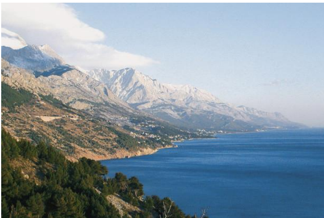
Slika 15. Biokovo.

Biokovo (Slika 15.) je dio planinskog masiva Dinarida i kao takvo ima smjer pružanja SZ-JI. Podnožje središnjeg dijela Biokova je blago nagnuta zaravan, koja se od mora izdiže do visine od oko 300 m, a uzevši u obzir da je oblikovana pretežito u fliškim naslagama, plodna je i zelena. Primorska strana Biokova strmo se ruši prema moru. Povrh tih stijena pruža se regija koja ima oblik valovite visoravni, široka je 3-4 km, karakterizira ju bogato razvijen krški reljef, a prema zaleđu se blago i postupno spušta. Od krških pojava i oblika, ovdje se susreću površinski oblici – egzogeni krš, te dubinski oblici – endogeni krš. Površinske krške oblike predstavljaju: grižine ili škrape, ponikve, uvale i okršene doline, a od endokrških formi oblikovane su brojne jame i špilje (duboke čak i do nekoliko stotina metara).