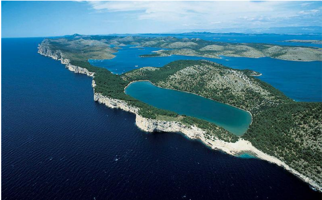
Slika 13. PP Telašćica.

Na ovom području ističu se tri fenomena (Slika 13.): jedinstvena uvala Telašćica kao najljepša i najveća prirodna luka u Jadranskom moru, strnci Dugog otoka, tzv. „stene“ (uzdižu se do 161 m iznad mora te se spuštaju u dubinu od 90 m), te slano jezero Mir poznato po svojim ljekovitim svojstvima.