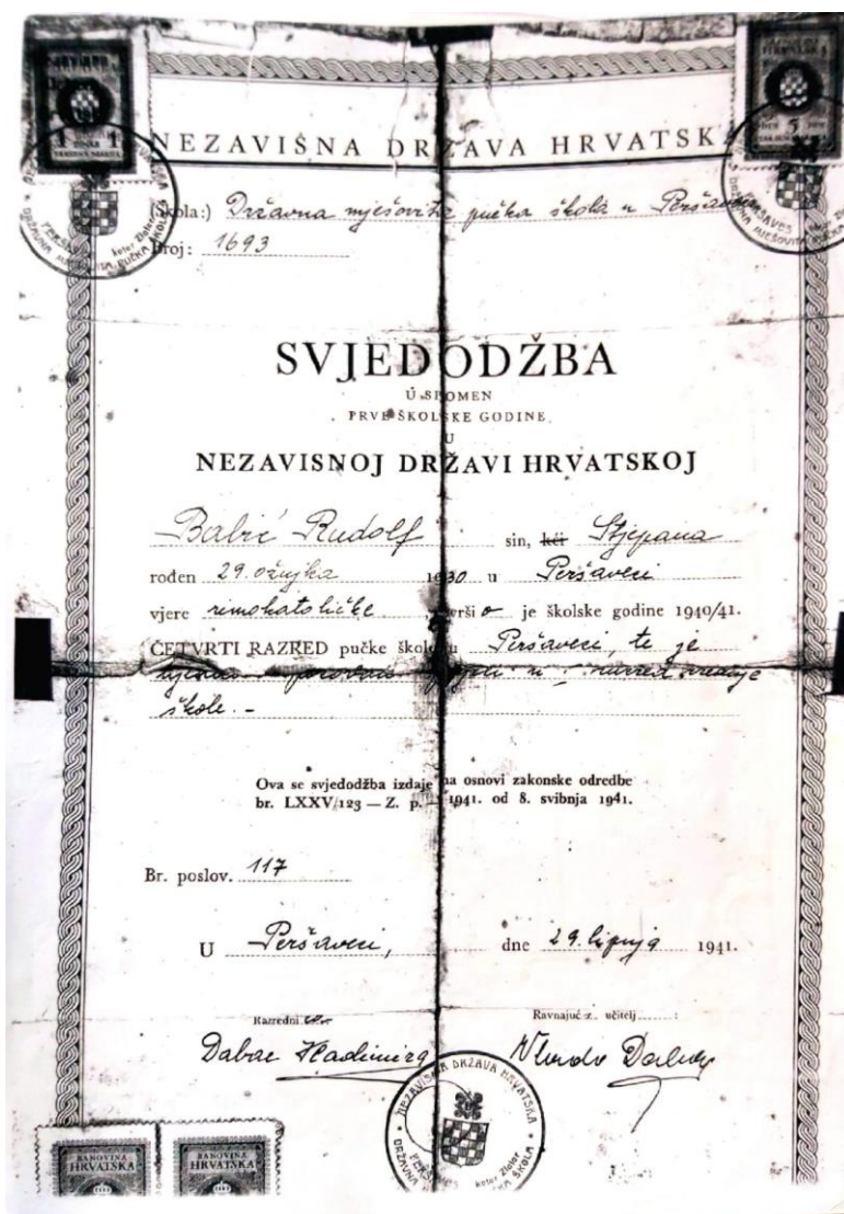
Slika 4. Svjedodžba Državne pučke mješovite škole Peršaves, 1941.

“Prosvjetne vlasti Nezavisne Države Hrvatske odmah 1941. mijenjaju sve školske propise pa i model ocjenjivanja učenika.” (Matijević, 2004, str. 41). U dvjema svjedodžbama iz 1941. ne navode se učenikove ocjene i postignuća već se samo navodi kako je učenik sposoban prijeći u viši razred (Slika 4 i 5) za razliku od sljedeće školske godine kada se uvodi ljestvica školskih ocjena za nastavne predmete (izvrstan (1), vrlo dobar (2), dobar (3), dovoljan (4), nedovoljan (5)) te ocjene za vladanje (uzorno (1), pohvalno (2), dobro (3), slabo (4)) po uzoru na njemački sustav (Matijević, 2004).