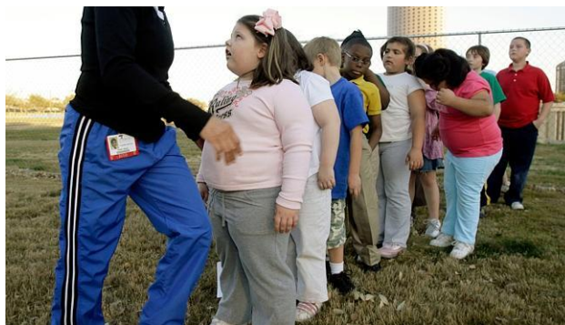
Slika 3 Grupa pretilih djece

Neadekvatna prehrana i tjelesna aktivnost te uzrokujući unos energije veći od potrošnje, najvažniji su čimbenici rizika od epidemije modernoga doba - pretilosti. Suvremeno se društvo suočava sa sve većim javnozdravstvenim problemom rastućeg broja pretilih osoba svih dobnih skupina, a osobito zabrinjava trend povećanja broja pretilih djece. Osobito je važno praćenje prehrane i stanja uhranjenosti djece i mladeži, jer su te ugrožene skupine u razdoblju najbržeg rasta i razvoja, pa su ujedno i dobar pokazatelj prehrambenog stanja u lokalnoj zajednici. Nepravilna i nedostatna prehrana može značajno utjecati na rast i razvoj djece i mladeži, te privremeno ili čak trajno ugroziti njihovo zdravstveno stanje (Antonić-Degač, K., 2004.)