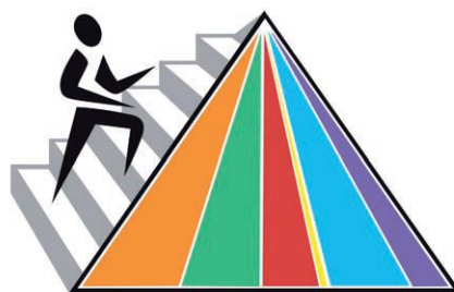
Slika 2 Moja piramida

http://www.plivamed.net/aktualno/clanak/5348/Piramida-pravilne-prehrane-nekad-i-danas.html