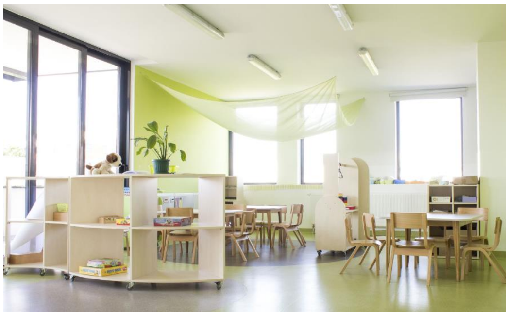
Slika 5. Soba dnevnog boravka ustanove za rani predškolski odgoj

Izvor: https://www.gam-interijer.hr/hr/referenca/djecji-vrtic-carobna-suma-buzin