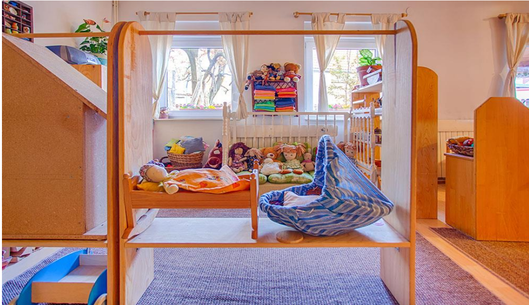
Slika 2. Unutrašnjost waldorfskog dječjeg vrtića 3