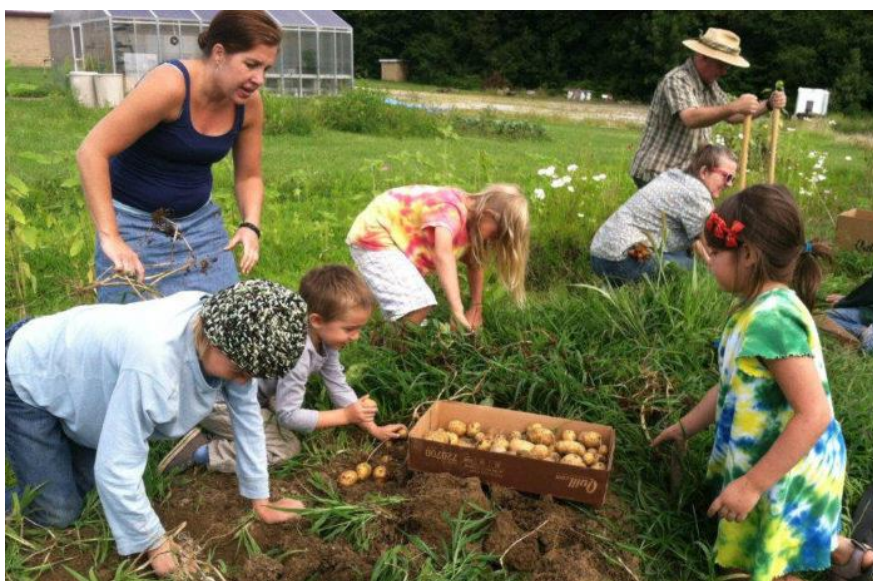
Slika 7. Rad u vrtu 10

Životno-praktične aktivnosti nazivamo još i radnim aktivnostima. U waldorfskim vrtićima one su za dijete od velike vrijednosti i zauzimaju bitno mjesto u svakodnevici i dnevnim ritmovima. Djeca uče po modelu odraslih i na taj način po uzoru odgojiteljice uključuju se u razne životne, svakodnevne aktivnosti. Radne aktivnosti kod djeteta razvijaju empatiju, samopouzdanje i dijete izrasta u odgovornu osobu. U životno-praktične, radne aktivnosti spadaju aktivnosti poput pospremanja i izrade igračaka, pranja lutkine odjeće, vješanje i sušenje iste, održavanja osobne higijene, priprema zimnice, priprema kolača, kruha i obavljanja ostalih kućanskih poslova u koje uvrštavamo peglanje, kuhanje, rezanje, šivanje. Razvoj zdravih i pozitivnih navika kod djeteta od najranije dobi rezultira kasnije većom samostalnošću i odgovornošću prilikom obavljanja određenih aktivnosti. Životno-praktične aktivnosti javljaju se i izvan prostorija odgojne skupine. Rad u vrtu iziskuje poseban trud i napor kako bi plodovi kasnije bili ukusni. Tako djeca sudjeluju u prekopavanju vrta, sadenju novih biljaka, brizi o biljkama, a i životinjama koje se nalaze u vrtu. Briga o živim bićima kod djece budi svijest o uvažavanju i zadovoljavanju potreba drugih, o odgovornosti koja se preuzima kako bi ono moglo preživjeti. Sve nabrojene aktivnosti u konačnici pridonose razvitku emocionalno zdrave i intelektualne djece.