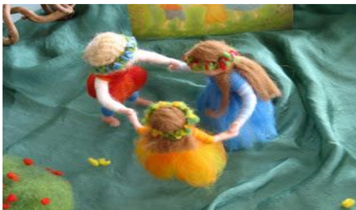
Slika 6. Vunene lutkice u kolu 9

Kolo je igra koja se izvodi u krugu, a pokretom se izražava dječja spontanost i radost. Ova aktivnosti nudi razvoj mnogim od razvojnih zadaća i omogućuje djeci da steknu samostojnost, samosvijest i pozitivnu sliku o sebi, nudi im osjećaj pripadnosti grupi. Potiče razvoj osjetljivosti i tolerancije prema drugima, fleksibilnost pokreta. Ujedno, potiče razvoj kreativnosti i mašte, koncentracije i pažnje i djeca imaju prilike steći osjećaj za pravilnu izmjenu ritma.