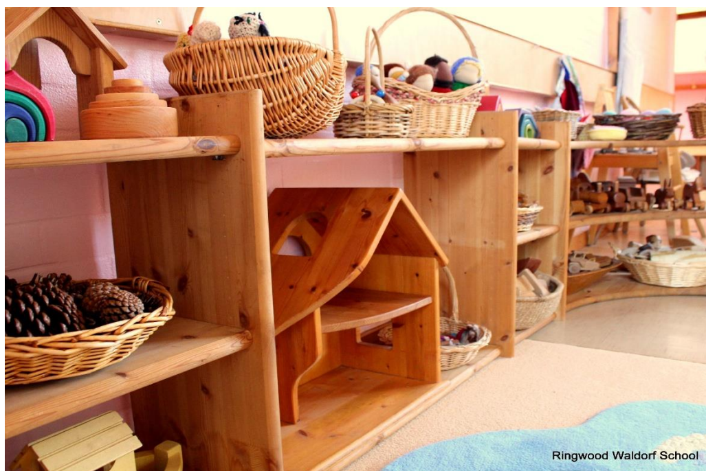
Slika 3. Igračke od prirodnih materijala 4

navode: „Prirodni materijali potiču dijete na upoznavanje svijeta – kao što to čine odijevanje, hranjenje i sve drugo što ga okružuje.“ Važno mjesto u odgoju djeteta zauzima modeliranje, šivanje, pletenje, rezbarenje i izrada krpenih lutaka koje krase prostorije svake odgojne skupine. Didaktička sredstva i igračke izrađene su na način da potiču dječju kreativnost, maštu i stvaranje vlastite priče. Na primjer, ručno izrađene lutke od marama ili lutke bez lica omogućuju djeci da zamisle i izraze njihov izraz lica što ih opet dovodi do sposobnosti izražavanja vlastitih emocija (Steiner, 1907). Na taj način maštovitost djeteta dolazi do izražaja jer se komad marama, drveta ili grančice može pretvoriti u bilo koju zamišljenu stvar ili oblik. Razvoj fine motorike ruku i taktilne percepcije omogućuju im materijali poput gline, pčelinjeg voska ili tijesto koje koriste za modeliranje. Slikovnica, poznata kao prva knjiga u životu djeteta u waldorfskim vrtićima rijetko se upotrebljava, dok lutke, životinje i ostala pomagala imaju svoje stalno mjesto i djeca ih odlažu u košare različitih veličina. Sav alat koji se upotrebljava je "pravi" alat, a kako djeca uče oponašanjem i promatranjem već nakon navršene treće godine života mogu samostalno zakucati čavao ili nožem oguliti jabuku (Seitz i Hallwachs, 1996).