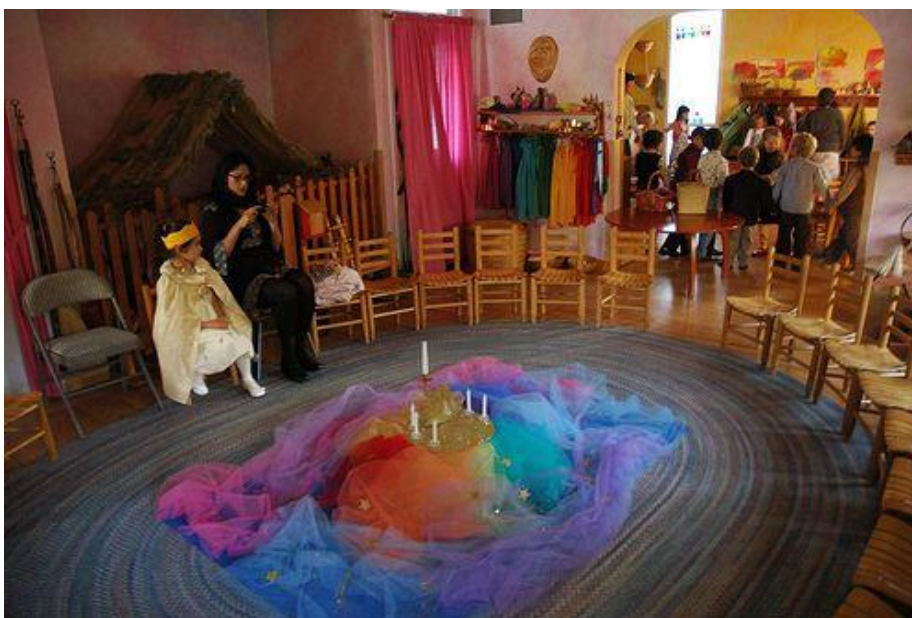
Slika 4. Proslava rođendana u waldorfskom vrtiću 6

U godišnjem ritmu posebno se pridaje velik značaj proslavi rođendana svakoga djeteta. Kako se dijete razvija prema ritmovima koji mu tvore sigurnu rutinu, u svaku svoju novu godinu ulazi s više znanja, iskustva i usvojenih vještina. Rođendan u waldorfskom vrtiću vrsta je rituala i djetetu se pridaje posebna pažnja i naglašava kako ono ima svoje posebno mjesto u svijetu. Ritual se sastoji od proslave, poklona i torte. Slavljenuk cijeli dan ima tu čast nošenja krune na glavi, dok ostala djeca slave njegov rođendan. Ostala djeca nose jednostavnije krune, dok je slavljenikova posebnija i kićenija. Svetkovni stol taj dan postaje rođendanski stol oko kojeg se u krugu okupljaju sva djeca, dok slavljenik sjeda na posebnu pripremljenu stolicu. Na stol se stavlja cvijeće, svijeće i šarene marame. Odgojitelj za slavljenika posebno izrađuje poklon od prirodnih materijala, uredi prostoriju odgojne skupine i priča priču o događajima iz djetetova života tijekom boravka u vrtiću. Pjevaju se prigodne pjesmice, slavljenik stavlja plašt i dijeli svoje poklone sa svom djecom kako bi zajedno podijelila radost slavljenja rođendana. Bez obzira što se jede za ručak, torta je uvijek prisutna (Seitz i Hallwachs, 1996).