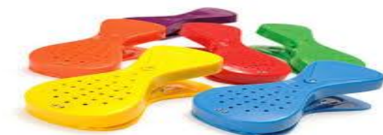
SLIKA 1. Štipaljke pričalice

Osim što razvijaju komunikacijske i spoznajne vještine, štipaljke pričalice također su korisne i za razvijanje vještina fine motorike. Mogu se koristiti na brojne načine, ovisno o potrebama korisnika. Idealne su za aktivnosti pričanja priče i redoslijeda radnje, slušanja i prepoznavanja nasnimljene poruke te razvijanja spoznajnih vještina (npr. učenje sheme tijela) ( https://www.eglas.hr/stipaljke-pricalice/ ).