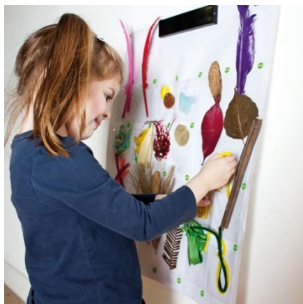
SLIKA 3. Interaktivni zid

Interaktivni zid može poslužiti kao vizualna podrška djeci na način da organizacija sličica i snimljenih poruka prati djetetov dnevni raspored u vrtiću ili da se koraci u aktivnostima prikažu u obliku sličica i zvučnih poruka (npr. oblačenje, pranje ruku, pripremanje jednostavnih obroka i sl.) ( https://www.eglas.hr/interaktivni-zid-2/ ).