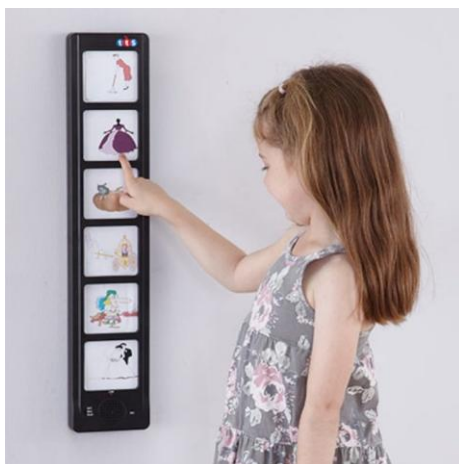
SLIKA 2. Pričajući raspored

Za reprodukciju prebacite način rada u "PLAY". Pritiskom na željeno polje reproducirat će se nasnimljena poruka ( https://www.eglas.hr/story-sequencer-pricajuci-raspored-2/ ).