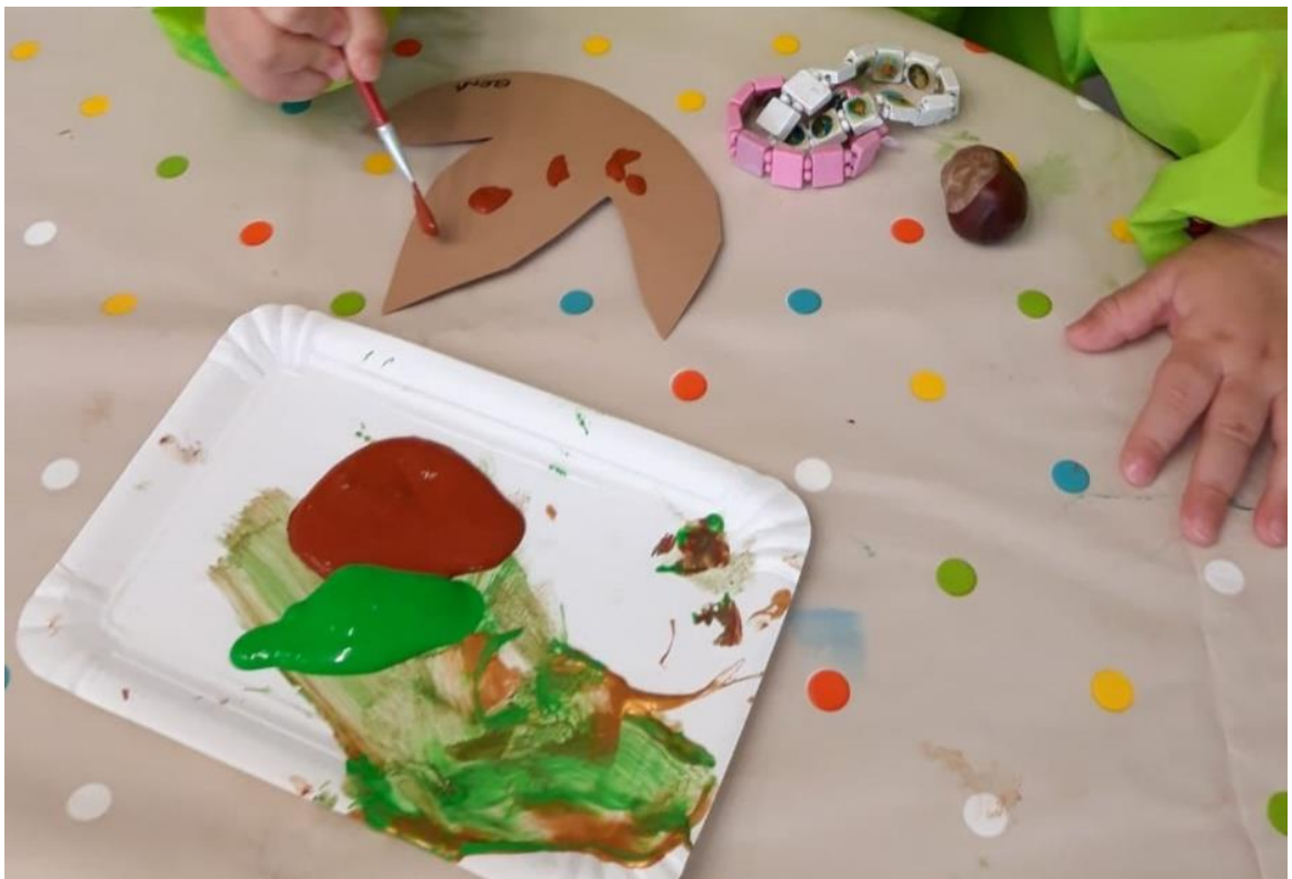
Slika 23. Bojanje lista- tempera

U jesenje doba djeca su istraživala lišće. Promatrala su ga povećalom, uočavala su strukturu, veličinu i boju. Budući da samostalno nisu uspjela nacrtati strukturu lista, donijela sam im predloške koji su bili izgledom jednaki listovima koje su imali u skupini.