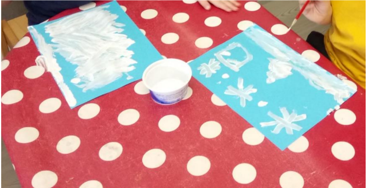
Slika 12. Slikanje snježnih pahuljica

su većinom slikala kuglice snijega te smo ih potaknuli na razmišljanje o tome kakve sve pahuljice mogu biti te smo im pokazali fotografije različitih struktura pahuljica. Starija djeca su tvrdila da ne postoje takvi pravilni kristali pahuljica koje smo im pokušali dočarati. Tada smo pronašli realne fotografije iz našeg vrtića na kojima je to vrlo dobro vidljivo. Slikajući, mlađa djeca su se divila kako bijela boja zaista može ostaviti trag na papiru te su na taj način proširila svoju spoznaju (slike 12 i 13).