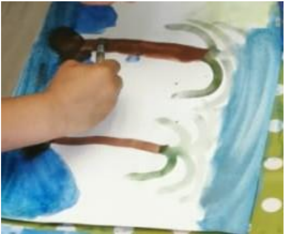
Slika 19. Djevojčica slika palmu

Ususret ljetu djeca dobi od 6 godina počela su spominjati odlaske na more. budući da u sobi skupine, u sklopu istraživačkog centra postoje različite verzije školjaka, djeca su ih odlučila istražiti. Djeca dobi 4 godine redom su donosila školjke i pokazivala kako se prislanjanjem školjke na uho može čuti zvuk mora. To nas je potaknulo na likovnu aktivnost slikanja morem. Najpogodnija tehnika za to je akvarel. Naime, namjera je bila likovnom tehnikom dobiti prozračnost i prozirnost mora. Prije likovne aktivnosti razgovarali smo o tome koje boje može biti more. Dogovor s djecom je bio da svatko prikaže more onom bojom za koju smatra da je boja mora. Sukladno tome, dobiveni su različiti likovni uratci, koji su bili individualni prikazi mora svakog od djece. Jedan od radova prikazivao je i palme (slika 19). Djevojčica od 6 godina uspješno je prikazala sve boje mora te pažljivo oslikavajući uvidjela na koji način boje akvarela uranjaju jedna u drugu te se stapaju u cjelinu (slika 20).