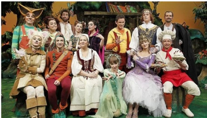
Slika 7: Likovi iz edukativne emisije „ La Melevisione “

Svi navedeni TV kanali, osim kanala Rai2 i Italia1 emitiraju cjelodnevni program namijenjen samo djeci i mladima. Spomenuta dva imaju određeno doba u danu kada prikazuju programe namijenjene djeci. Od svih tipičnih crtanih serija i filmova koji se emitiraju i na većini ostalih svjetskih i hrvatskih kanala, poseban je program „ La Melevisione “. 30 To je edukativna emisija namijenjena djeci predškolske dobi u kojoj se djeci prikazuju bitne ili teške životne situacije na način koji je njima shvatljiv. Primjeri takvih situacija su onečišćenje okoliša, različitosti, razvod braka roditelja djeteta, smrt drage osobe i slično.