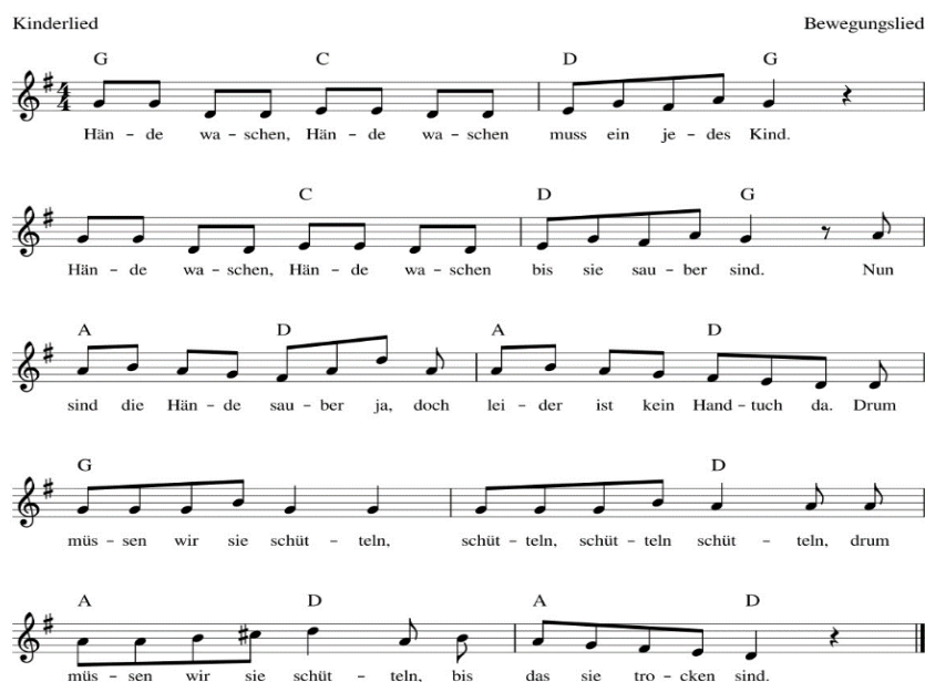
Bild 1. Beispiel: Text und Melodie: S. Sommerland (2011). In Glück K., Sommerland S. & Die Kita-Frösche: Die 30 besten Spiel- und Bewegungslieder.