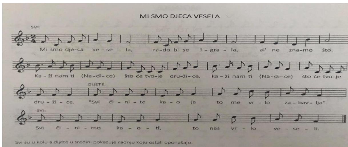
Slika 18. „Mi smo djeca vesela“