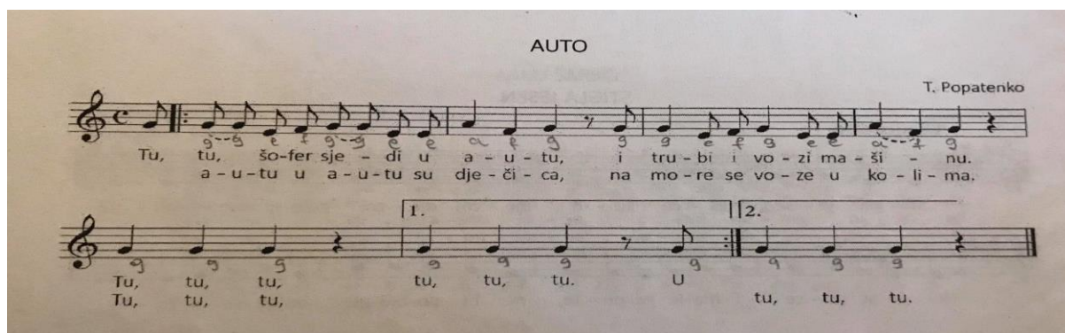
Slika 3. „Auto“

Obrada pjesme uz aplikacije: izradimo tri slike koje prikazuju visibabu, jaglaca i malenu pticu. Nakon otpjevane pjesme i nakon što odgojitelj pokaže kako pomiče aplikacije u metru, djeci podijelimo iste. Svako dijete dobije jednu aplikaciju. U prvoj strofi se koristi aplikacija visibabe, u drugoj aplikacija jaglaca te u trećoj aplikacija ptice. Djeca trebaju pratiti kada je red za koju aplikaciju te ju, na vrijeme, dignuti dovoljno visoko da sva djeca vide. Nakon toga se izmjenjuju tako da svako dijete barem jednom drži aplikaciju. Ostala djeca, koja ne drže aplikacije u rukama s prstićima mogu pratit gibanje aplikacije u metru.