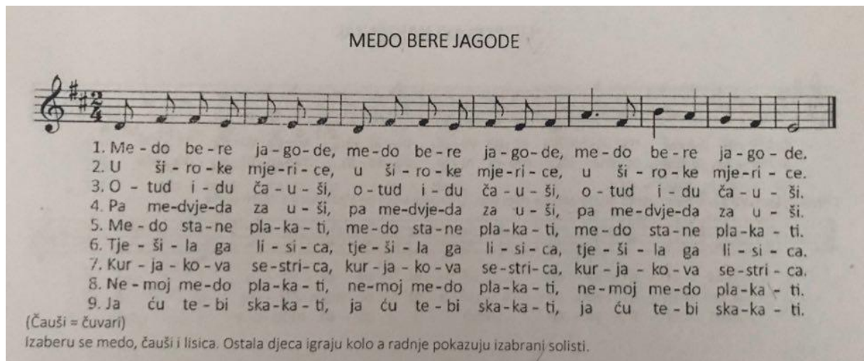
Slika 17. „Medo bere jagode“