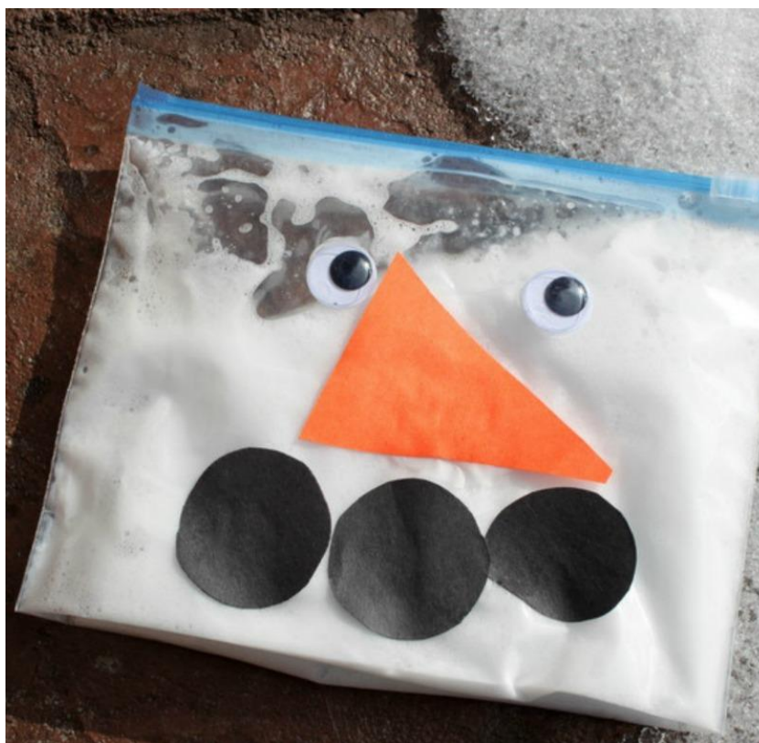
Slika 5. Snjegović u plastičnoj vrećici, Izvor: Ohmy Creative. Preuzeto 10. lipnja 2020. s: https://www.ohmy-creative.com/winter/sudsy-snowman-kids-craft/

Nadalje, zanimljive istraživačke aktivnosti s djecom možemo kreirati od pjene za brijanje s ciljem istraživanja odlike materijala od kojeg je lik (snjegović) napravljen. Za izradu lažnog snijega od materijala potrebne su pjena za brijanje i soda bikarbona. Ovom aktivnošću djeca će putem iskustva dodira moći dočarati sebi kakav je snijeg, kakva mu je tekstura, je li hrapav ili gladak. Moguće je dodati i kockice leda koje će se na sobnoj temperaturi otopiti, čime djeca ponovo stječu iskustvo dodirom o tome je li snijeg hladan ili topao i kako se uspijeva otopiti na određenim temperaturama. Istom ovom aktivnošću možemo izrađivati i samog snjegovića u trodimenzionalnom obliku. Osim u tom obliku, moguće je snjegovića od pjene za brijanje napraviti i u dvodimenzionalnom obliku tako da u plastičnu vrećicu stavimo malo pjene za brijanje i zatvorimo je. Oči, nos i usta djeca mogu izraditi/nacrtati prema vlastitoj želji.