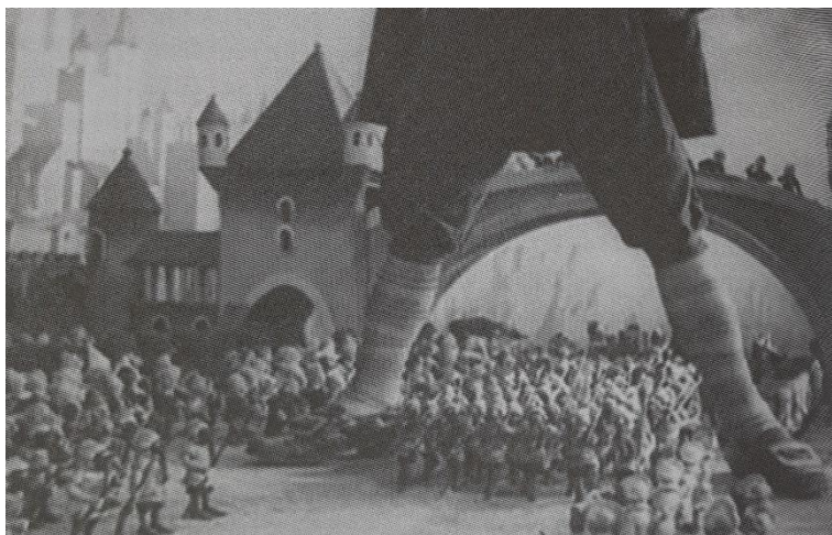
Slika 2. Aleksandar Ptuško, Novi Gulliver

Kvalitetom i kvantitetom u srednjoj se Europi isticala tadašnja Čehoslovačka s majstorima kao što su bili Karel Zemen, Hermina Týrlová, Jiří Trnka, Bretislav Pojar te Jan Švankmajer. Produkcija lutkarskog filma dominantno je vezana uz češki dio države, a prvi slovački lutkarski film Strážarev san Ivana Popoviča nastaje tek 1979. godine. Čehoslovački lutkarski filmovi mogu se podijeliti u tri kategorije: filmovi za djecu koji su rađeni prema uspješnim slikovnicama, nepolitični filmovi za odrasle, edukativni, povijesni ili fantazija te satirični filmovi s elementima nadrealizma. U toj trećoj kategoriji najpoznatiji je film Jiříja Trnke Ruka iz 1965. godine. Nakon velikog uspona animacije lutaka u zemlji, sredinom 1970-ih godina dolazi do stagnacije čehoslovačke animacije. Međutim, u nacionalnom studiju Krátký film Praha uspostavljaju suradnju s umjetničkom akademijom UMPRUM i tada se javljaju mladi autori poput Lubomira Beneša i Pavla Koutskýja. Lubomir Beneš 1976. godine kreira pilot-film Kutaci o dvojici smotanih praktikanata metode „sam svoj majstor“ modeliranih u drvu. Oni su izrasli u jednu od najdugovječnijih serija filmskog lutkarstva u svijetu, poznatiji po naslovu Pat i Mat , odnosno I to je to (A je to) iz 1979. godine (Ajanović, 2019).