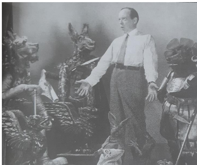
Slika 1. Władysław Starewicz

Njegove lutke mogle su izraziti čitav spektar emocija, a koristio je i krupni plan. Njegova supruga Anna Zimmerman izrađivala je lutke, a poslije su joj i pomagale kćeri Irina i Janina. Kamera u njegovim filmovima aktivna je i pokretna, a iskazao se i u kreiranju masovnih scena, u kojima se istodobno kretalo i do 65 lutaka (Ajanović, 2019).