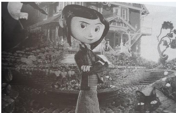
Slika 4. Henry Selick, Karolina i tajna ogledala, Izvor: Ajanović, M. (2019). Filmska lutka: Estetika, žanrovske konvencije i hibridiziranje u modelskoj animaciji. Zagreb: Hrvatski filmski savez, str. 89.