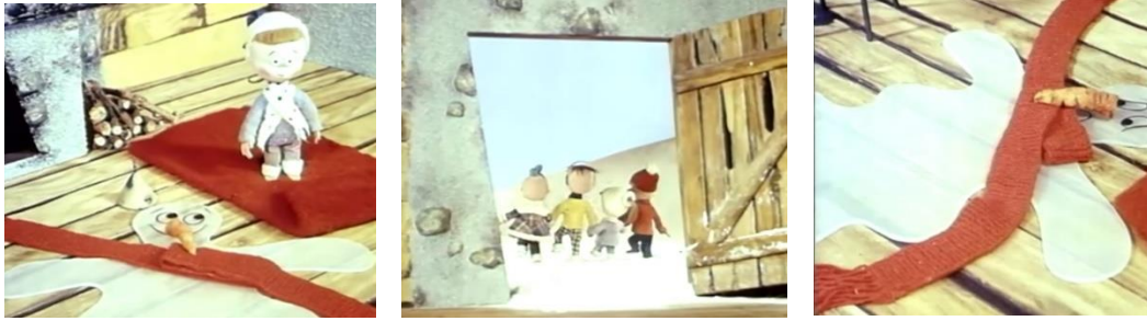
Slika 6. Skup sličica iz lutkarskog filma Srce u snijegu

Razvojne zadaće istaknute za ovu aktivnost u centru za stolno-manipulativne igre jesu: