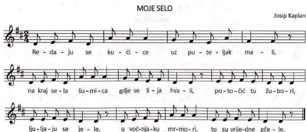
Slika 1: Pjesma "Moje selo" (Kraljić, 2017.)