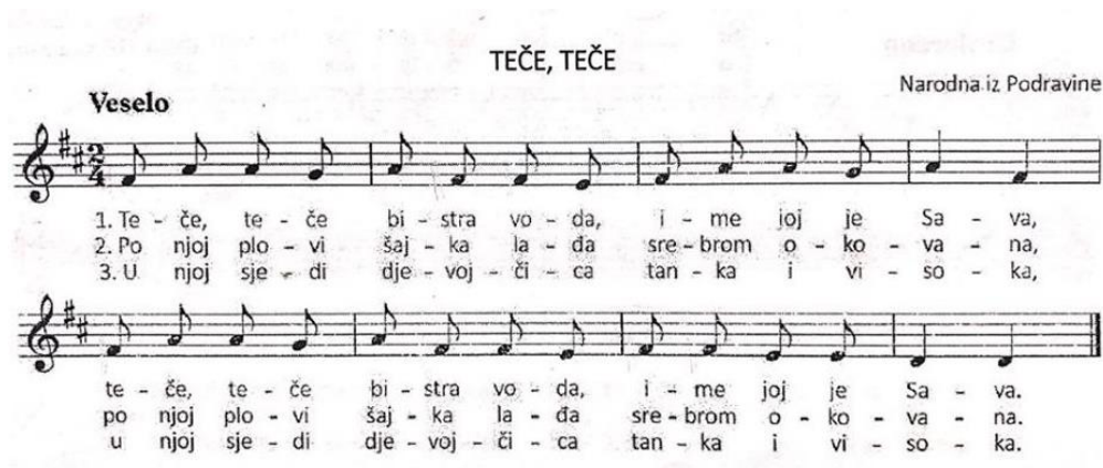
Slika 8: Pjesma "Teče, teče" (Kraljić, 2017.)