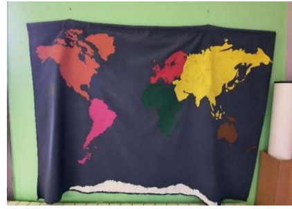
Slika 3. Karta svijeta

U sobi dnevnog boravka na zidu se nalazi naslikana karta svijeta (slika 3) na kojoj su kontinenti označeni istim bojama kao na globusu i puzzli zemljovida (Sjeverna Amerika-narančasta, Južna Amerika-ružičasta, Europa- crvena, Azija- žuta, Australija- smeđa, Afrika-zelena te Antarktika bijele boje). Starija djeca u skupini zapamtila su imena kontinenata uz ponuđeni pribor, a mlađa uz pjesmu „ Kontinenti “.