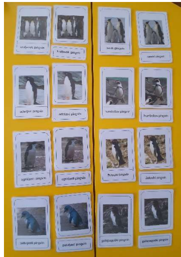
Slika 10. Životinje Antarktike