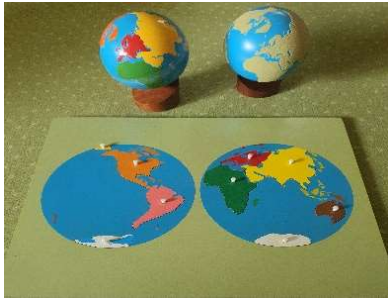
Slika 2. Globusi i puzzle svijeta