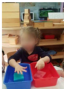
Slika 9. Taktilni osjet