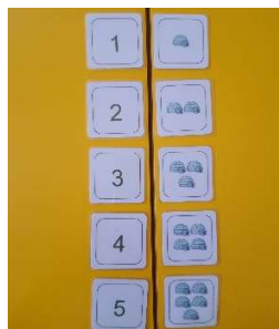
Slika 15. Sličice i brojke

Za djecu starije dobi prekinut je linearan slijed i otežana vježbu, kartice s lijeve strane tbile su pomiješane tako da se brojčane vrijednosti slože nasumce.