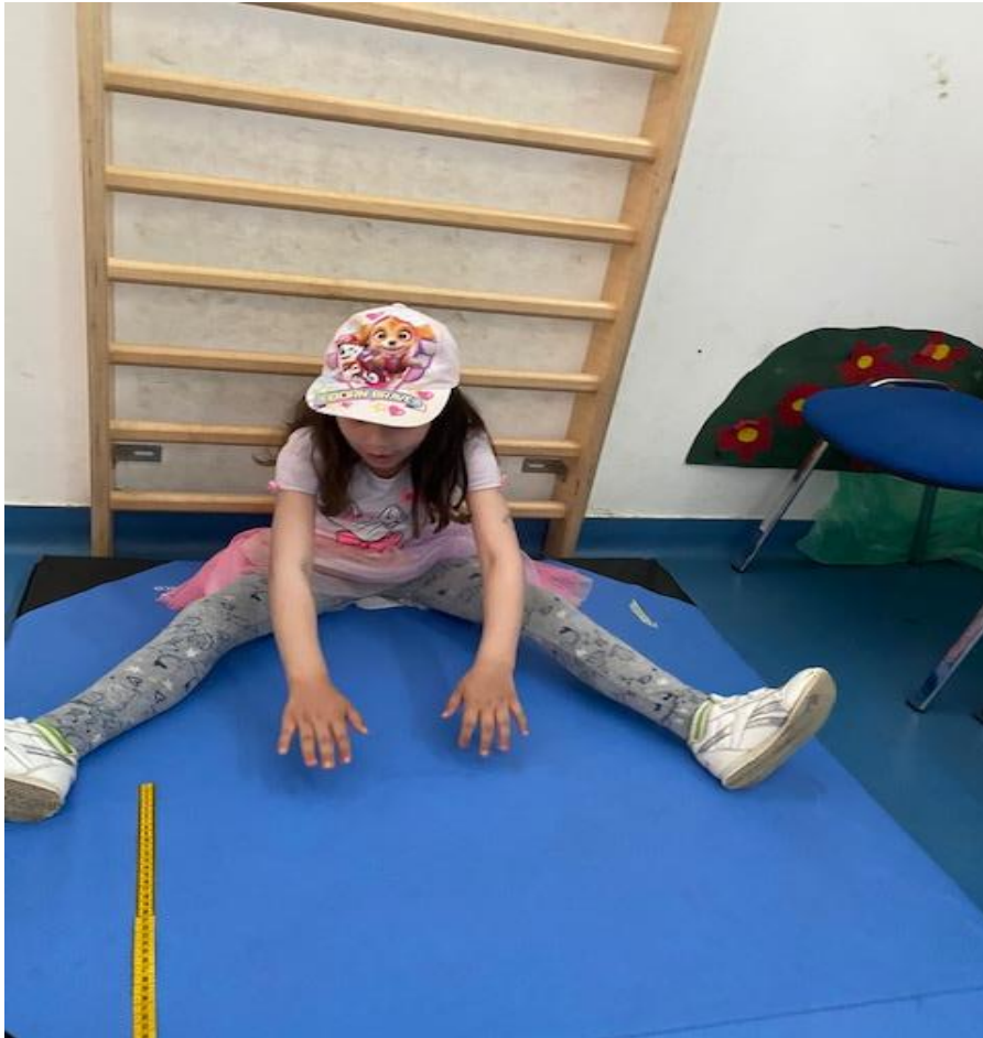
Slika 2 - Pretklon u sijedu