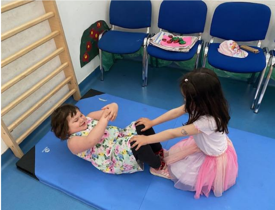
Slika 4. - Trbušnjaci