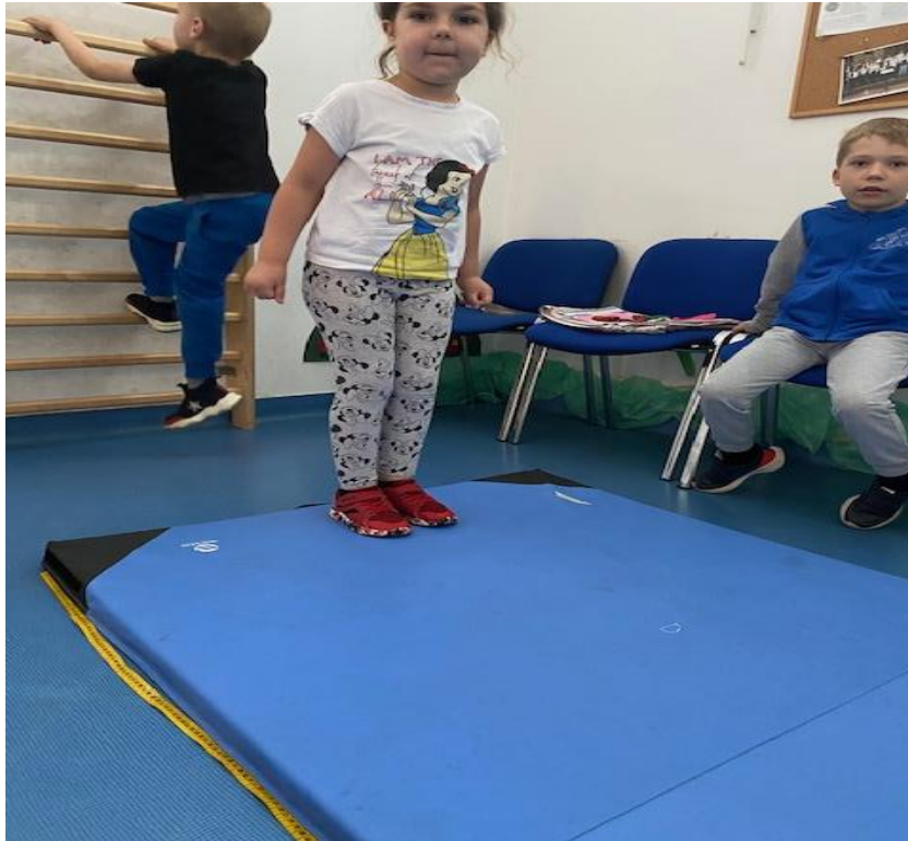
Slika 3 – Skok u dalj