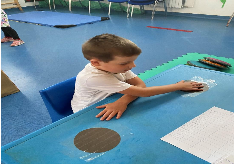
Slika 1 – Tapping rukom 10 sec