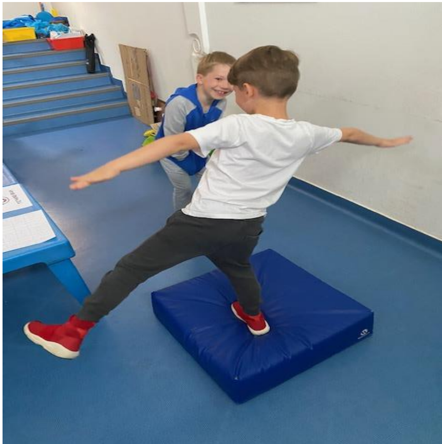
Slika 5. – Stajanje na kocki na jednoj nozi

drugu nogu na podlogu ili kada protekne vrijeme od 30 sekundi. Test se ponavlja 3 puta. Ispitanik stoji pored i mjeri vrijeme u desetinkama te upisuje sva tri rezultata.