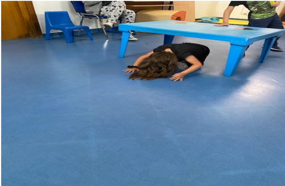
Slika 6. – Poligon natraške

štoperici mjeri vrijeme prolaska poligona. Test se izvodi 3 puta s dovoljnim intervalima za odmor, a rezultat se očitava u desetinkama sekunde.