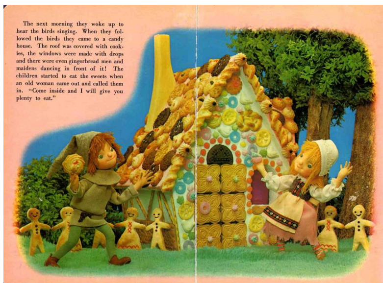
Slika 1: Lutkarska slikovnica