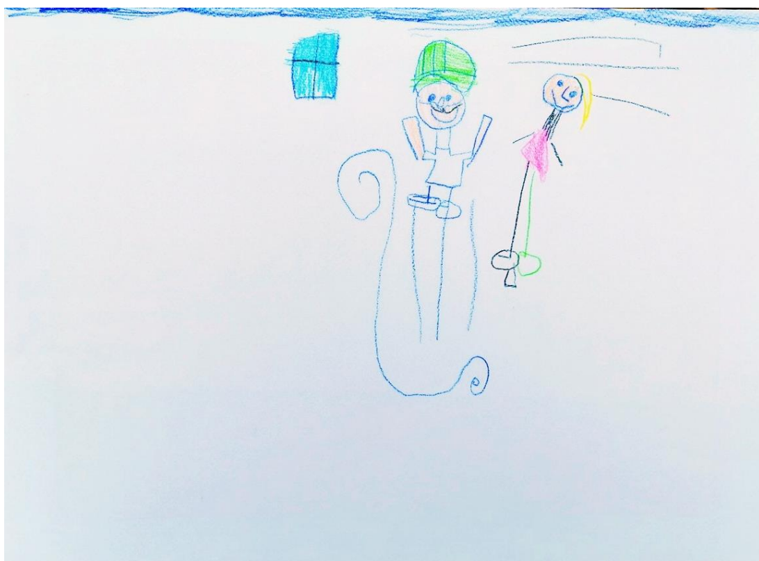
Slika 14. Skok preko klupe (A. J., 6 god.)

prikazan polukružno. Na ovom crtežu dvorac je prikazan s ravnim krovom iz kojeg se uzdižu četiri tornja s kosim crvenim krovovima. Cijela prednja strana dvorca u potpunosti je ispunjena prozorima s rešetkama. Tlo je prikazano zelenim pojasom na dnu papira, dok je nebo prikazano plavim pojasom na vrhu papira. Ovaj prikaz dvorca se razlikuje od dvorca Erdödy u svim dijelovima osim glavnog portala, stoga možemo zaključiti kako je za djevojčicu tema dvorca i grofova Erdödy bila samo poticaj za crtanje dvorca kakvim ga ona zamišlja.