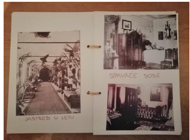
Slika 6. Fotoalbum grofa Stjepana Erdödy

Priča o Jastrebu – ilustrirana priča autorice Daniele Bobinski