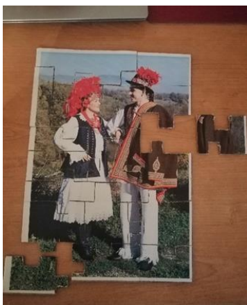
Slika 16. Puzzle