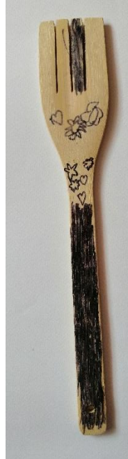
Slika 33. Preslica (E. Ž., 5 god.)

U ovom radu dječaka L. N. može se pronaći sličnosti s radom dječaka M. Š. Dječak na vrhu kuhače crta krug i ispod njega križ. Ta dva simbola okružuju točkice poslagane u jedan niz koje je iscrtao uz rubove kuhače. Rubove također ocrtava jednom obrisnom linijom.