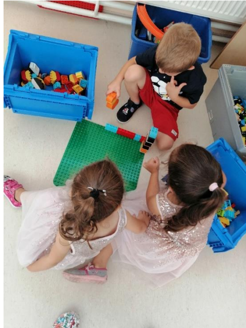
Slika 7. Oblikovanje Lego duplo kockama

Nakon promatranja fotografija djeca su prema izboru mogla graditi dvorac od Lego duplo kocaka ili nacrtati dvorac, ljude kako žive u dvorcu, perivoj ili nešto drugo što im se najviše svidjelo.