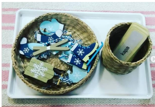
Slika 3 Predmeti i riječi na početku primjene Montessori vježbe (metodičkog postupka)

Na početku odgojitelj provjerava ispravnost, a zatim se „kontrolnim točkama“ provjeravaju pogreške u kojoj predmet i pripadajući pojam na poleđini imaju „kontrolnu točku“ iste boje.