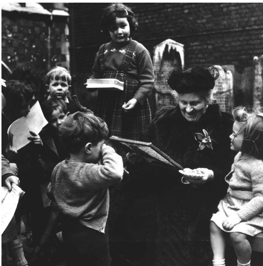
Slika 1 Maria Montessori okružena djecom

U zaključcima se iznose dobrobiti Montessori metode koja podrazumijeva kvalitetno promatranje djece, planiranje, razvijanje i provođenje metodičkih postupaka Montessori pedagogije u suvremenom kontekstu predškolskog odgoja i obrazovanja.