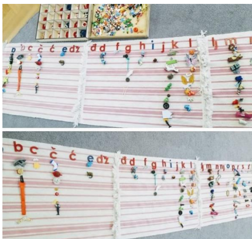
Slika 6 Slovarica s formalnim uspravnim malim slovima hrvatske abecede i sitni predmeti pridruženi prema principu početnog slova. (iz osobnog albuma)

Važno je često mijenjati sadržaj košarice.