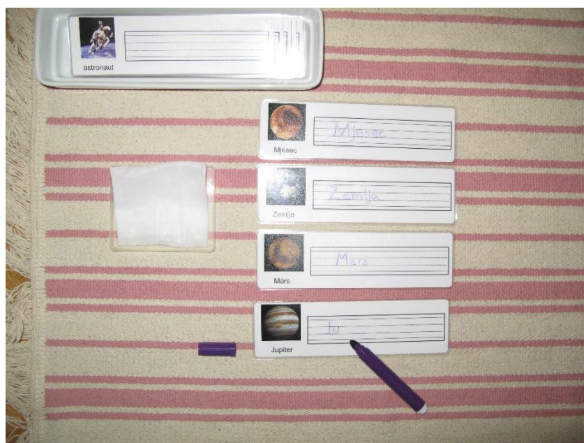
Slika 7 Trake sa sličicama (iz osobnog albuma)

Ova vježba može imati razne inačice kao što su ispisani pojmovi ispod fotografije koje dijete prepisuje pazeći na redosljed slova te glasovnu analizu i sintezu. Djetetu mogu biti ponuđene i kartice koje pored fotografije u crtovlju za pisanje imaju ispisani pojam po kojem dijete piše prateći oblik slova. Tako uvježbava analizu i sintezu te radi predvježbu prethodno opisanim vježbama.