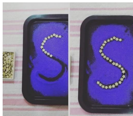
Slika 5 Pisanje formalnog uspravnog pisma u pijesku u boji.