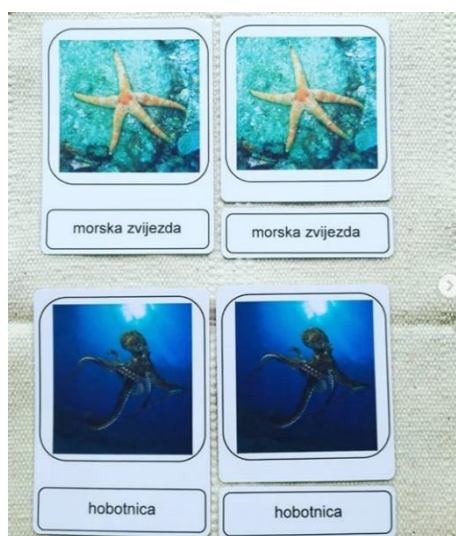
Slika 8 Kartice za imenovanje (nomenklaturne kartice) morskih životinja

Ispravnost svoga rada dijete provjerava okrećući kartice jer na njihovoj poledini nalaze se „kontrolne točke”. Dakle, svaka kartica iz jednog skupa bojom odgovara karticama s fotografijom i pojmu iz drugog skupa.