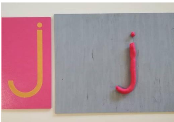
Slika 4 Slovo od brusnog papira i plastelina (minuskula formalnog uspravnog pisma).

Provjera ispravnosti je vizualna i taktilna odnosno prstima se prelazi s hrapave na glatku površinu pločice, ali čini je i odgojitelj.