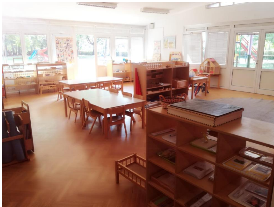
Slika 2 Montessori prostor

Možemo reći kako su Montessori prostor, pribor i odgojitelj neraskidivi dijelovi kvalitetne pripremljene okoline prema Montessori sustavu odgoja i obrazovanja.