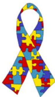
Slika 2. Znak svjesnosti o autizmu

Glavna skupština UN-a odabrala je 2. travnja za obilježavanje dana ove bolesti. Time želi skrenuti pozornost na sve veći problem i raširenost ovog složenog poremećaja. 2013.-te godine se dan obilježio pod geslom: „Autizam treba - sustavno rješenje.“