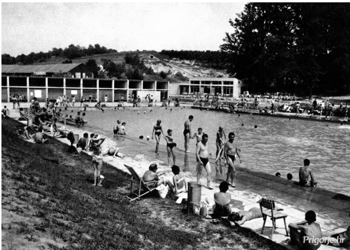
Slika 13. Zelinski bazeni