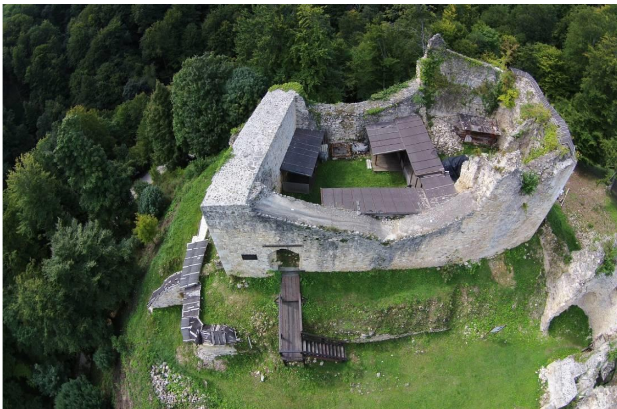
Slika 5. Zelingrad