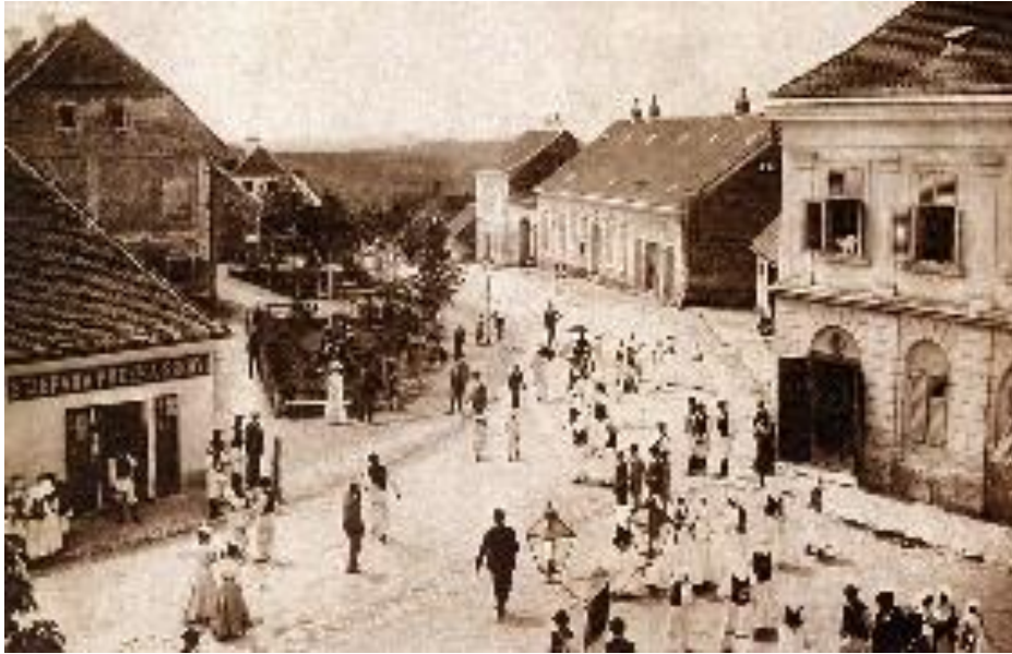
Slika 11. Glavni trg krajem 19. stoljeća i društveni život zelinčana