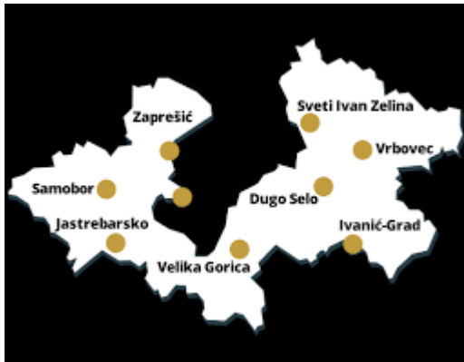
Slika 2. Zagrebačka županija – Sveti Ivan Zelina

www.crorace.com%2Fgradovi-domacini&tbnid=3P9C-oiUqyW8tM&vet=12ahUKEwi4gJP84MPrAhX18OAKHb-NCokQMygwegUIARCGAg..i&docid=R11dqsGF1WkOGM&w=450&h=255&q=Zemljopisni%20polo%C5%BEaj%20sveti%20ivan%20zelina&ved=2ahUKEwi4gJP84MPrAhX18OAKHb-NCokQMygwegUIARCGAg