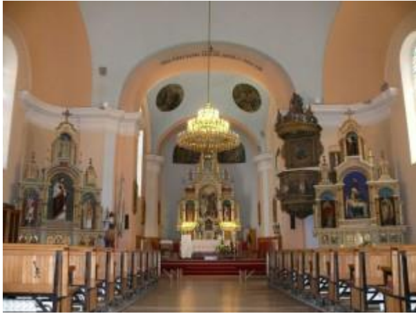
Slika 6. Crkva Svetog Ivana Krstitelja