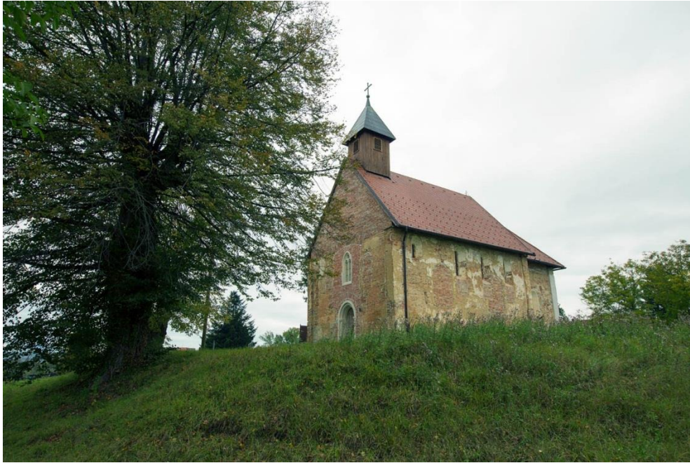
Slika 9. Kapela Svetog Petra i Pavla, Novo Mjesto