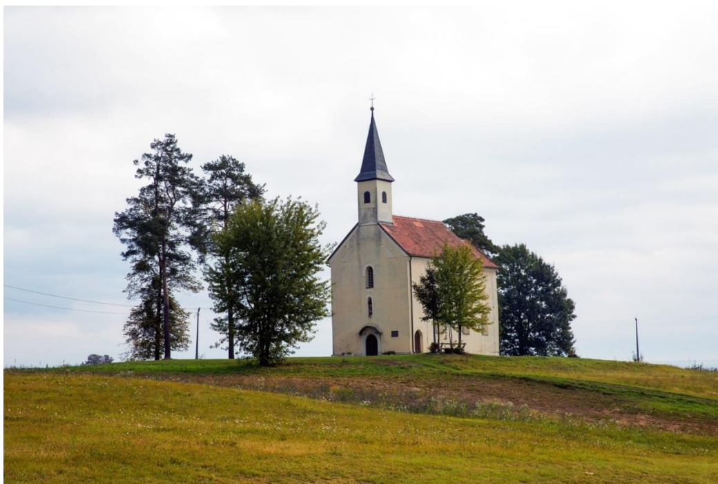
Slika 10. Kapela Sv. Helene