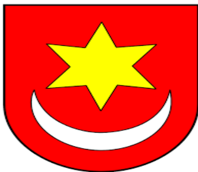
Slika 3. Grb Grada

https://www.google.hr/imgres?imgurl=https%3A%2F%2Fstatic.jutarnji.hr%2Fimages%2Flive-multimedia%2Fbinary%2F2019%2F8%2F23%2F14%2Finfo_card-map.png&imgrefurl=https%3A%2F%2Fwww.jutarnji.hr%2Fincoming%2Fzagrebacka%2F9194510%2F&tbnid=sfOS5E7leuIWEM&vet=12ahUKEwi4gJP84MPrAhX18OAKHb-NCokQMyhDegQIARBN..i&docid=X-hBmxM2IRUtUM&w=543&h=420&q=Zemljopisni%20polo%C5%BEaj%20sveti%20ivan%20zelina&ved=2ahUKEwi4gJP84MPrAhX18OAKHb-NCokQMyhDegQIARBN