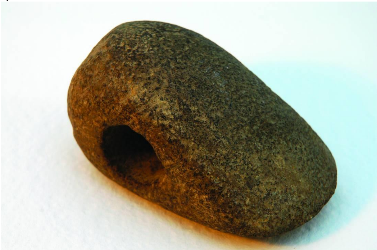
Slika 4. Kamena sjekira

Sveti Ivan Zelina i okolica su nedovoljno sistematski istražene, naročito što se tiče arheologije. Zbog toga se ne može lako odrediti karakter ovoga kraja u pojedinim arheološkim i povijesnim razdobljima. Svoje značenje današnji grad Zelina može zahvaliti cesti koja povezuje krajeve između Save i Drave (Houška, Mačković, 2007). Prastara cesta poznata je iz rimskog vremena prema itinerarima kao linija koja spaja Ptuj i Sisak. Najstariji trag obitavanja ljudi na Zelinskom području su kamene sjekire. Jedna cijela i tri fragmenta kamenih sjekira pripadaju ostavštini Dragutina Ožbolta, velikog entuzijasta u sakupljanju i istraživanju zelinskih povijesnih spomenika (Houška, Mačković, 2007). Spominje se da je sjekire pronašao na području Biškupca, a svoje oduševljenje njima pokazivao stanovnicima Šulinca. Sve sjekire imaju okrugao otvor za nasađivanje drvene drške, a izrađene su od kamena koji je dobro uglačan. Nakon ovih prvih tragova ljudskog boravka u Svetom Ivanu Zelini, na području Donjeg Orešja javlja se i prva naseobina. Arheološka istraživanja na području Donjeg Orešja vršena su 1973. i 1984. godine od strane Arheološkog muzeja u Zagrebu (Houška, Mačković, 2007). Radilo se o području za koje mještani govore da na njemu nailaze na fragmente „starih lonaca“, te se po tome može zaključiti o postojanju naselja. Na području Zelinskog kraja pronađeni su nalazi građevnog materijala, nalazi kućne upotrebe, nalazi oruđa te kosti.