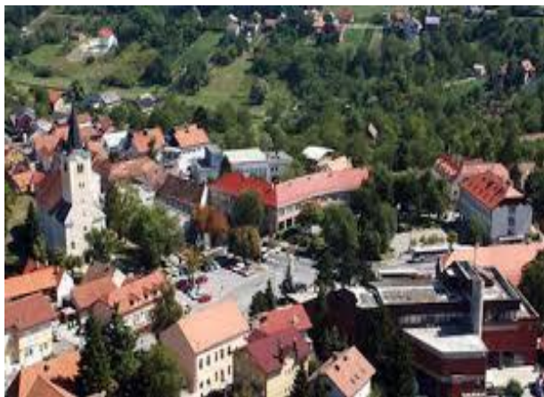
Slika 1. Grad Sveti Ivan Zelina

Dan Grada ili tradicionalni naziv Svetoivanjski dani obilježava se 24.lipnja u čast Sv.Ivana Krstitelja, zaštitnika Grada, čije ime i nosi te i sama župa je posvećena Sv. Ivanu Krstitelju. U to vrijeme koje se obilježava nekoliko dana, održava se niz manifestacija koje se sastoje od niza kulturnih, gospodarskih, sakralnih, sportskih i drugih sadržaja namijenjena djeci.