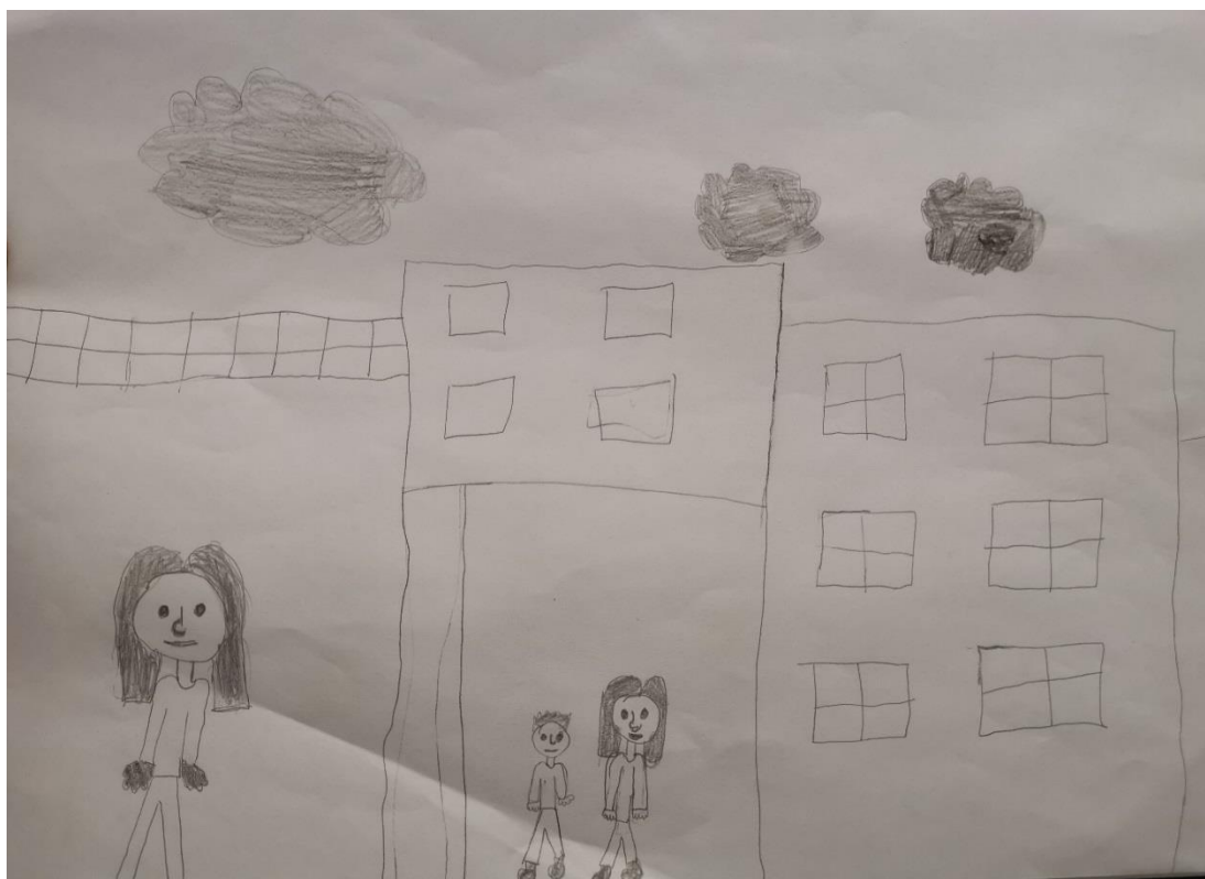
(Crtež K.L. – 7 godina)

Temu vlastite obitelji i doma djetete K.L. prikazuje naglašavanjem jedne figure koja je veća od ostalih te odvajanjem te figure od drugih dviju. Iz razgovora saznajemo da se radi o figuri oca. Sjenčanje njegovih ruku najčešće je znak fizičkog zlostavljanja, a popravljane crteže, koje je u ovom slučaju moguće uočiti na mnogim mjestima, ukazuje na samokritičnost i preveliku discipliniranost. Ravna usta na svim figurama mogu se protumačiti kao čuvanje određene tajne. Također, djetete je nesigurno izjavilo da su oblaci prikazani na crtežu jer je prethodnoga dana bilo nevrijeme, što nije točna činjenica. Crni i tamni oblaci sugeriraju zlostavljanje djeteta, osobito ako se takva tema ponavlja. Zlostavljana djeca često se koriste lažima kao sredstvom obrane i to zbog straha od kazne. Ponekad je njihova šutnja uvjetovana očekivanjem zlostavljača ili pak strahom od mogućeg razočaranja roditelja. Djetete pritom teži udovoljavanju njihovim zahtjevima. Zadatak je bio nacrtati obitelj i vlastiti dom, onako kako oni žele i tehnikom koju su sami mogli izabrati. Na ovom je crtežu moguće primijetiti izostanak boja i korištenje isključivo olovke, što ukazuje na djetetovu nesigurnost. Razgovor s djetetom ne odaje direktno fizičko zlostavljanje, ali se može primijetiti strah od očeve figure.