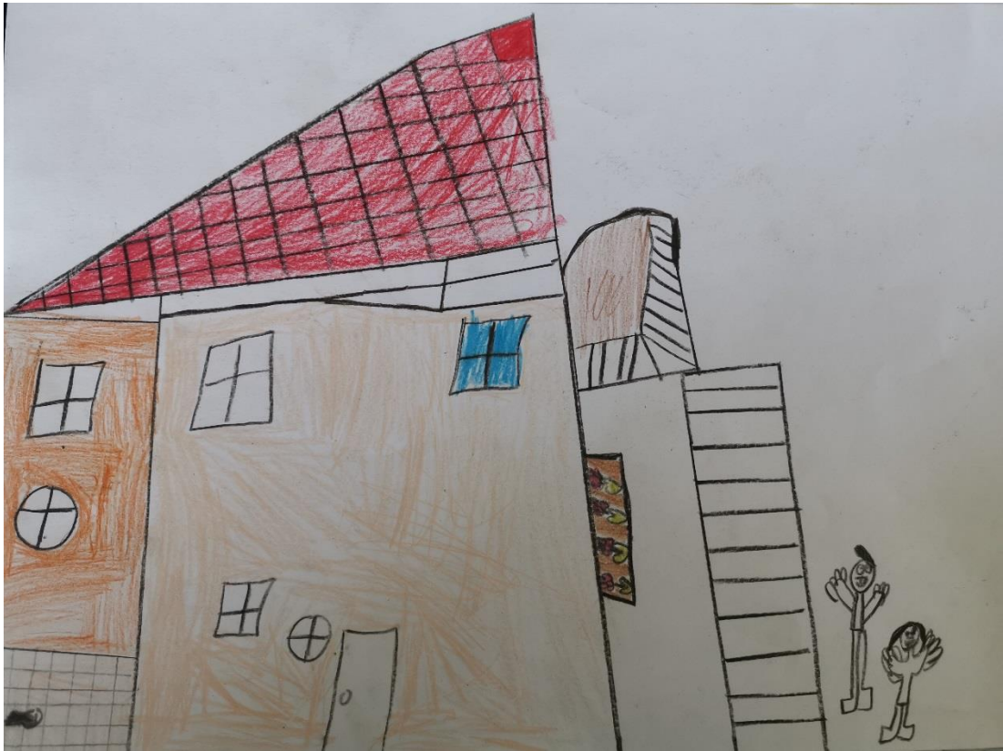
( Crtež M.K. – 8 godina)

Na crtežu djeteta M.K., na temu vlastite obitelji i doma, uočljiv je izostanak jednog ili više članova obitelji. Takvo što može ukazivati na odnos djeteta s tim članom te njegovu važnost u djetetovom životu. Izostavljanje člana obitelji također može biti upozorenje na to da je upravo taj član zlostavljač. Dijete je nacrtalo dva lika, koji predstavljaju njega i oca, budući da otac radi od kuće te s djetetom provodi većinu vremena.