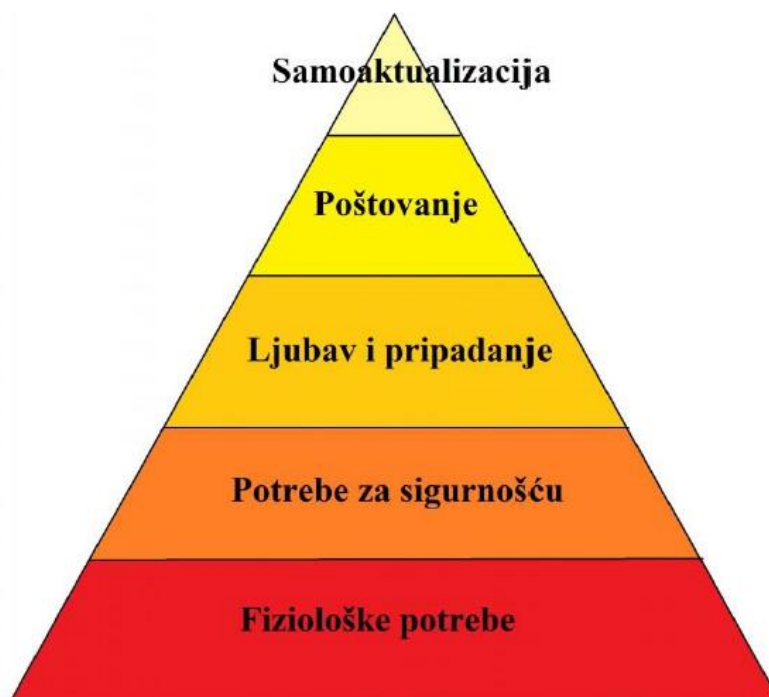
Slika 3. Maslowljeva hijerarhija motiva (Bosnar, Balent,2009; prema Busija, 2019: 17).

Naime taj proces uvelike omogućava pojedincu mogućnost velikog uspjeha u sportu. Primjerice čest slučaj je da djeca posjeduju potrebna znanja, vještine i sposobnosti, no iz nekog razloga nisu dovoljno motivirana te ne uspijevaju dostići određeni mogući uspjeh (Busija, 2019). Dakle, važan zaključak jest da bez motivacije vrlo često nema ni daljnjeg bavljenja sportom ili nema nikakvih sportskih uspjeha iako su ona moguća. Naime motivacija je vrlo složen proces te postoji mnogo teorija o njoj. Busija (2019) navodi Maslowljevu hijerarhijsku teoriju motivacije. Prema toj teoriji svaki pojedinac ima određene ciljeve koje želi postići, a ostvarenje tih ciljeva pojedinac doživljava kao nagradu, dok nemogućnost ostvarenja kao frustraciju i kaznu. Naime motivi su hijerarhijski organizirani, od nižih (primarnih, bioloških) ka višima (psihološkim i socijalnim) (Bosnar, Balent, 2009; prema Busija, 2019). Prema istim autorima postoji 5 motiva pojedinac treba redom zadovoljavati kako bi uspio ostvariti motiv iznad.