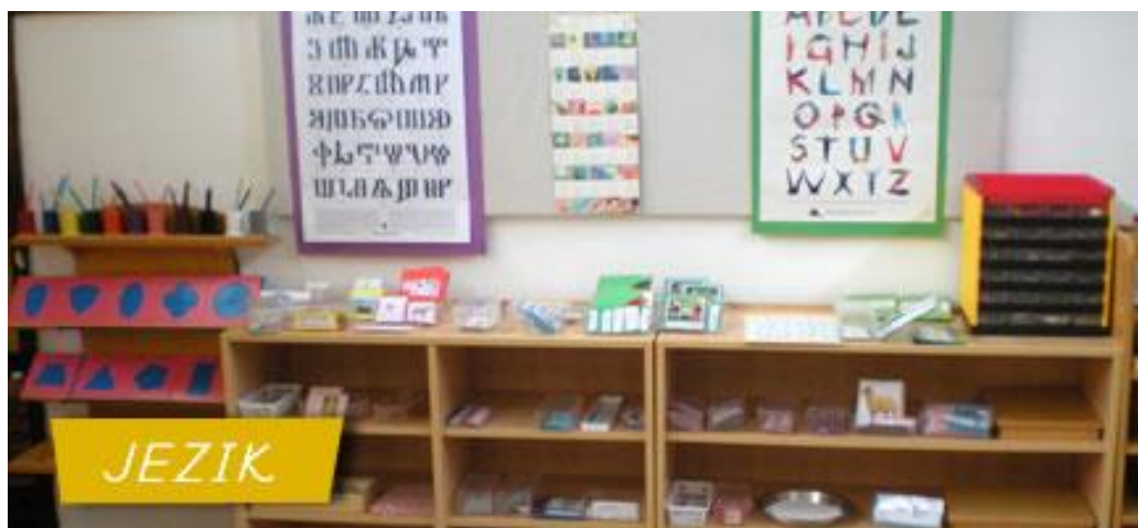
Slika 7 Pribor za jezik