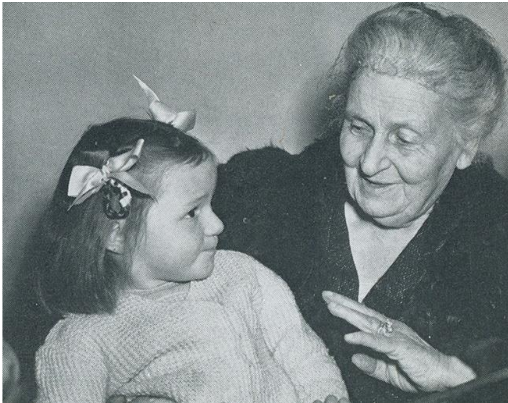
Slika 1 Maria Montessori

Montessori pokret nastavio je rasti i nakon njezine smrti. Početkom šezdesetih godina dvadesetog stoljeća rast se ubrzao i u cijelom je svijetu oživljeno zanimanje za njezine ideje. U Sjedinjenim Američkim Državama početkom devedesetih godina bilo je više od 4000 Montessori škola i vrtića. Montessori pokret širio se velikom brzinom jer su programi za poduku Montessori metode pokrenuti svuda po svijetu. U listopadu 1991. godine sva su se glavna Montessori udruženja sastala u New Orleansu i stvorila krovnu organizaciju pod nazivom „Montessori Accreditation Council for Teacher Education – Savjet za odobravanje programa obrazovanja za Montessori odgojitelje i učitelje“ (MACTE), što je bio veliki napredak u suradnji za međunarodnu promociju Montessori pedagogije (Britton, 2000).