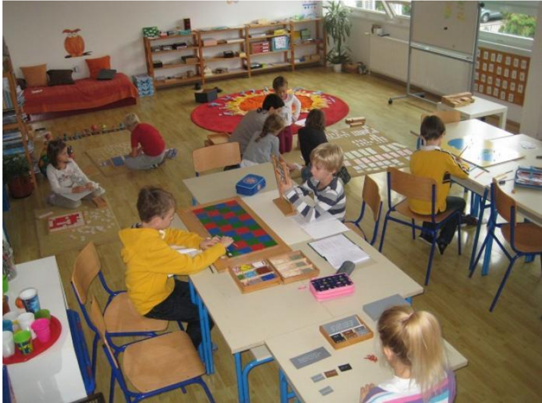
Slika 11 Razred u osnovnoj školi barunice Dédée Vranyczany