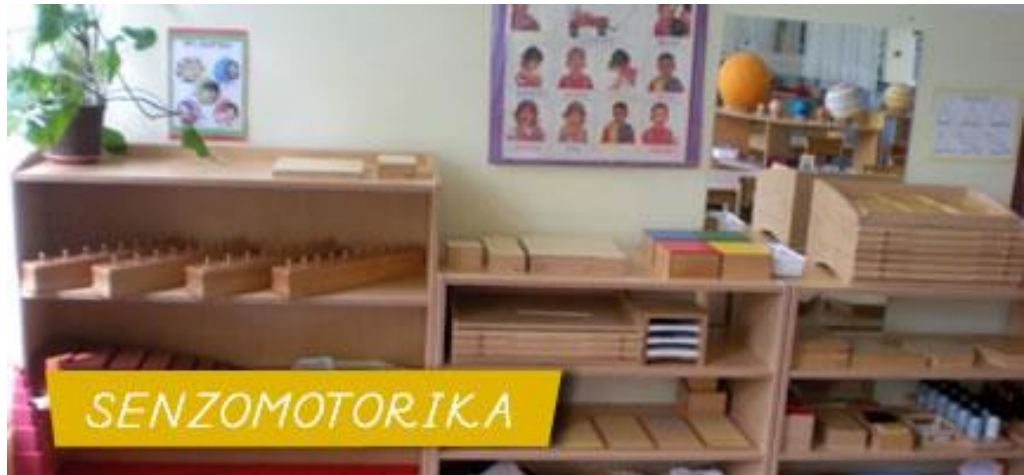
Slika 6 Pribor za osjetilne sposobnosti