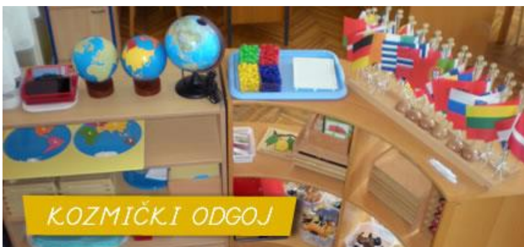
Slika 9 Pribor za kozmički odgoj