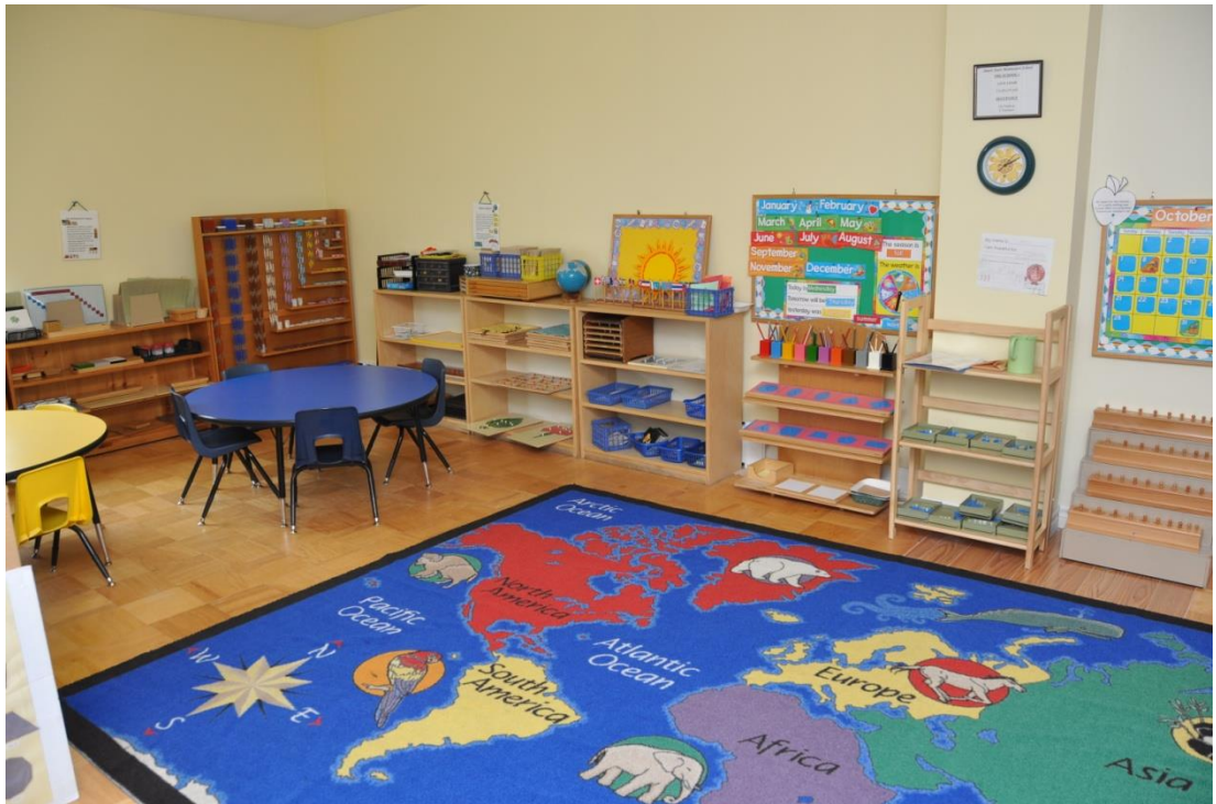
Slika 4 Montessori prostor