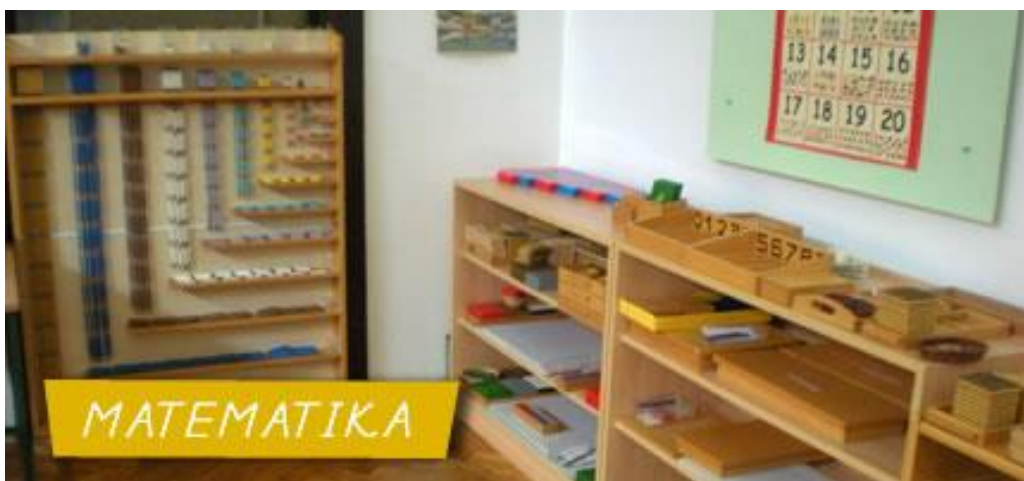
Slika 8 Pribor za matematiku