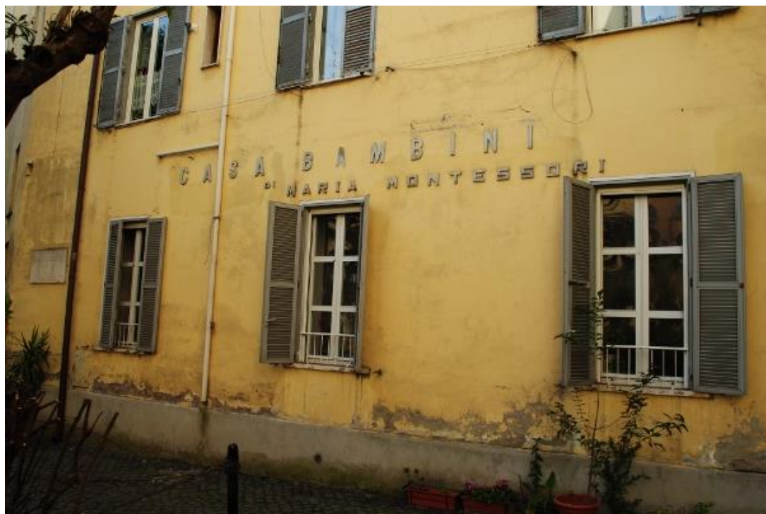
Slika 2 Dječja kuća (Casa dei Bambini)

nesputanosti i otvorenosti, djeca su ubrzo počela ostavljati dojam izvanredne discipline. Mirno su radila i svatko je bio zaokupljen svojim poslom. Nakon nekog vremena polako bi ustajali sa svog mjesta i zamjenjivali pribor. Iznenadjuće brzo su počela slušati naredbe učiteljice. Usprkos toj poslušnosti, djeca su djelovala po svojoj inicijativi, raspolažući svojim vremenom. Sama su uzimala predmete, uređivala školu. Ubrzo se primijetila veliku povezanost reda i discipline sa spontanošću. Disciplina mora proizaći iz slobode, što je teško shvatiti sljedbenicima metoda tradicionalne nastave. Ako se disciplina temelji na slobodi, ona svakako mora biti aktivna. Učiteljica je također je samoinicijativno naučila djecu vojni pozdrav, iako najstariji učenici nisu imali više od pet godina. Djeci se to jako sviđjelo i bili su izrazito zadovoljni. Tako je započet rad koji u početku nije davao nikakve nade za uspjeh (Montessori, 2003).