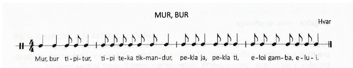
Slika 1: Brojalica Mur, Bur (Kraljić, 2016, str. 49)