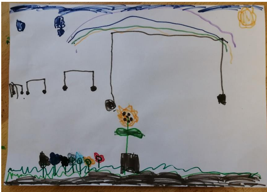
Slika br.4: B.R.

Analiza: priloženi rad naslikao je dječak B.R. Na pitanje što si naslikao odgovorio je: „naslikao sam raznu vrsta cvijeća koja je pod dugom“. Pri slikanju koristio je 3 hladne boje, crnu boju i 2 tople boje stoga hipoteza H-1 nije potvrđena. Dječak je prepoznao glavni motiv skladbe stoga hipoteza H-2 nije potvrđena.