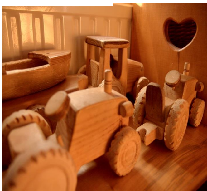
Slika 9. Drvena prijevozna sredstva