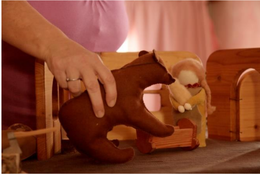
Slika 7. Ručno izrađene igračke bez izraženih detalja na licu

Također, bitno je u vrtiću ne gomilati nepotrebne i monofunkcionalne igračke. Razvoj mašte potiče se i ponudom manjeg broja jednostavnijih igračaka. Primjerice drvena kocka, koja bi u dječjoj mašti mogla postati i telefon, vlak, mobitel i slično. Komad drveta, prirodan je materijal koji djeci daje slobodan prostor da ga vlastitim rukama i maštom oblikuje po svojim željama. Igračke s već određenom funkcijom sprječavaju dječji razvoj jer ne potiču dijete na istraživanje i konstruiranje vlastitih znanja vlastitim rukama i intervencijama. Kada dijete prohoda, životinje postaju glavne igračke koje djeca prihvaćaju kao svoje ljubimce. Već nakon treće godine života u djetetovom okruženju nalaze se pravi alati , poput čekića ili noža, bez opasnosti da će se dijete ozlijediti. Gradnja kuće u toj dobi simbolizira vlastiti dom za tijelo i obitavanje; grade ju pomoću stolova, stolaca, marama i stalaka za igračke (Seitz, Hallwachs, 1996).