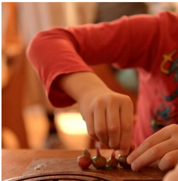
Slika 3. Oblikovanje figurica od voska

Slobodna igra uključuje aktivnosti u centrima, pa tako primjerice neka djeca, po vlastitom izboru, izrađuju figurice od voska (Slika 3) ili crtaju kredom. Djeca koriste isključivo prirodni materijal i igračke u skupini.