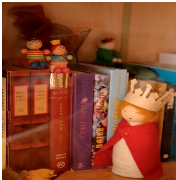
Slika 2. Bajke braće Grimm u kutku za čitanje dječjeg vrtića Neven

Nakon aktivnosti pričanja bajki djeca odlaze na igru, a kada im vrijeme pogoduje izlaze vani, na zrak. U popodnevnom krugu uključene su aktivnosti poput crtanja ili se održava euritmija (Seitz i Hallwachs, 1996).