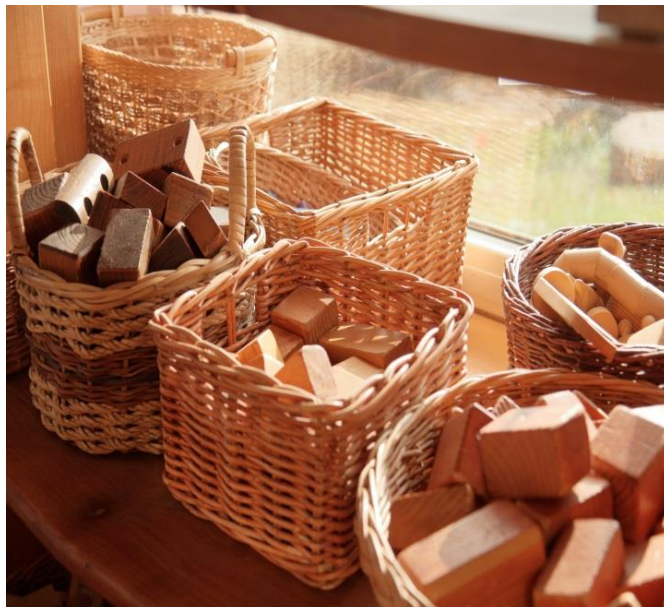
Slika 8. Jednostavni drveni predmeti

8 i 9). Time se u najranijoj dobi kod djeteta njeguje razumijevanje za ekološko (Seitz i Hallwachs, 1996).