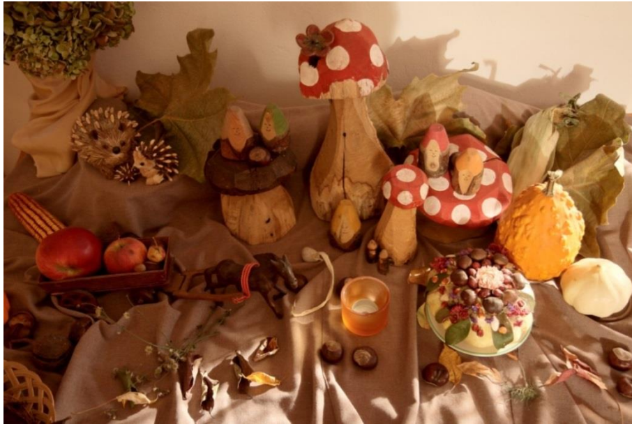
Slika 1. Stol godišnjih doba u jesen

Ujedno, naglasak se stavlja na obilježavanje različitih svetkovina koje su povezane s određenim razdobljem u godini. Na svetkovinu svetog Mihovila, 29. rujna, sve je u duhu teme borbe zmajeva i nadvladavanja mračnih sila svjetlosnim mačem duha. Naime, Sveti Mihovil je svojim zlatnim mačem kojeg su iskovale zvjezdice pobijedio zlog zmaja. Taj čin simbolizira hrabrost i pobjedu nad zlom. Ovakvi sadržaji i aktivnosti su i prilika za razvoj percepcije i učenja kod djece. Kroz aktivnost kovanja željeza u kolu te jahanja na vatrenim konjima djeci se približava sam pojam hrabrosti i njegovo značenje. Sama svetkovina sv. Mihovila obilježava i početak jeseni, odnosno jesenskog ciklusa.