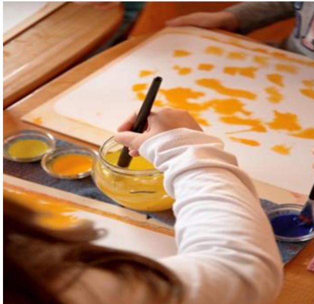
Slika 4. Miješanje plave i žute boje

Zelena boja koja nastaje sada je nešto više od samog miješanja boja. Na slici 4. vidimo kako je sve pripremljeno za tu čaroliju miješanja plave i žute boje.