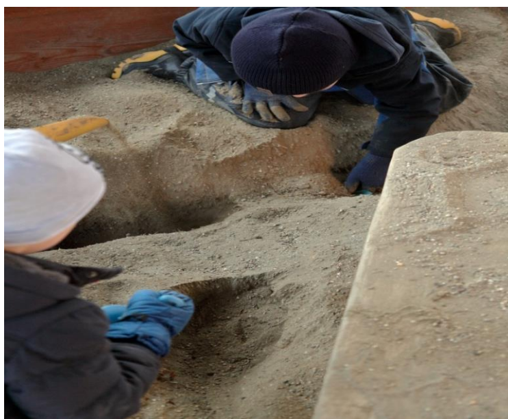
Slika 6. Igra na otvorenom u pješčaniku dječjeg vrtića Neven

Odgojitelji jednaku pažnju posvećuju i oblikovanju vanjskog prostora, smatrajući ga nadogradnjom unutarnjeg prostora odnosno drugačijom sobom dnevnog boravka i nastoje omogućiti djetetu adekvatnu mogućnost napretka na svim razvojnim područjima. Za razvoj motoričkih vještina, prema Steineru, važan je eksterijer u koji se postavljaju sprave za penjanje i pješčanici čijim se korištenjem potiče razvoj motoričkih vještina, ali i razvoj mašte kod djece (Thomson, 2002). Jedna od takvih aktivnosti svakako je igra u pješčaniku (Slika 6).