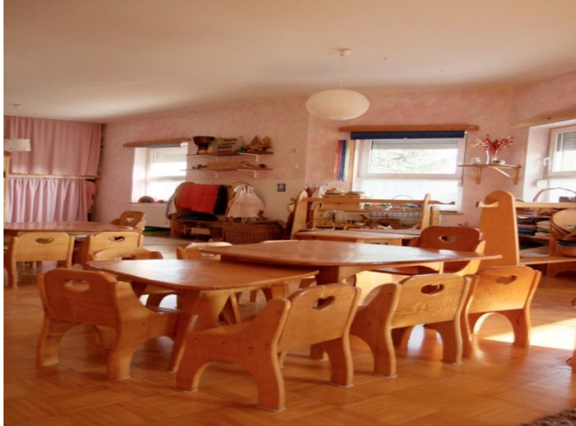
Slika 5. Soba dnevnog boravka waldorfskog vrtića Neven

nanesene na zid kako bi on mogao živjeti (Seitz i Hallwachs, 1996). Prostor waldorfskog vrtića Neven zorno je prikazan na slici 5.