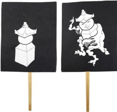
Slika 2. Tachie