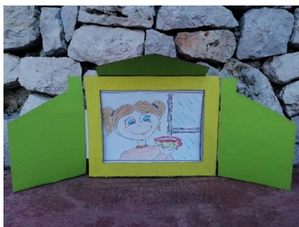
Slika 13. Ilustracija 8. Izvor: Autorica rada, 27.8.2021.