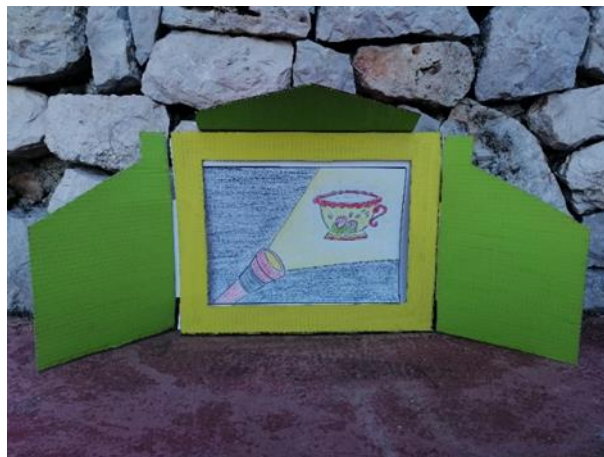
Slika 9. Ilustracija 4.