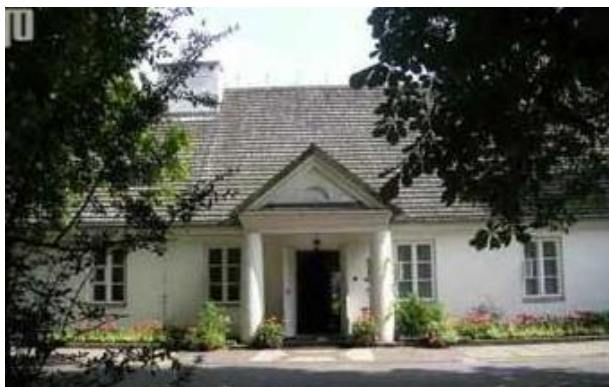
Slika 1. Rodna kuća Fryderyka Chopina, Żelazowa Wola 8