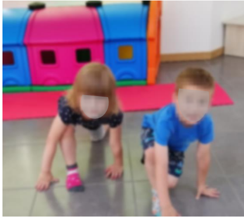
Slika 22. Iskorak