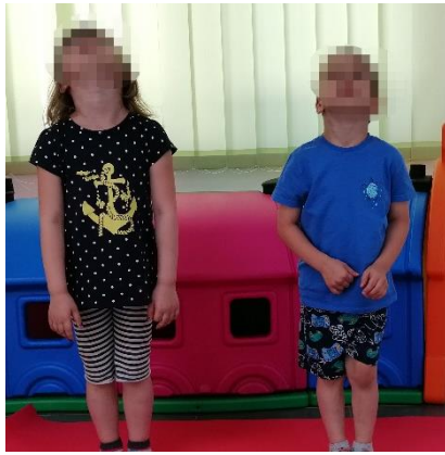
Slika 5. Pomicanje glave prema natrag