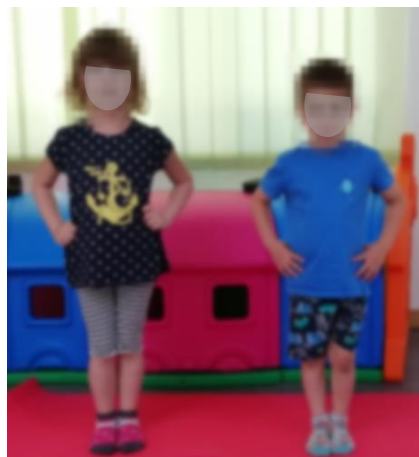
Slika 3. Početni položaj

Početni položaj je stojeći, noge su spojene, a laktovi savinuti tako da su ruke na bokovima (ruke mogu biti i ispružene uz tijelo). Izvode se pokreti glave naprijed-nazad, lijevo desno.