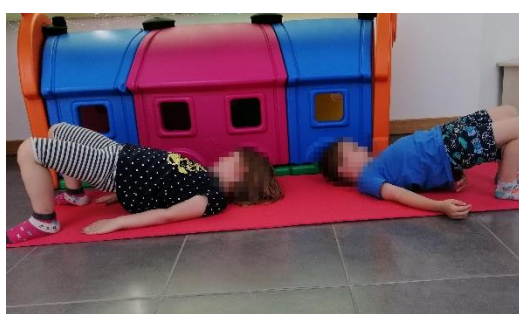
Slika 18. Most, izvor: vlastiti