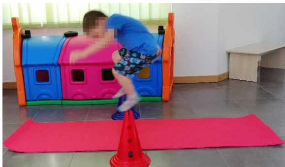
Slika 23. Preskakanje prepreke

Potrebno je postaviti prepreku koja odgovara fizičkom razvoju djeteta. Dijete zatim upućujemo kako da preskoči prepreku.