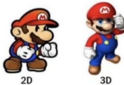
Slika 1. Razlika između prikaza 2D i 3D animacije

između 2D i 3D animacije jest što 3D animacija omogućuje prikaz realističnije slike, prikaz sitnih detalja, raznih svjetlosnih efekata te samu teksturu. ( www.3d-ace.com )