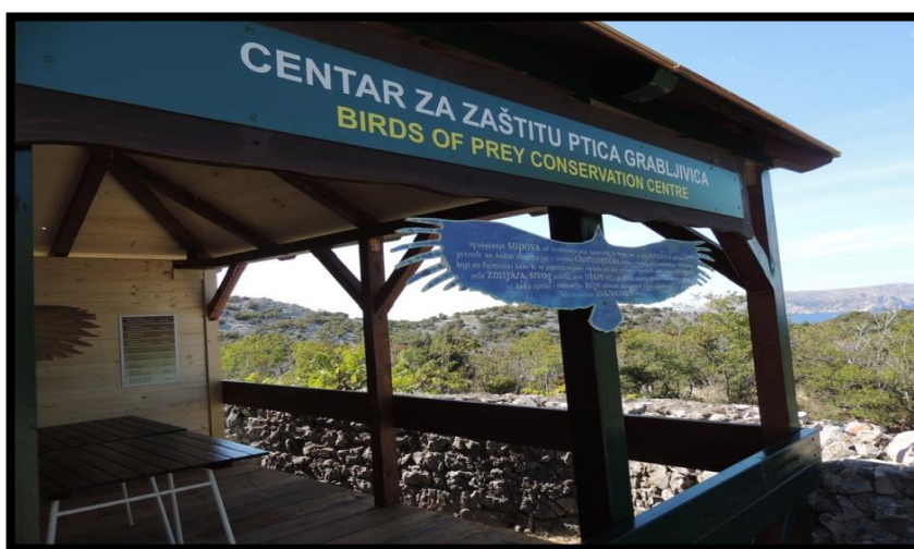
Slika 21. Centar za zaštitu ptica grabljivica

Ptice su danas jedna od najugroženijih skupina životinja. Zbog svoje izuzetne osjetljivosti na promjene okolišnih uvjeta, vrlo su dobar indikator 3 promjena koje se događaju u njihovim staništima. U Hrvatskoj je do danas zabilježeno 375 vrsta ptica, od toga 231 vrsta gnjezdarica, što je za europski prosjek veliki broj. Na području Lonjskog polja obitava 236 vrsta ptica, od čega su 134 vrste ptice gnjezdarice. Za europske i svjetske razmjere ovako velika zastupljenost ptica na relativno malom prostoru od 506 km 2 daje sliku vrlo bogate ornitofaune. Lonjsko polje je važno gnjezdilište (za neke vrste u Europi i posljednje), prezimljavalište i obitavalište brojnih ptičjih vrsta. Od vrsta koje obitavaju na području Parka, 113 vrsta ptica su ugrožene na nacionalnom nivou, 79 vrsta je ugroženo na Europskom nivou, 227 vrsta je zaštićeno Zakonom o zaštiti prirode Republike Hrvatske, dok su 133 vrste zaštićene međunarodnim konvencijama (Bernska, Bonska, Wild Birds Directive) (Radović i sur. 2003.).