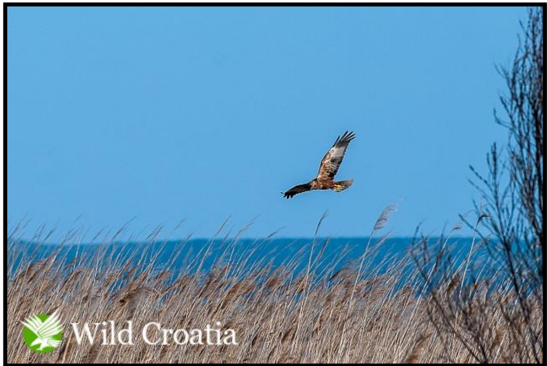
Slika 16. Eja močvarica u potrazi za hranom

Gnijezdi se u močvarama i šašu, na mjestima gdje ima hrane u blizini.