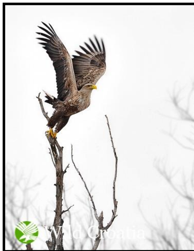
Slika 9. Orao štekavac