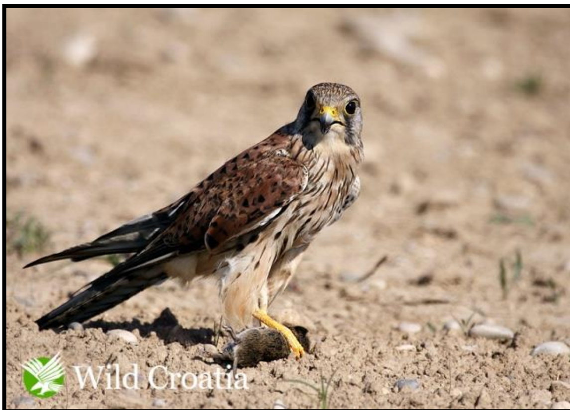
Slika 18. Vjetruša

Vjetruša ( Falco tinnunculus Linnaeus 1758) grabljivica crvenosmeđe boje s crnim pjegama pripada porodici sokolova. Mužjak je sive glave i crvenosmeđih leđa s nešto tamnih mrlja na truhu, dok ženka ima tamnija leđa. Jedna je od najrasprostranjenih vrsta ptica u Hrvatskoj. (Park prirode Lonjsko polje http://www.pp-lonjsko-polje.hr/ )