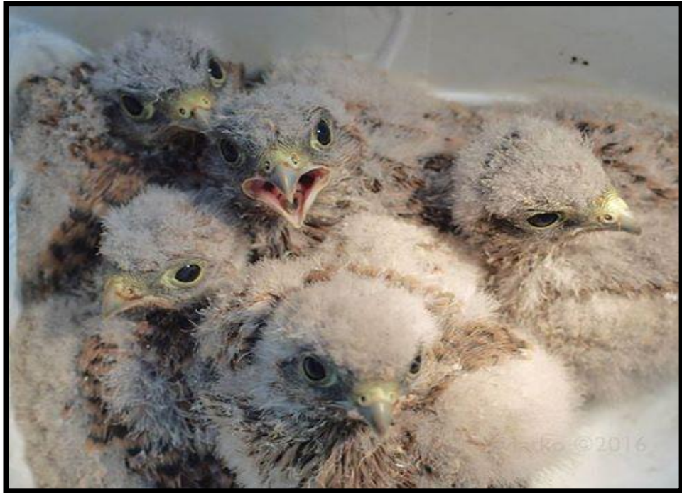
Slika 19. Ptići vjetruše