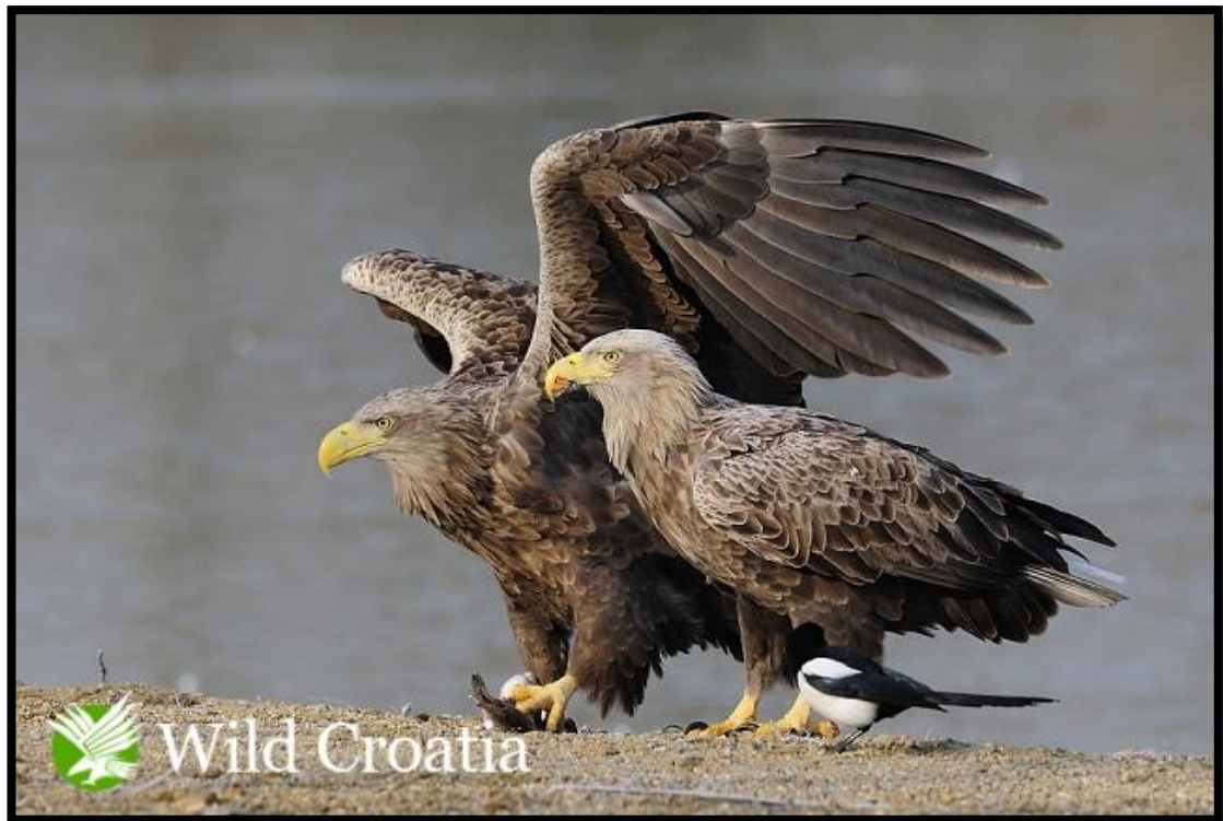
Slika 8. Skupljanje hrane za ptiće