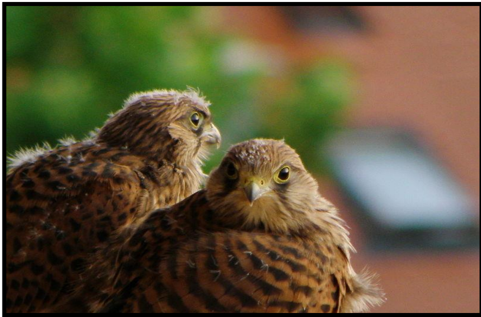
Slika 20. Mlade vjetruše