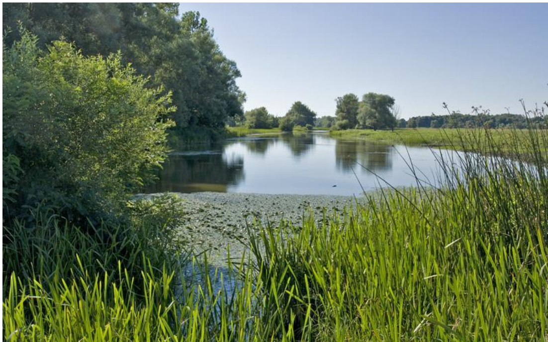
Slika 5. Močvarno područje ornitološkog rezervata Rakita

Prije velike zimske seobe ptica, na području rezervata okuplja se veliki broj divljih pataka. (Park prirode Lonjsko polje http://www.pp-lonjsko-polje.hr/ ).