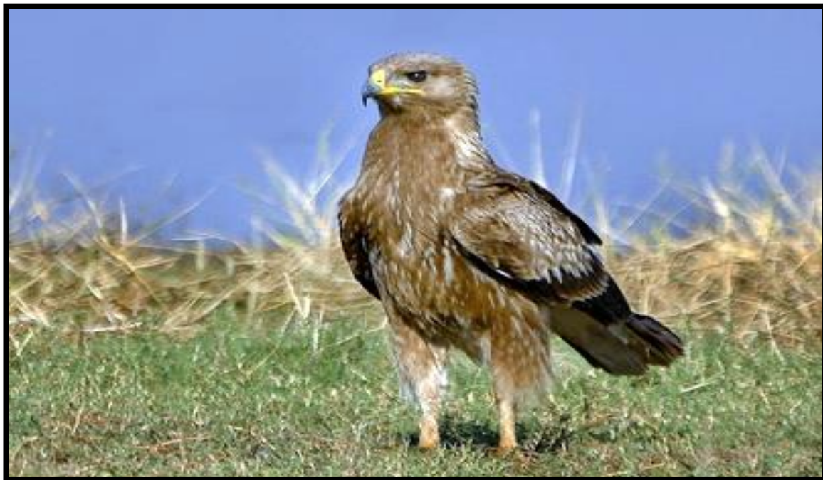
Slika 10. Orao kliktaš

Orao kliktaš ( Aquila pomarina Sibley and Monroe 1990), grabljivica je dužine od 55 do 66 cm, raspona krila od 135 do 155 cm, a tjelesne mase oko 1,5 kilogram. Ženke su uvijek nešto krupnije od mužjaka.