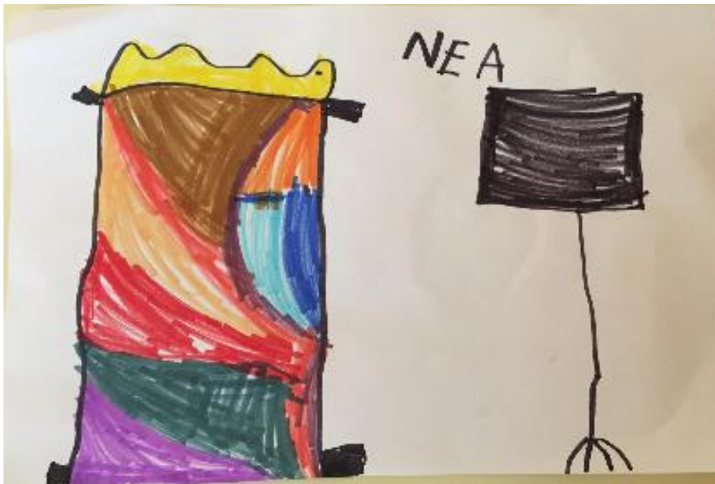
Slika 11. Prikaz vlastite sobe („Spavaća soba u Arlesu“) (Nea, 6.god, 2021.)

Sljedeća tri crteža su nastala nakon aktivnosti prikaza vlastite sobe (izrada tlocrta sobe u vrtiću, upoznavanje sa smjerom i postavljanje predmeta u prostor, prisjećanje vlastite sobe), potaknuti djelom Vinceta van Gogha „Spavaća soba u Arlesu“.