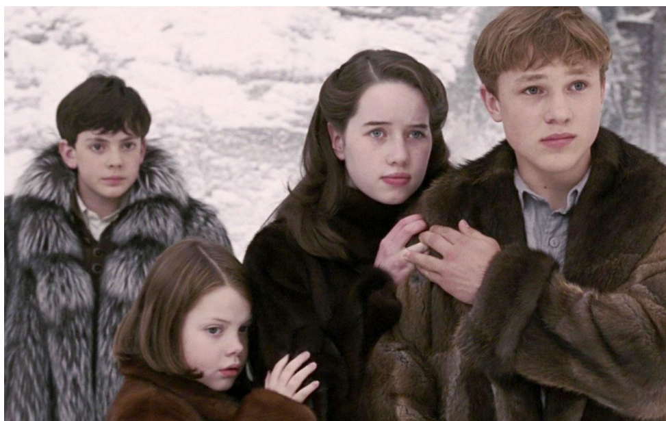
Slika 5. Djeca Pevensie u filmu Kronike iz Narnije: Lav, Vještica i ormar 33