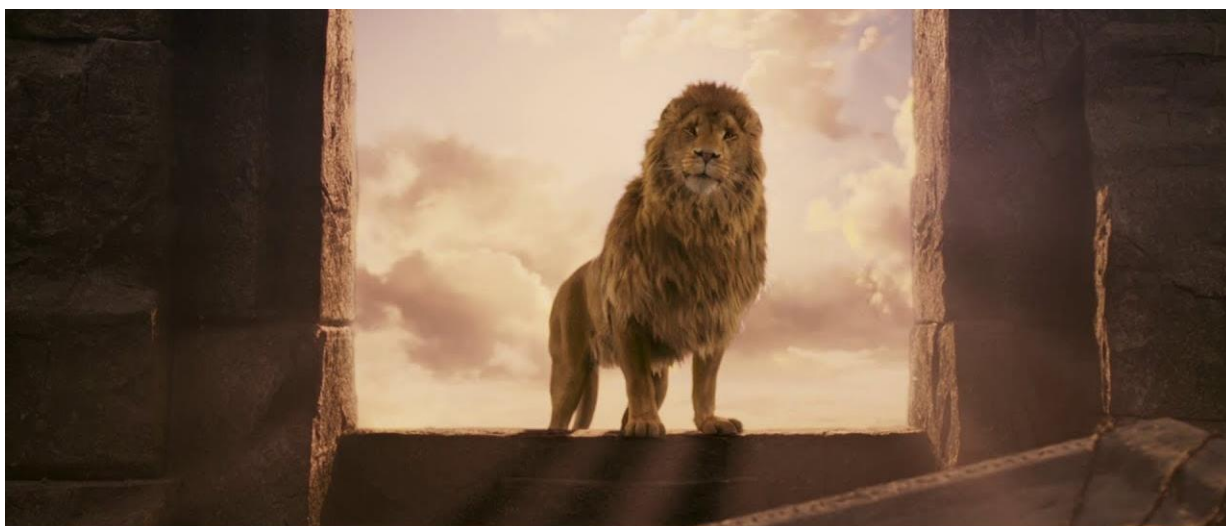
Slika 3. Aslan u filmu Kronike iz Narnije: Lav, Vještica i ormar 26