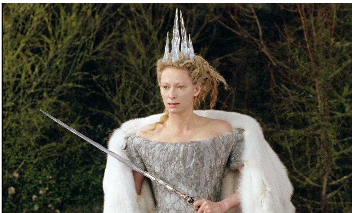
Slika 4. Bijela Vještica u filmu Kronike iz Narnije: Lav, Vještica i ormar 27

U filmu Lav, Vještica i ormar ulogu Bijele Vještrice izvrsno je utjelovila glumica Tilda Swinton. Postupci u kojima želi zadobiti Edmundovo povjerenje karakteriziraju je ravnodušnom i lukavom. Nema afektnih trenutaka, osim kada vrišti na Edmunda jer je došao sam u njezin dvorac, a ne sa svojim bratom i sestrama. Stoga se navedni opis može poistovjetiti s Allevinom (2006) tvrdnjom da zlo ne vrišti i ne odbija, već zavodi.