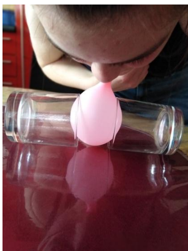
Slika 7. Puhanje balona