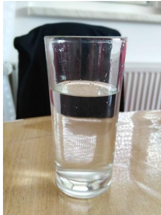
Slika 2. Voda u čaši Napomena. Autorski rad