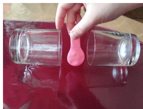
Slika 6. Stavljanje balona između čaša