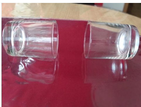
Slika 5. Čaše okrenute jedna prema drugoj

Zaključak ovog pokusa bio bi da se puhanjem u balon stvaraju dva tlaka zraka. Puhanjem balona se stvara atmosferski tlak koji gura balon u čaše te manji tlak zraka čaša koji uvlači balon u čaše. Čaše se drže za balon zbog manjeg tlaka zraka i elastičnosti balona.