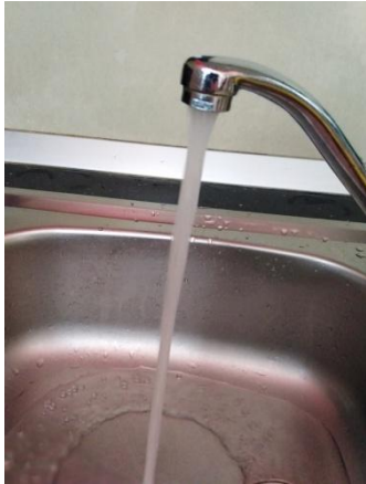
Slika 1. Voda iz slavine Napomena. Autorski rad