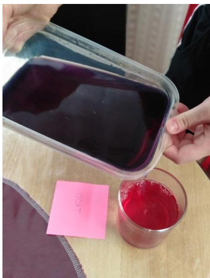
Slika 18. Ulijevanje soka crvenog kupusa u čašu s octom