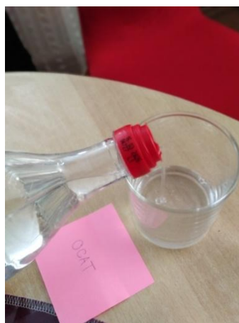
Slika 15. Ulijevanje octa u prvu čašu