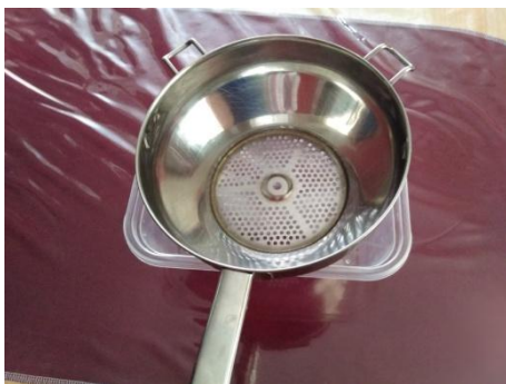
Slika 12. Stavljanje cjediljke na plastičnu posudu