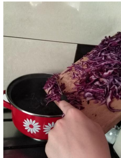
Slika 11. Stavljanje kupusa u kipuću vodu