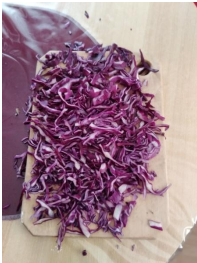
Slika 10. Narezani kupus Napomena. Autorski rad

Zaključak ovog pokusa bio bi da ulijevanjem soka od crvenog kupusa u ocat (kiselinu), sodu bikarbonu (lužinu) i vodu (neutralnu tekućinu), crveni kupus mijenja svoju ljubičastu boju u kiselini i lužini, a ne mijenja u neutralnoj tekućini.