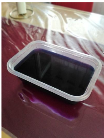
Slika 14. Sok crvenog kupusa u posudi