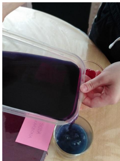
Slika 19. Ulijevanje soka crvenog kupusa u čašu sa sodom bikarbonom Napomena. Autorski rad