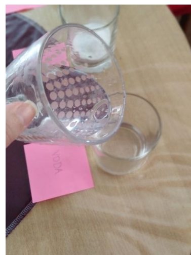
Slika 17. Ulijevanje vode u treću čašu