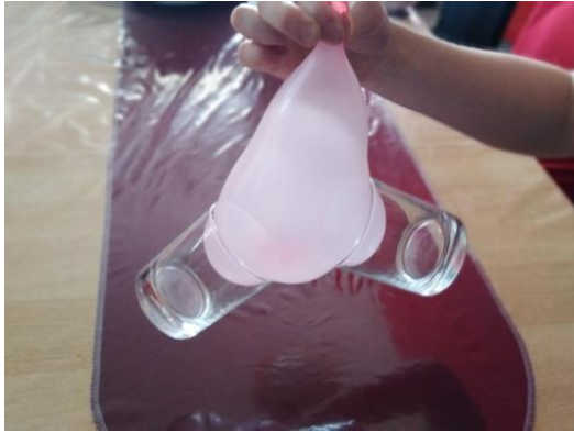
Slika 9. Podizanje balona zajedno s čašama