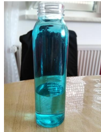
Slika 3. Voda u boci