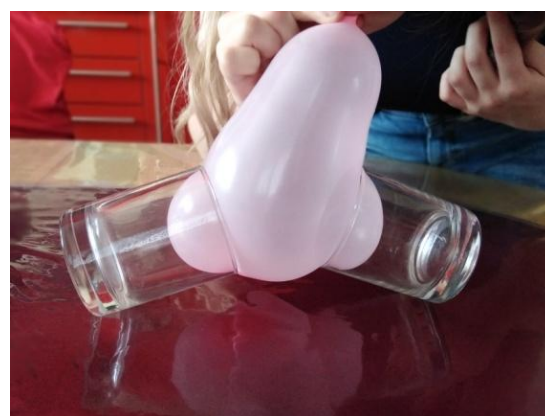
Slika 8. Napuhani balon