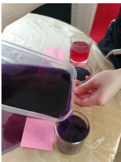
Slika 20. Ulijevanje soka crvenog kupusa u vodu Napomena. Autorski rad