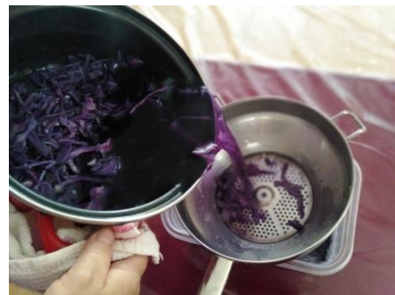
Slika 13. Pretakanje crvenog kupusa Napomena. Autorski rad