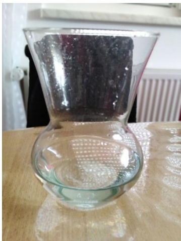
Slika 4. Voda u vazi Napomena. Autorski rad