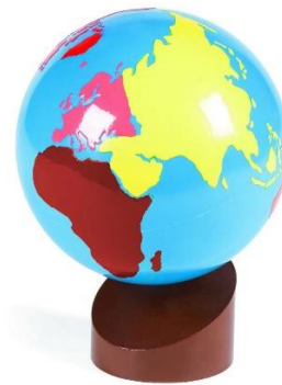
Fotografija 4: Colored Globe ( https://www.gonzagarredi.com/en/?s=Colored+Globe&lang=en )