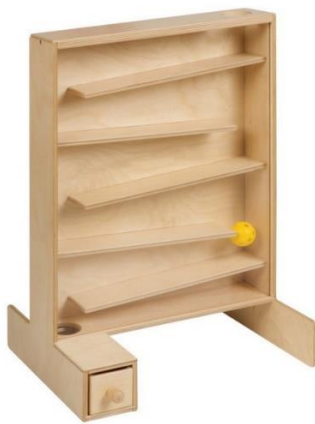
Fotografija 3: Ball Tracker ( https://www.gonzagarredi.com/en/?s=Ball+Tracker&lang=en )