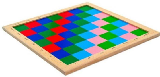
Fotografija 1: Decimal Checker Board