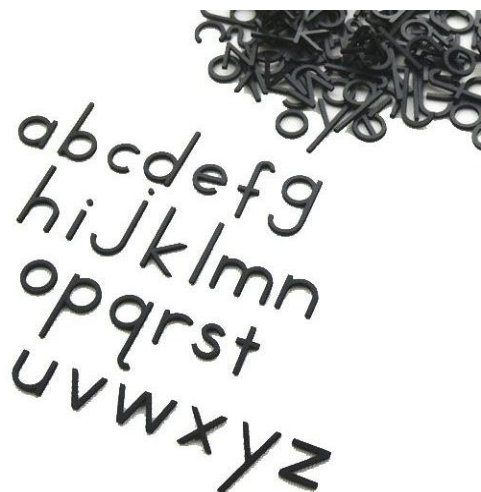
Fotografija 7: Medium Movable Alphabet ( https://montessorionoutlet.com/medium-movable-alphabet-print-black.html )