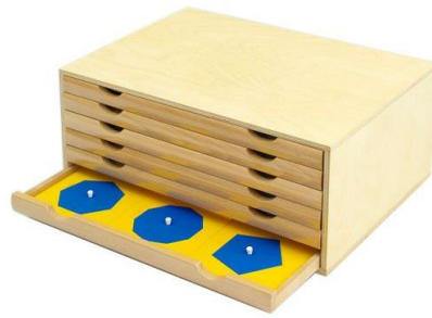
Fotografija 2: Geometric Cabinet ( https://montessorionoutlet.com/geometric-cabinet.html )