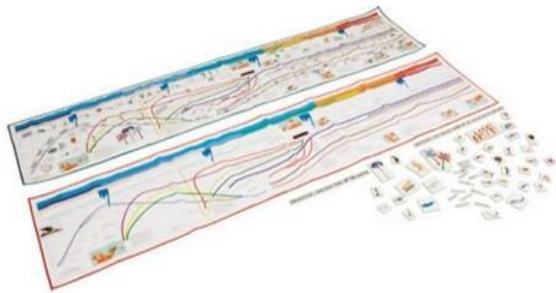
Fotografija 5: Evolution Time Line ( https://www.gonzagarredi.com/en/?s=Evolution+Time+Line&lang=en )