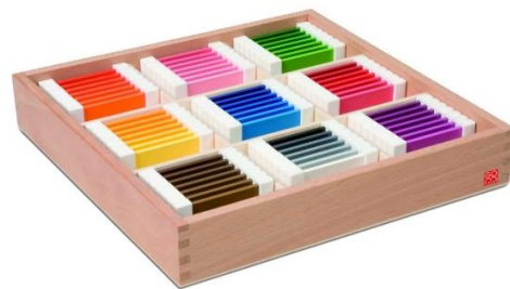
Fotografija 6: Color Tablets ( https://www.gonzagarredi.com/en/product/color-tablets-box-3/ )