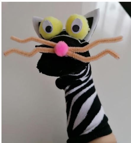
Slika 5. Mačka Frida