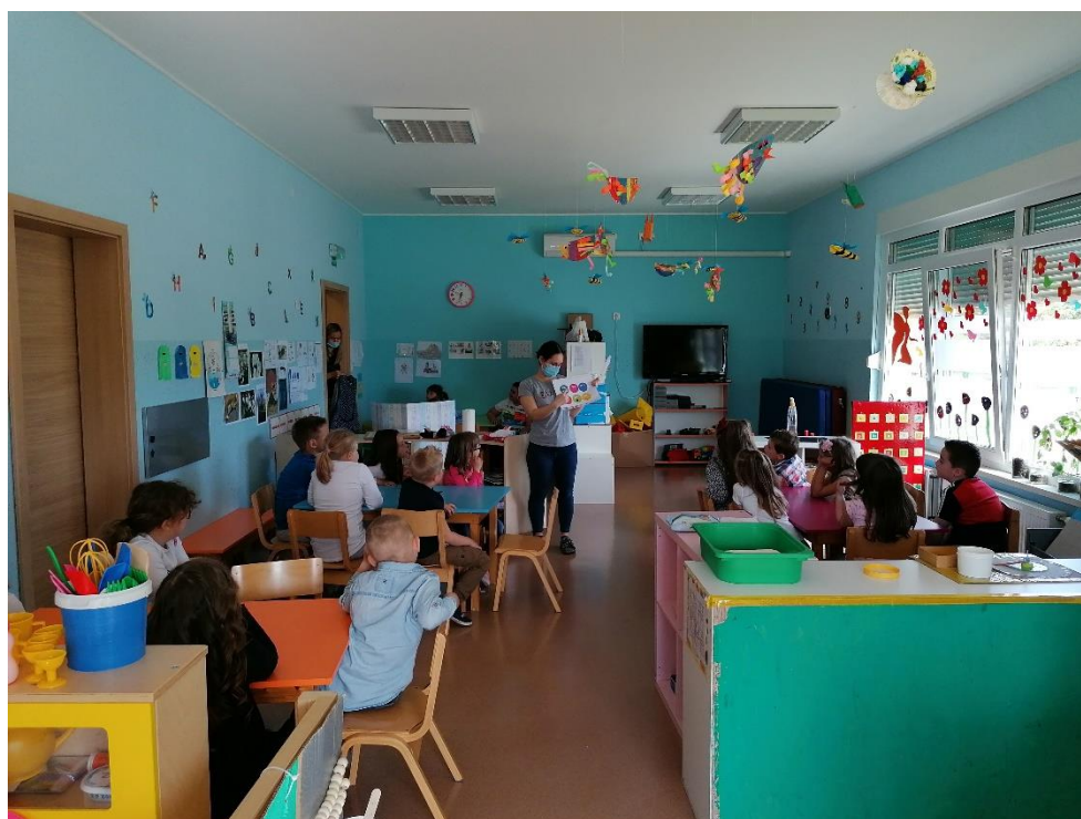
Slika 10. Razgovor o osjećajima

U sklopu likovnih aktivnosti, radionica je bila posvećena trenutnom raspoloženju djece. Nakon razgovora o osjećajima, kako se sve možemo osjećati, kako izgledamo kada smo ljuti, sretni, tužni i sl. djeca su dobila zadatak nacrtati kako se oni danas osjećaju (slika 10). Djeci su podijeljene izrezani obrisi glave mačke, miša i pijetla (plošne lutke na štapu). Njihov zadatak bio je nacrtati oči, nos, usta, obrve, bore ovisno o njihovom trenutnom raspoloženju, nastavno na razgovor. Djeca su odmah prihvatila zadatak i krenula crtati slušajući pjesmu koja je puštena u zadnjem dijelu predstave „Kad se ljutiš“. Nakon što su završili sa crtanjem, svako dijete je stajalo iza paravana držeći svoje raspoloženje, govoreći o tome kako se danas osjeća. Aktivnost je trajala 20 min.