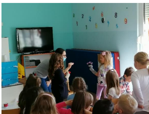
Slika 9. Razgovor pijetla i miša