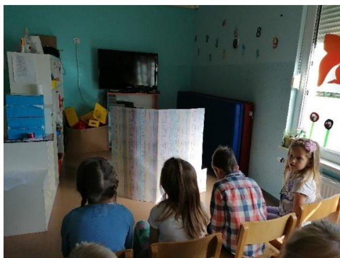
Slika 8. Paravan

Nakon razgovora, smijeha i vrlo zanimljivih odgovora od strane djece, pripremljene su dvije aktivnosti u kojima su sudjelovala djeca. Zbog nedostatka vremena za izradu lutaka koje bi djeca radila, provedena je kraća likovna radionica.