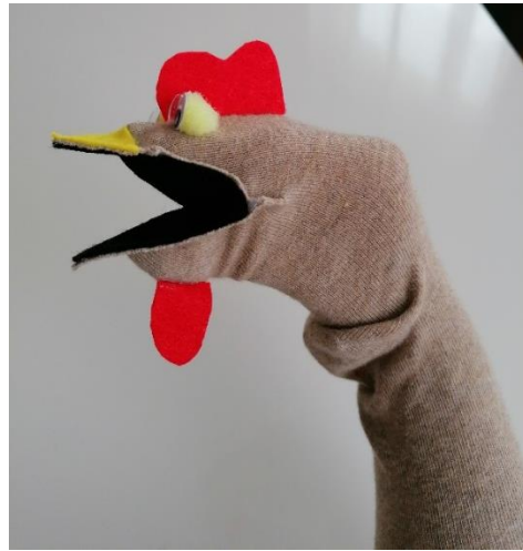
Slika 4. Anatomija lutke ( osobna izrada, vlastiti izvor )