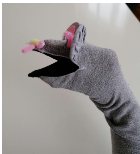
Slika 2. Anatomija lutke (osobna izrada, vlastiti izvor)