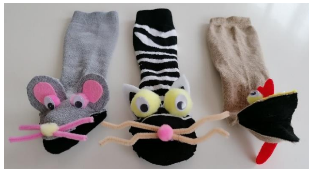
Slika 7. Lutka miša; lutka mačke; lutka pijetla