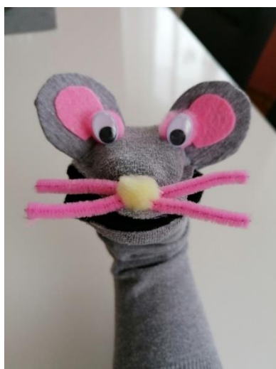
Slika 1. Lutka Miša Wila

U nastavku slijede primjeri izrađenih lutaka korištenih za izvedbu.