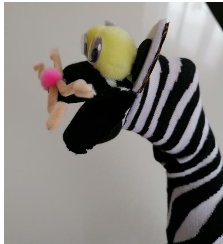
Slika 6. Anatomija lutke