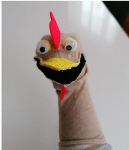
Slika 3. Pijetao Max