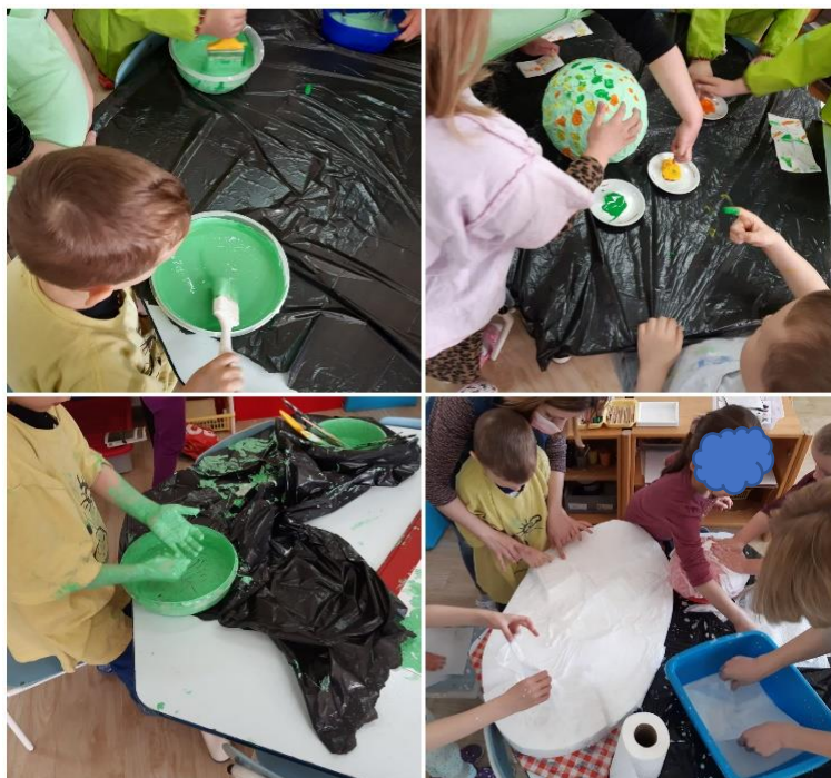
Slika 28. Izrada velike pisanice

Nadalje, slika 29. prikazuje pisanicu koju je izradila djevojčica iz skupine, a dječak V joj je pomogao uz vođenje, te mu je na kraju svoj rad poklonila. Zanimljivo mu je bilo rezati, gužvati, raditi kuglice i lijepiti. Pisanicu je poklonio majci.