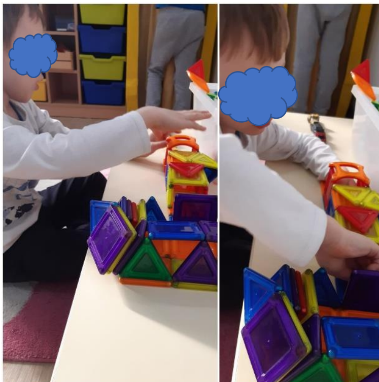
Slika 19. Građenje garaže i tunela za automobile

Autori Morling i O'Connell (2018) ističu kako je u pristupu važno slijediti interes djeteta i iskoristiti ga kako bi se potaknula zajednička pozornost i motivacija. U određenom razdoblju V je često spominjao crtani film „Profesor Baltazar“, te smo u razgovoru s majkom doznali da je to crtani film koji gleda tijekom Neurofeedback terapije i jako ga voli. Iskoristili smo lik iz navedenog crtanoog filma kako bi slikanje temperama zamijenili upotrebom bojica, flomastera i pastela, koje je dosad odbijao i kako bi ga potakli na bojanje unutar linije. Prepoznao je i imenovao što je na slici. Na slici 20. prikazana je djevojčica koja mu pomaže završiti aktivnost do kraja. Kasnije je cijela skupina pogledala crtani film „Profesor Baltazar“.