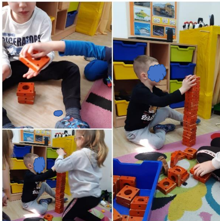
Slika 18. Građenje tornja (u suradnji)