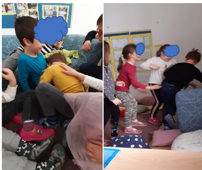
Slika 16. Pokrivanje jastucima

Kako je vrijeme odmicalo, skupina je bila sve otvorenija prema dječaku. Više se ne radi o samo nekoliko djece koji s njime u interakciji, već o većini skupine. Prema Morling i O'Connell (2018) savjetuje se mijenjati osobu koja daje upute kako bi dijete reagiralo na upute od različitih ljudi. Na slici 16. vidljivo je kako V uživa u maženju među djecom i provlačenju između njih. Također, djeca su uvelike promatrala kako odgojiteljice i pomoćnik stupaju u interakciju s V, te su i sama spontano počela koristiti slične strategije i kopirala viđeni model. Riječ je o igri s jastucima u kojoj je prisutno čekanje na red i izmjena redoslijeda. V je uživao kada bi ga se pokrilo jastucima, no onda je morao ustupiti red i djevojčicama, pa je pokrивao on njih. Smijao se tijekom cijele igre.