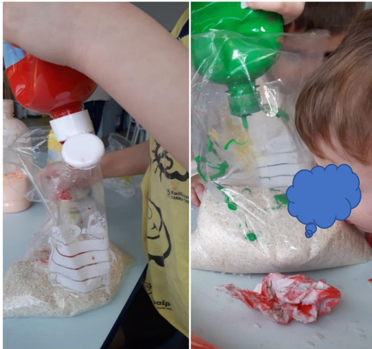
Slika 12. Izrada riže u boji