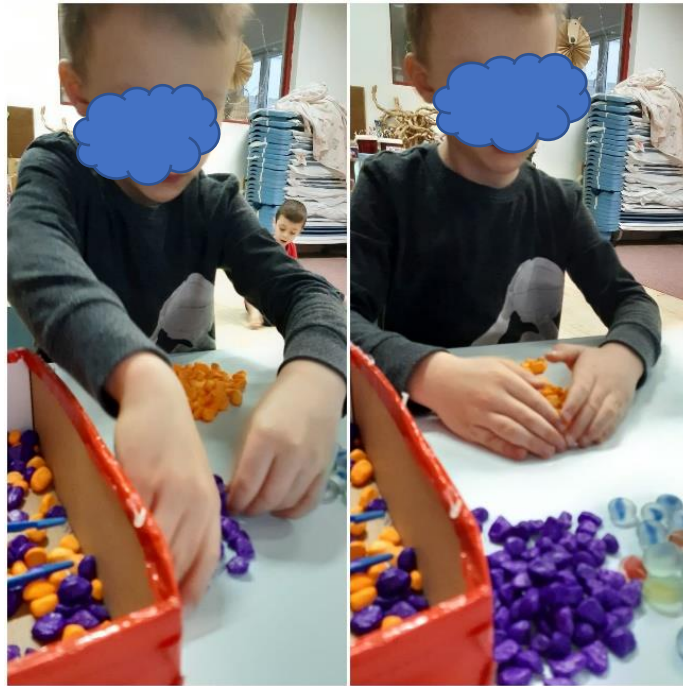
Slika 4. Manipulacija taktilnim materijalom

Nakon, nešto više od mjesec dana provedenih u skupini, djeca su počela komunicirati s V, na način kako su vidjeli da to čine odgojiteljice i pomoćnik. Sve mu više prilaze s prednje strane i pomažu. Koristili su iste rečenice, za koje su čuli da mu govore odgojiteljice, odnosno kopirali su njihov model. Žele mu pokazati gdje se što nalazi. Stavljaju mu igračke i poticaje u vidokrug blizu njega. Hvataju ga za ruke kako bi ih pogledao i govore mu usputno na glas svoja imena. Nekoliko djevojčica u potpunosti je prihvatilo igru s njime, i pokušavaju zadržati njegovu pozornost, dok su se dječaci više držali nekih drugih aktivnosti, i pazili su da im V ne bi srušio nešto što su se trudili sagraditi. Djevojčica sa slike ( slika 5. ) izražava želju za igrom s V. Dulje vremena su se zadržali u ovoj aktivnosti. Nakon igre zajedno su pospremili.