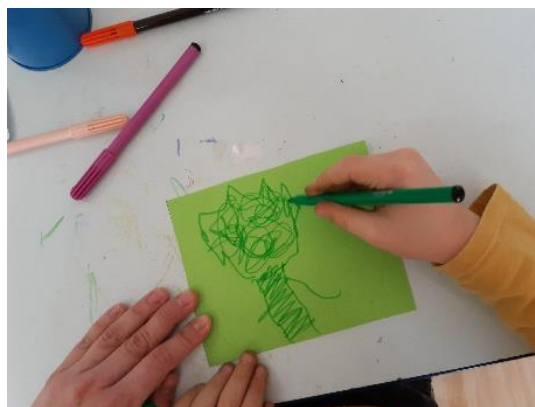
Slika 15. Izrada čestitke za rođendan

Skupina „Pčelice“ i njihove odgojiteljice drže pravilo da povodom rođendana pojedinog djeteta iz skupine, ostala djeca izrade čestitku za njega, odnosno crtaju prema slobodnom izboru i crtež poklone. V je sudjelovao u navedenoj zajedničkoj aktivnosti skupine i nacrtao je sebe. Sudjelovao je uz neposredno vođenje, jer je trebalo upotrijebiti flomastere zbog kojih je negodovao. Nakon što su flomasteri izvađeni iz čaše i „rasuti“ po stolu u njegovom vidokrugu, privukli su mu pozornost, te je pristao crtati s njima. Zajedno s pomoćnikom je imenovao dijelove svoga tijela i što crta.