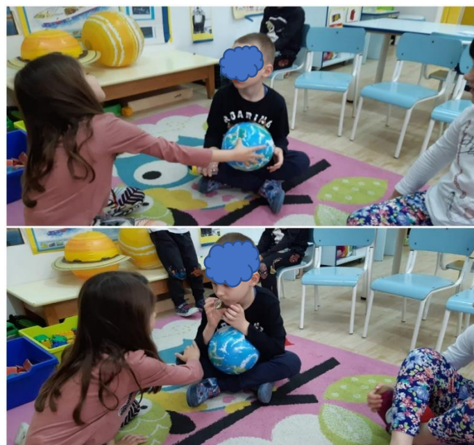
Slika 34. Aktivnosti s loptom

Djevojčice potiču dječaka na zajedničko dodavanje loptom. Dječak je sudjelovao u aktivnosti uz povremeno vođenje pomoćnika, a usmjeravale su ga i djevojčice sa slike. (slika 34.).