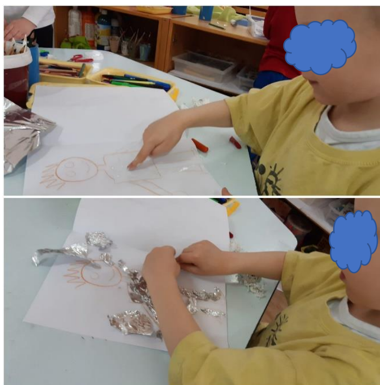
Slika 24. Izrada čovjeka

Slika 24. prikazuje kako je dječak izradio sebe i na upit je imenovao sve dijelove tijela.