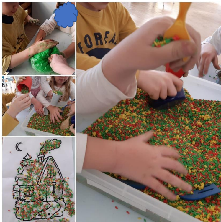
Slika 13. Međusobno dijeljenje riže i popunjavanje rižom unutar linija