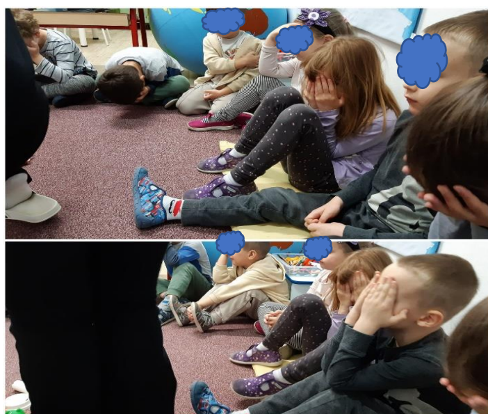
Slika 36. Igra „tko se sakrio“

Na slici 36. nalazi se zajednička igra u krugu u kojoj treba prepoznati što nedostaje od igračaka na tepihu. V promatra što se događa i što druga djeca rade, te nakon nekoliko ponavljanja uključuje se aktivno u igru i pokazuje što nedostaje.