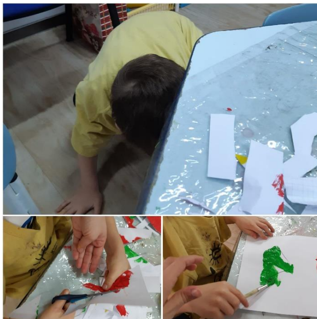
Slika 3. Izrada adventskog vilenjaka

Važno je naglasiti da je između zajedničkih aktivnosti sa skupinom „Pčelice“, dječak uvijek imao i vrijeme tijekom svoga boravka u vrtiću kada bi izabrao aktivnost prema svojim željama i potrebama. „Kako ne bi bili potpuno zbunjeni poželjno je strukturirati slobodne aktivnosti dok dijete ne stekne više iskustva.“ (Morling, O'Connell 2018). Sukladno tome slika 4. prikazuje aktivnost šarenim kamenčićima koje kategorizira prema boji i obliku. To su oblici aktivnosti koji su mu pomagali u samoregulaciji emocija, te je nakon toga bio spremniji za neku od aktivnosti gdje se treba prilagoditi. U ovakvim je aktivnostima želio sam provoditi vrijeme i nije dopuštao da ga se ometa. Također, u sobi dnevnog boravka, nalazio se i mirni kutić, u kojem je bila velika kućica od kartona. Kućica je bila ispunjena senzornim poticajima. Dječak bi se povukao u nju kada bi bio ljut na odgojiteljice, kada bi mu bilo previše podražaja ili zahtjeva iz okoline. Također, povukao bi se unutra, malo prije nego što je trebao ići kući, odnosno na kraju boravka u vrtiću.