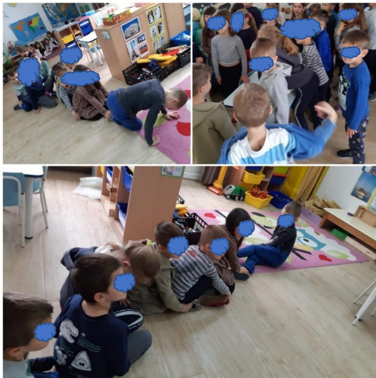
Slika 40. Procesna drama

Slika 40. predstavlja izvođenje procesne drame na razini cijele skupine. Dječak V je bio uključen prema svojim mogućnostima, odnosno pratio je pokrete koje djeca izvode. Poveo je krug, smijao se i okretao da provjeri idu li djeca za njim.