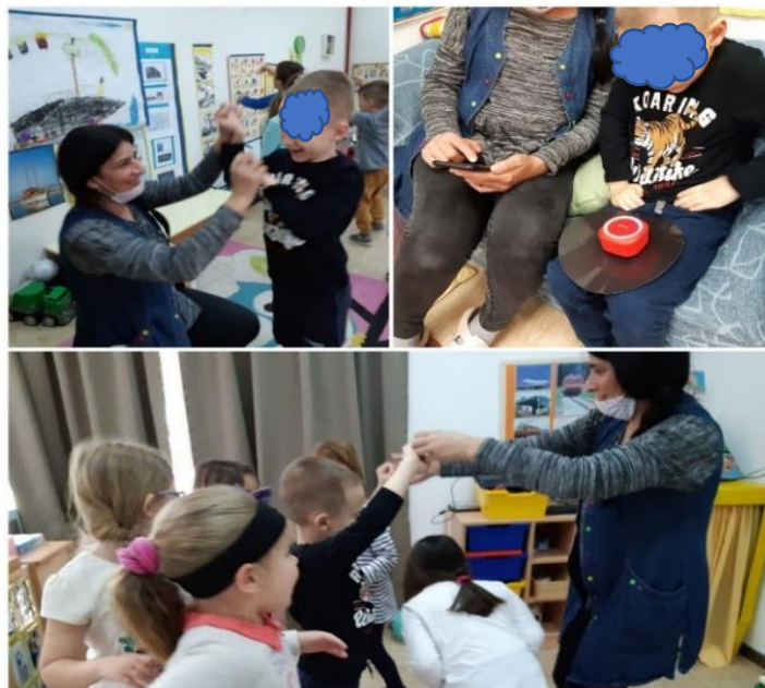
Slika 35. Igre s pjevanjem

V je volio gledati djecu kako se provlače kroz ruke, uz glazbu i pjesmu, bio je jako sretan u navedenoj aktivnosti (slika 35.). Kasnije je sam puštao i zaustavljao pjesme. Veselila ga je reakcija djece, a zvučnik koji je držao u ruci stvarao je vibracije, što mu je dulje održalo pozornost u aktivnosti.