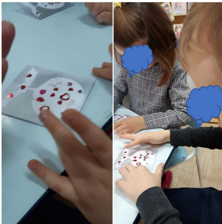
Slika 6. Izrada božićne čestitke

Na slici 7. djevojčice su spontano pozvale dječaka u zajedničku igru. Donijele su lutke i stavile mu u ruke, nakon čega im se dječak priključio. Zadržao se dulje vremena u aktivnosti pored njih. Negodovao je kada bi mu nešto uzele ili htjele zamijeniti. Nije želio ništa podijeliti, već se samo okrenuo od njih.