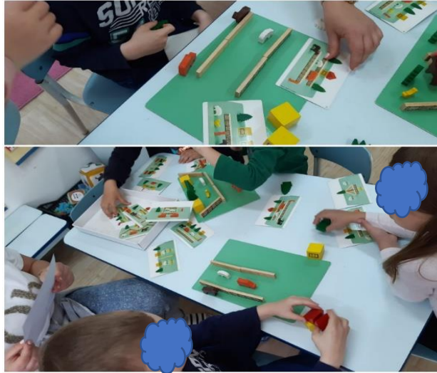
Slika 37. Slaganje farme prema predlošku

Prikazana je didaktička igra. Kao što je ranije spomenuto V je rijetko iskazivao interes i rijetko je sudjelovao u aktivnostima navedenog tipa jer tijekom terapija koje je pohađao bilo je zastupljeno dosta didaktičkog materijala, pa je bio zasićen ( slika 37. ).