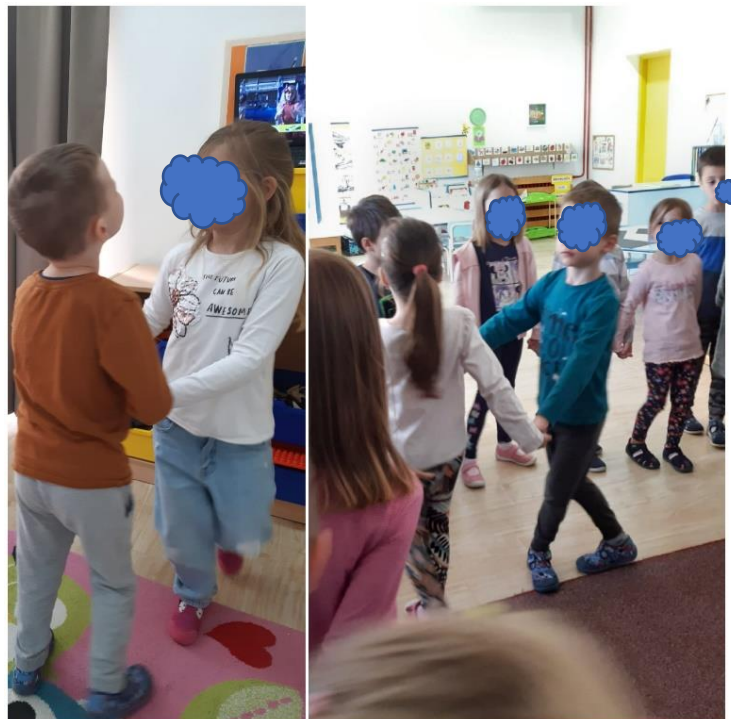
Slika 27. Igre s pjevanjem

Na slici 27. V po prvi put prihvaća ples u paru tijekom glazbenih aktivnosti (igre s pjevanjem), na poticaj djevojčica iz skupine koja ga je samoinicijativno uhvatila za ruke. Često su plesali zajedno.