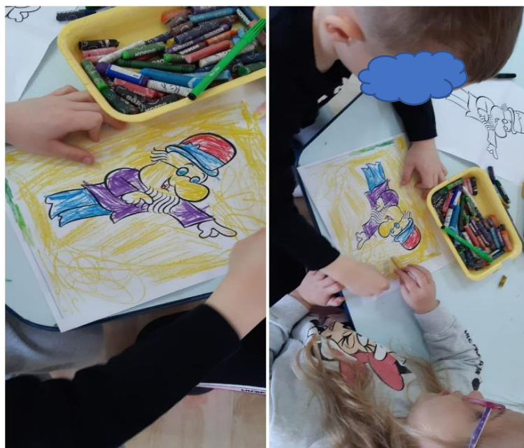
Slika 20. Suradničko bojanje korištenjem pastela

Na slici 21. prikazana je zajednička izrada domaćeg kinetičkog pijeska. Dječak je vrlo rado sudjelovao u ovoj aktivnosti. Pijesak mu je uvijek bio dostupan, upravo zbog moguće pojave nepoželjnih obrazaca ponašanja. U takvim situacijama, preusmjeravanje na navedenu vrstu aktivnosti pokazalo se najučinkovitije uz kratke i jasne upute, usmjerene dječaku. Kasnije je aktivnost proširena dodavanjem posuđa iz centra kuhinje.