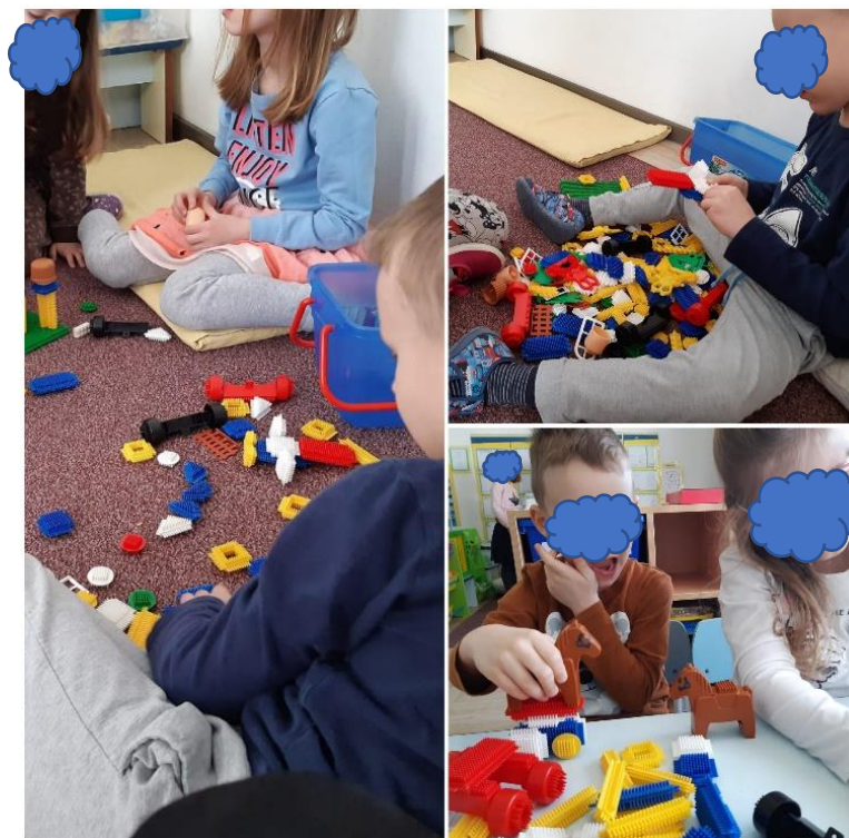
Slika 25. Zajednička igra konstruktorima

Na slici 26. aktivnost s kinetičkim pijeskom bila je proširena na način da je uvedeno novo pravilo. Izrađene životinje su se skupljale i imenovale, te smo ih zajedno brojali. V je često rušio, odmah nakon što je izradio oblik pomoću kalupa. Sada je uz poticaj i vođenje čekao da sakupi nekoliko životinja, prebroji ih, a tek nakon toga mogao ih je uništiti što je za njega predstavljalo izazov.