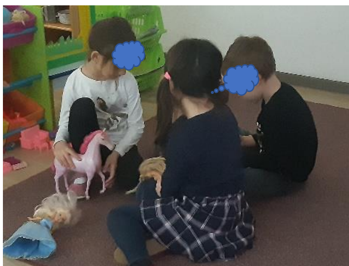
Slika 7. Paralelna igra s lutkama

Na slici 7. djevojčice su spontano pozvale dječaka u zajedničku igru. Donijele su lutke i stavile mu u ruke, nakon čega im se dječak priključio. Zadržao se dulje vremena u aktivnosti pored njih. Negodovao je kada bi mu nešto uzele ili htjele zamijeniti. Nije želio ništa podijeliti, već se samo okrenuo od njih.