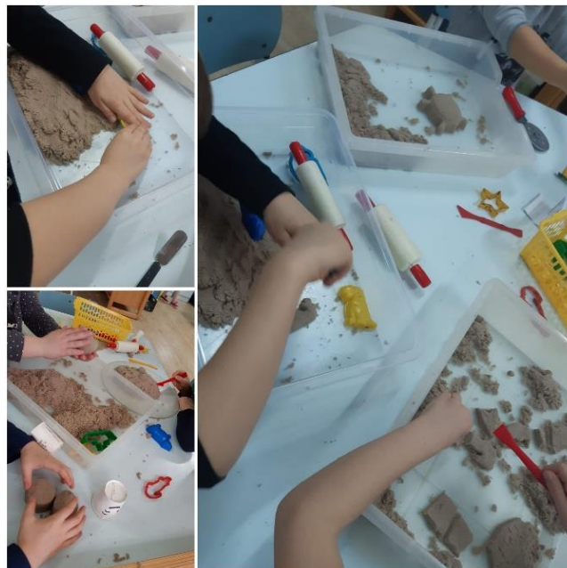
Slika 8. Manipulacija kinetičkim pijeskom i dijeljenje pribora

Kroz igru s pijeskom, naglasak je bio na ponavljanju imena prijatelja iz skupine i na dijeljenju pijeska i pribora s drugom djecom ( slika 8. ), te primjerenom zahtjevu za vraćanjem pribora nazad. U početku V nije ništa želio dijeliti, pa je bilo potrebno rastavljanje aktivnosti na manje korake te stalno usmjeravanje i vođenje ruke da bi navedeno dao prijateljima. Ono što je podijelio odmah je tražio nazad ispuštajući zvukove. Verbalno ga se poticalo kako bi izgovorio zahtjev „daj mi“. Bilo je potrebno više vremena i dosljednog ponavljanja dok je dječak usvojio spomenuto. Dječak je u ovoj igri imao puno višu stopu tolerancije te je lakše slijedio upute, jer mu je kinetički pijesak pružao taktilnu stimulaciju koja mu je odgovarala.. Također, manipulacija pijeskom mu je uvelike pomogala u samoregulaciji emocija i nepoželjnih oblika ponašanja. Spomenuta aktivnost često se ponavljala, a dječak se s vremenom, kada bi vidio da su djeca izvadila kinetički pijesak na stol, samoinicijativno pridružio.