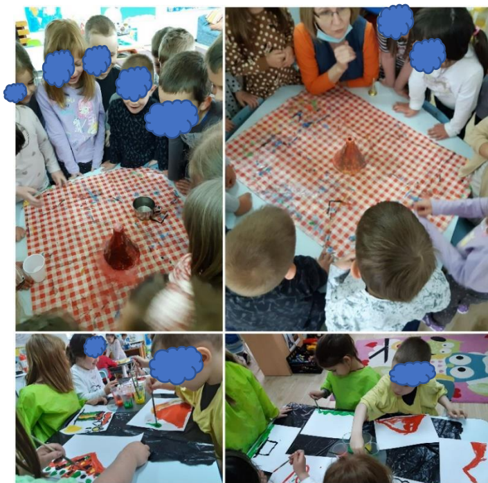
Slika 38. Nastajanje vulkana

Nadalje, dok su djeca bila na okupu, pomoću vizualne podrške, V bi uz usmjeravanje ponavljao imena djece i tražio ih po sobi. Teško je povezivao ime prijatelja iz skupine sa slikom, dok je prijatelja sa slike uživo prepoznao uspješno. Usvojio je imena od četvero djece koja su najčešće bila u njegovoj blizini ( slika 39. ).