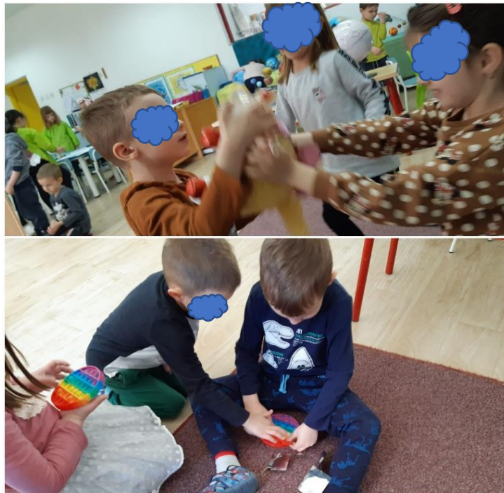
Slika 31. Igračke donesene od kuće

Također, valja istaknuti da kada bi netko od djece iz skupine slavio rođendan u nekoj od igraonica izvan vrtića, V je također bio pozvan na takva događanja zajedno sa skupinom.