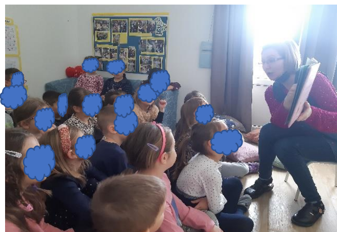
Slika 23. Slušanje priče

Slika 24. prikazuje kako je dječak izradio sebe i na upit je imenovao sve dijelove tijela.