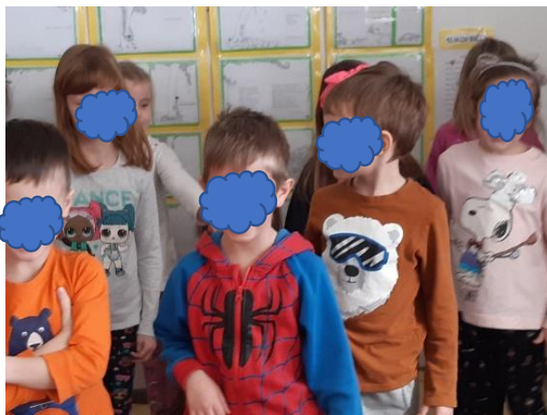
Slika 17. Zajednički ples

V jako voli glazbu i pjesmice, nije osjetljiv na buku, te se uključuje u zajednički ples sa „Pčelicama“ i u igre s pjevanjem ( slika 17. ).