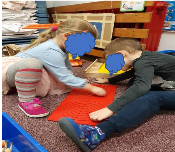
Slika 5. Suradnička igra

Dječak je često negodovao i lupao nogama ili vikao kada bi ga se pokušalo verbalno preusmjeriti iz jedne aktivnosti u drugu, ili na npr. iz centra građenja pozvati u likovni centar i pokazati mu što djeca tamo rade. Ranije je bilo navedeno, da je dječak na gotovo svaki verbalni upit odgovarao sa „ne“. Slika 6. prikazuje izradu božićne čestitke u suradnji s djevojčicom. V je u ovu aktivnost bio usmjeren i pozvan na način, da je uzeta kutija s perlicama i stavljena mu u ruke. Nakon toga je uz uputu stavio to na stol, gdje djeca već rade svoje čestitke te je sjeo zajedno s njima.