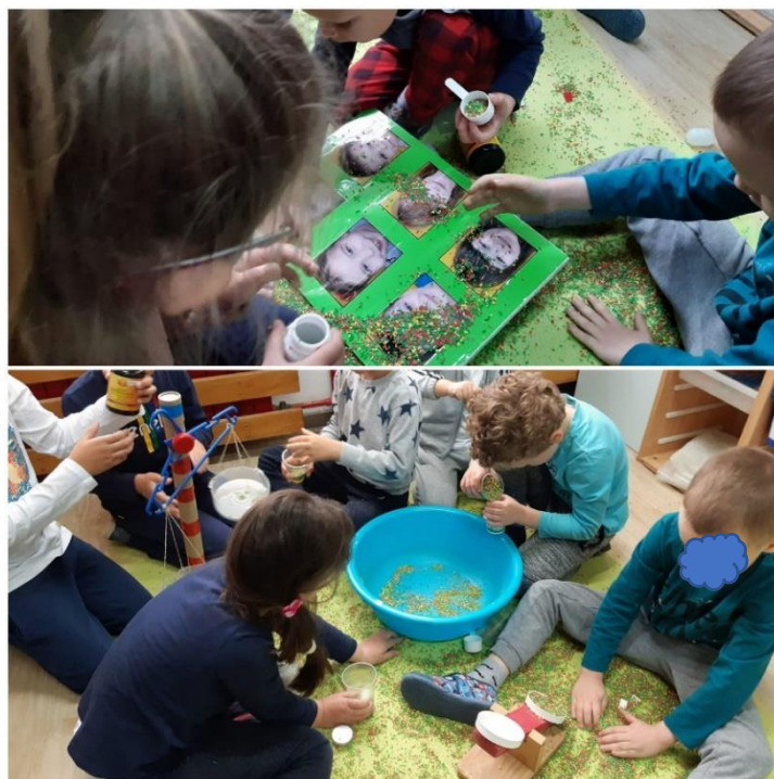
Slika 39. Vizualna podrška

Nadalje, dok su djeca bila na okupu, pomoću vizualne podrške, V bi uz usmjeravanje ponavljao imena djece i tražio ih po sobi. Teško je povezivao ime prijatelja iz skupine sa slikom, dok je prijatelja sa slike uživo prepoznao uspješno. Usvojio je imena od četvero djece koja su najčešće bila u njegovoj blizini ( slika 39. ).