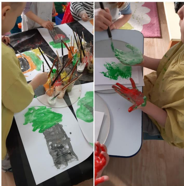
Slika 11. Aktivnosti iz likovnog centra

V: Oblak, trava. V crta drvo, oblak, trava.