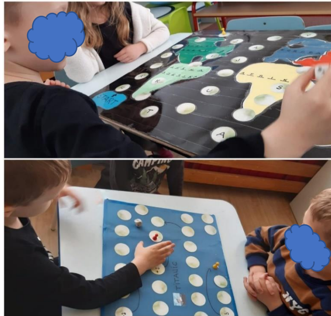
Slika 33. Društvena igra

Dječak po prvi puta sudjeluje u društvenoj igri s kockom. Naizmjenično su bacali kocku i zajedno brojali uz vođenje i usmjeravanje. Dječak je slijedio verbalne upute pomoćnika.