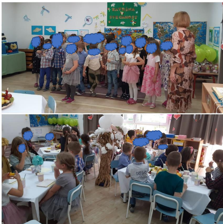
Slika 41. Završna priredba