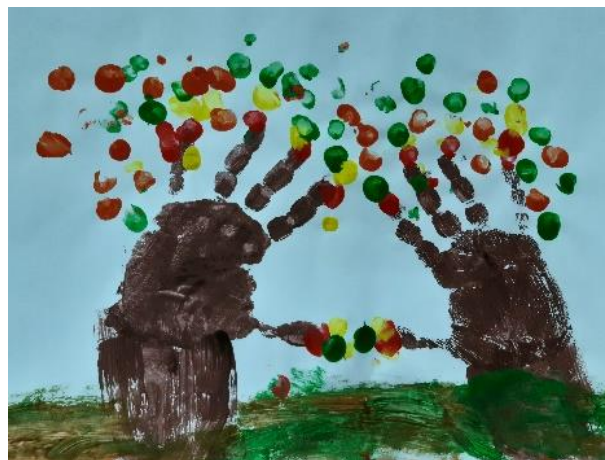
Slika 2. Otisak dlana

S obzirom da su se nalazili blizu početka adventskog razdoblja, skupina „Pčelice“ izrađivala je svoje vilenjake za adventski kalendar. I V je zajedno s ostalima, obojao i izradio svog vilenjaka, te pokupio i pospremio papiriće sa stola. Dječak je ( slika 3. ) odbijao koristiti bojice ili flomastere, pa je bojao temperom.