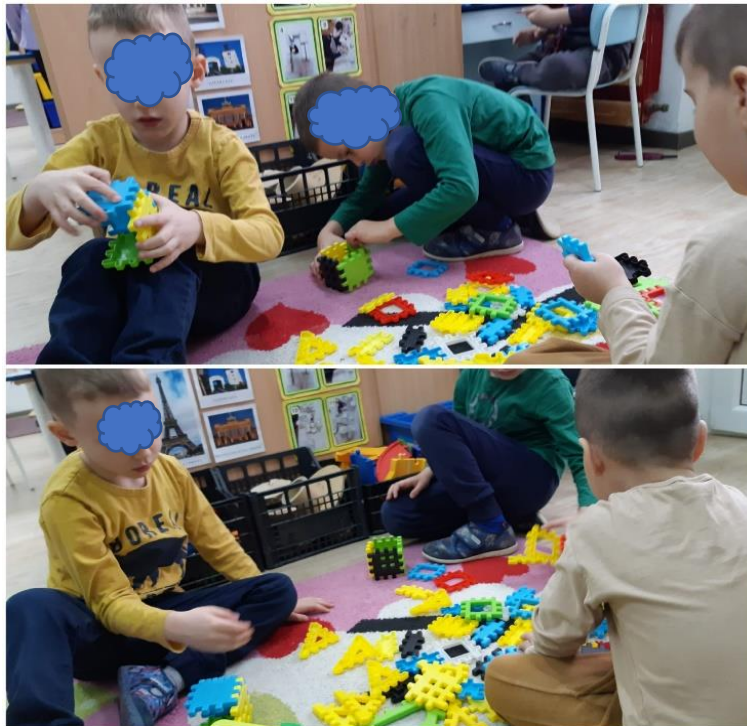
Slika 22. Igra konstruktorima u centru građenja

V se samoinicijativno pridružio dječacima u centru građenja ( slika 22. ) te upotrebljava konstruktore na isti način kao i oni. Na upit što to gradi, odgovara da gradi kuću. Zajednička aktivnost bila je iskorištena i u svrhu ponavljanja imena dječaka, kako bi što je moguće više osvijestio s kime se igra. Djeca su dosada već bila navikla na njega. Nisu više ispitivala zašto on nešto radi ili ne radi.