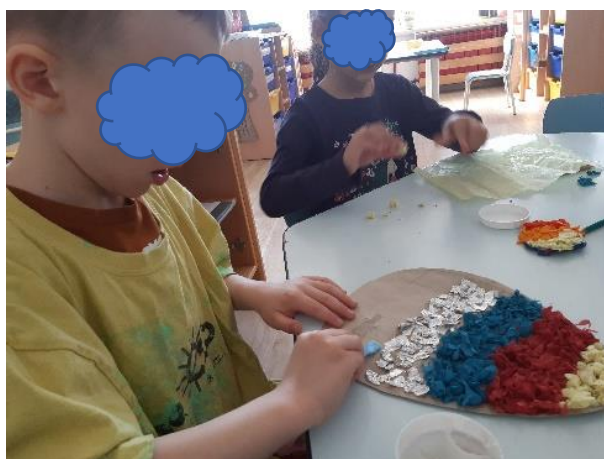
Slika 29. Izrada pisanice – poklon djevojčice

Nadalje, slika 29. prikazuje pisanicu koju je izradila djevojčica iz skupine, a dječak V joj je pomogao uz vođenje, te mu je na kraju svoj rad poklonila. Zanimljivo mu je bilo rezati, gužvati, raditi kuglice i lijepiti. Pisanicu je poklonio majci.