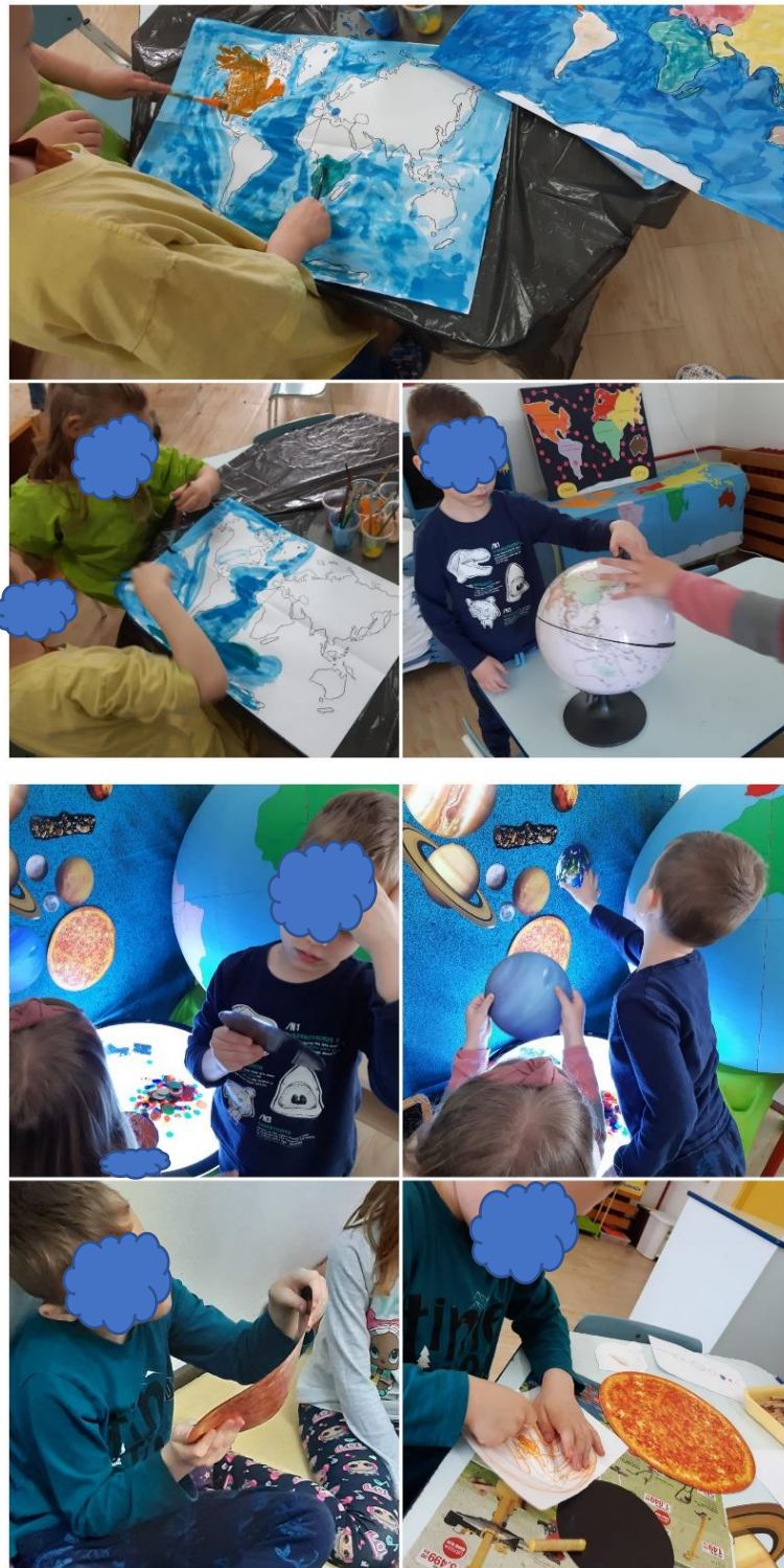
Slika 30. Projekt „Svemir i Zemlja“

S obzirom na njegov veliki interes prema promatranju nastojalo se da promatranje povremeno bude zajedničko te da zapaženo zabilježi na papir kako bi se aktivnost proširila (slika 30.).