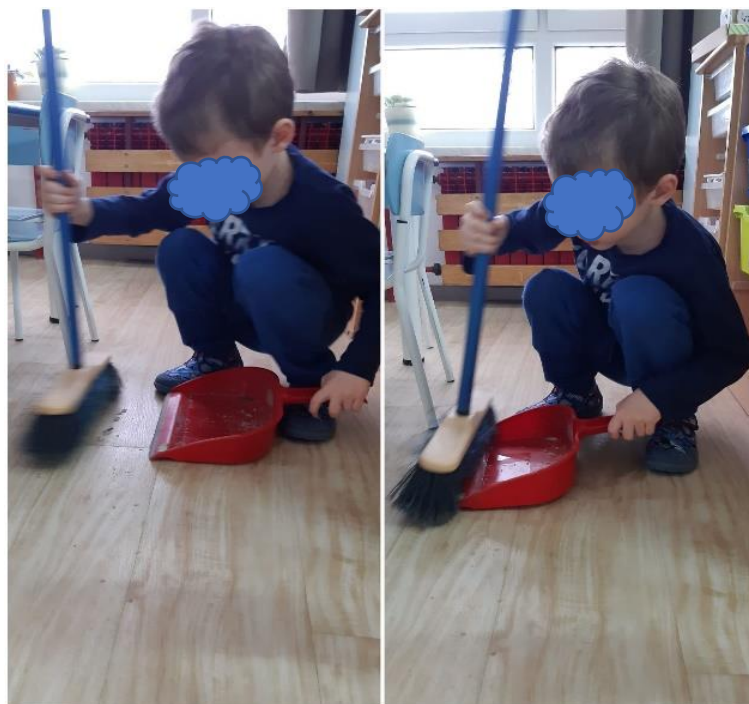
Slika 9. Spremanje sobe dnevnog boravka

Aktivnost je najčešće bila prekinuta, na način da je dječaku dana kratka verbalna uputa s informacijom o pospremanju. Dječak je aktivno sudjelovao u čišćenju pijeska s poda i stola ( slika 9. ), ali i u pospremanju sobe dnevnog boravka općenito. Jedan od spomenutih zadataka bio je da dječak kroz svoj dnevni boravak u vrtiću promjeni otprilike tri aktivnosti uz preusmjeravanje i vođenje, kako se ne bi predugo zadržavao u određenim aktivnostima, te kako bi mu boravak u skupini bio dinamičan i prožet novim iskustvima. Kao što je ranije spomenuto prilikom promjene aktivnosti ili uključivanja dječaka u određenu aktivnost najčešće se primjenjivalo neverbalno (fizičko) usmjeravanje pokazivanjem poticaja, stavljanjem poticaja u njegov vidokrug, ili demonstracijom s kombinacijom verbalne upute. Ovisno o situaciji, ponekad se primjenjivalo više načina usmjeravanja pažnje, a ponekad samo jedan (npr. stavljanje poticaja u vidokrug, bez verbalne upute). Naime, sustav potpomognute komunikacije dječak je često susretao u radu sa svojim terapeutima i logopedom, što su potvrdili i roditelji, pa se vizualne kartice s rasporedom i prikazom aktivnosti u radu s dječakom nisu koristile, jer ih je odbijao. Sličnu reakciju imao je i za didaktički materijal (npr. umetaljke, slagalice itd.) te su takve aktivnosti tijekom boravka u vrtiću korištene u manjoj mjeri, kako dječak ne bi bio preopterećen očekivanjima.