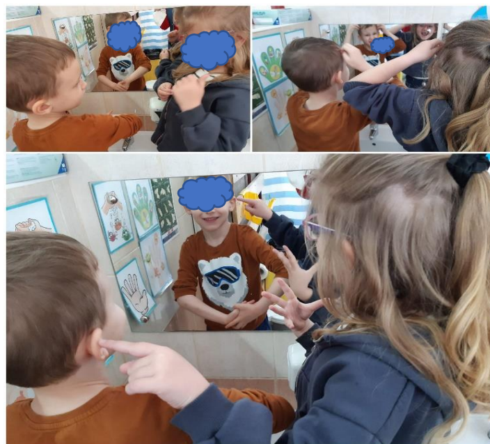
Slika 32. Spontana interakcija

Slika 32. prikazuje spontanu interakciju djevojčice i dječaka pred ogledalom u kupaonici. Ona je njega ispitivala gdje mu se što na tijelu nalazi i pokazivala, potom su pred ogledalom pokazivali zajedno svoju kosu, oči, nos, itd.