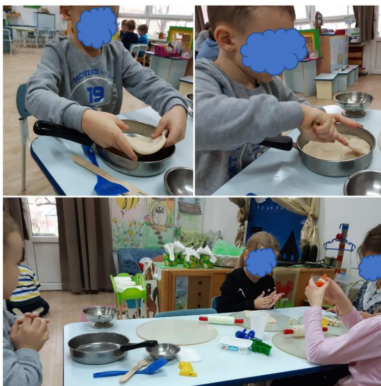
Slika 1. Funkcionalna igra tijestom

Slika 2. prikazuje dječakov prvi likovni rad koji je nacrtao uz usmjeravanje. Likovni radovi koje je do tada samostalno crtao bili su najčešće krugovi u bojama koje bi on definirao kao auto. Kao što je već spomenuto, dječak je pokazao interes prema temperama. Najviše voli miješati temperu s vodom i promatrati što se događa. Sudjelovao je i u pripremi aktivnosti tako što je izlio boje na tanjuriće, te donio vodu i kistove. Uz poticaj umočio je prste i dlanove u različite boje tempera, što ga je iznimno veselilo, i radio otiske. Kada je završio, oprao je pribor.