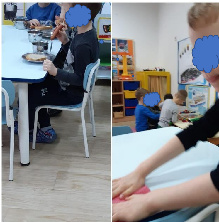
Slika 10. Doručak i pospremanje nakon doručka

Djeca iz spektra autizma često pokazuju nisku toleranciju na određenu teksturu hrane ili na hranu različite teksture. Ne vole konzumirati nove i njima nepoznate namirnice, pa se tako pri provedbi aktivnosti hranjenja koriste različite strategije. Jedna od strategija je stavljanje nove hrane u vidokrug djeteta (Morling i O'Connell, 2018). Spomenuta strategija koristila se i u radu s dječakom. U početku pohađanja vrtića V je doručkovao samo kruh i vodu, a postupno se proširivao izbor namirnica koje bi kušao. Na koncu je, promatrajući djecu za doručak pio čaj, jeo pečena jaja, hrenovke ( slika 10. ), griz, paštetu, namaz od tune itd. Kako je V bio uključen u trosatni program, nije bio prisutan na ručku sa skupinom.