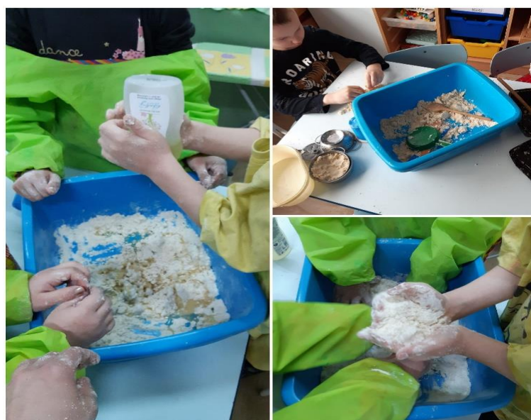
Slika 21. Izrada kinetičkog pijeska

Na slici 21. prikazana je zajednička izrada domaćeg kinetičkog pijeska. Dječak je vrlo rado sudjelovao u ovoj aktivnosti. Pijesak mu je uvijek bio dostupan, upravo zbog moguće pojave nepoželjnih obrazaca ponašanja. U takvim situacijama, preusmjeravanje na navedenu vrstu aktivnosti pokazalo se najučinkovitije uz kratke i jasne upute, usmjerene dječaku. Kasnije je aktivnost proširena dodavanjem posuđa iz centra kuhinje.