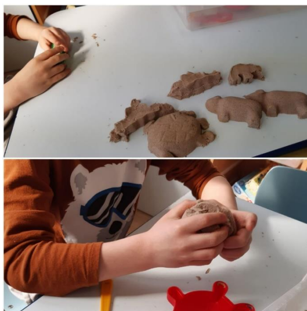
Slika 26. Sakupljanje i imenovanje, te brojanje životinja

Na slici 26. aktivnost s kinetičkim pijeskom bila je proširena na način da je uvedeno novo pravilo. Izrađene životinje su se skupljale i imenovale, te smo ih zajedno brojali. V je često rušio, odmah nakon što je izradio oblik pomoću kalupa. Sada je uz poticaj i vođenje čekao da sakupi nekoliko životinja, prebroji ih, a tek nakon toga mogao ih je uništiti što je za njega predstavljalo izazov.