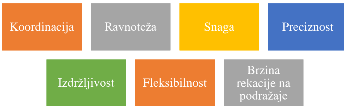
Slika 2. Osnovne motoričke sposobnosti