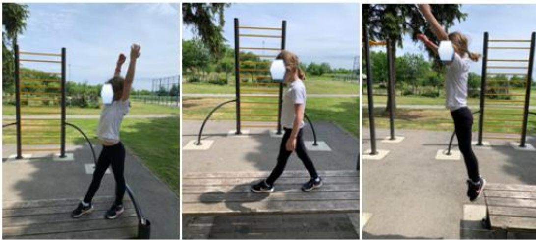
Slika 7. Hodanje po suženoj površini i saskok pruženi

Stoj na lopaticama predstavlja vježbu koordinacije i ravnoteže. Izvodi se na način „da se iz upora sjedećeg sunožno izvodi povaljka do lopatica i vratnog dijela kralježnice s podizanjem nogu i kukova prema gore. Trup i noge su u ravnoj liniji te su okomite na podlogu“ (Rukavina, 2018). Najlakši položaj za djecu je onaj u kojem dijete rukama podupire kukove. Prilikom izvođenja vježbe stoja na lopaticama razvija snaga trupa, te snaga mišića vrata. vježbe za izvođenje ovog elementa su vježbe simulacije vožnje bicikla, dijete leži na leđima, podiže kukove pomoću ruku, te simulira vožnju bicikla.