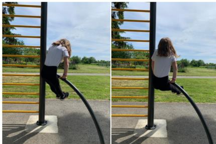
Slika 8. Njihanje

Na Slici 8 može se vidjeti njihanje djeteta na igralištu pomoću sprave. Na ovaj način dijete predškolske dobi jača mišiće ruku, trupa, te razvija sposobnost ravnoteže i izdržljivosti. Ova vježba se također smatra relativno zahtjevnom jer dijete treba imati razvijene mišiće ruku za pravilno izvođenje ove vježbe. Prema tome, bitno je da odgajatelj bude prisutan te ukoliko je potrebno pomogne djetetu pri izvođenju vježbe.