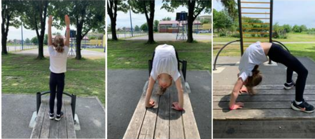
Slika 5. Most

Slika 5 predstavlja element sportske gimnastike pod nazivom most. Ovim elementom djeca predškolske dobi jačaju mišiće leđa, te poboljšavaju fleksibilnost. Početni položaj za djecu predškolske dobi je ležeći položaj na leđima s dlanovima oslonjenim na strunjaču pokraj glave. Iz ležećeg položaja i zgrčenih nogu, dijete se opire o stopala i dlanove, te podiže kukove prema gore i uvijanjem leđa (Čuljak, 2013). Ova vježba također pridonosi pravilnom držanju djeteta te smanjuje vjerojatnost pojave deformiteta kralježnice, odnosno savijanja kralježnice u stranu.