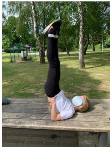
Slika 6. Stoj na lopaticama

Slika 5 predstavlja element sportske gimnastike pod nazivom most. Ovim elementom djeca predškolske dobi jačaju mišiće leđa, te poboljšavaju fleksibilnost. Početni položaj za djecu predškolske dobi je ležeći položaj na leđima s dlanovima oslonjenim na strunjaču pokraj glave. Iz ležećeg položaja i zgrčenih nogu, dijete se opire o stopala i dlanove, te podiže kukove prema gore i uvijanjem leđa (Čuljak, 2013). Ova vježba također pridonosi pravilnom držanju djeteta te smanjuje vjerojatnost pojave deformiteta kralježnice, odnosno savijanja kralježnice u stranu.