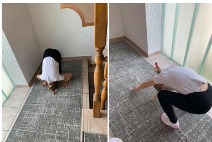
Slika 3. Kolut naprijed

U ovom dijelu završnog rada navest će se osmišljeni primjer pojedinih vježbi kineziološkog sata sportske gimnastike koje su prilagođene djeci predškolske dobi. Primjer je osmišljen za djecu starije predškolske grupe. Slika 3 prikazuje izvođenje vježbe kolut naprijed. Važno je napomenuti da su radi mjera nastalih uslijed pandemije COVID-19 sljedeće slike nastale na dječjem igralištu. Vježbu izvodi dijete starije predškolske skupine.