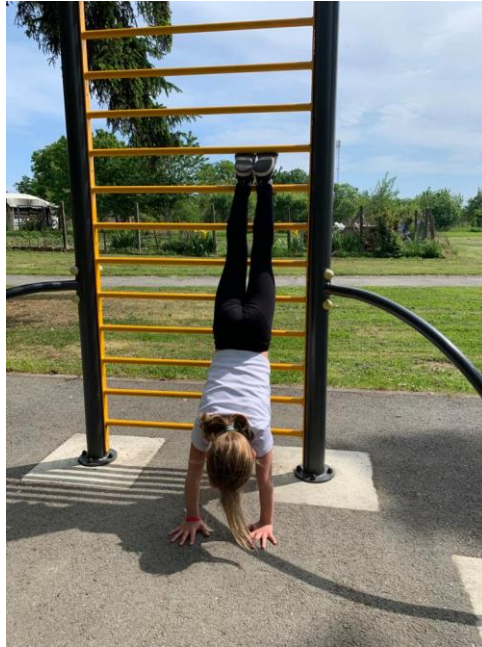
Slika 4. Stoj na rukama

uspravnog položaja, s rukama kroz predručjenje do uzručenja” (Fiolić, 2015). Kao i prilikom izvođenja gimnastičkog elementa koluta naprijed, uz dijete stoji odgajatelj, pomaže hvatanjem za trup djeteta. Ova vježba znatno pridonosi pravilnom razvoju kralježnice, odnosno pridonosi pravilnom i ispravnom držanju djeteta.