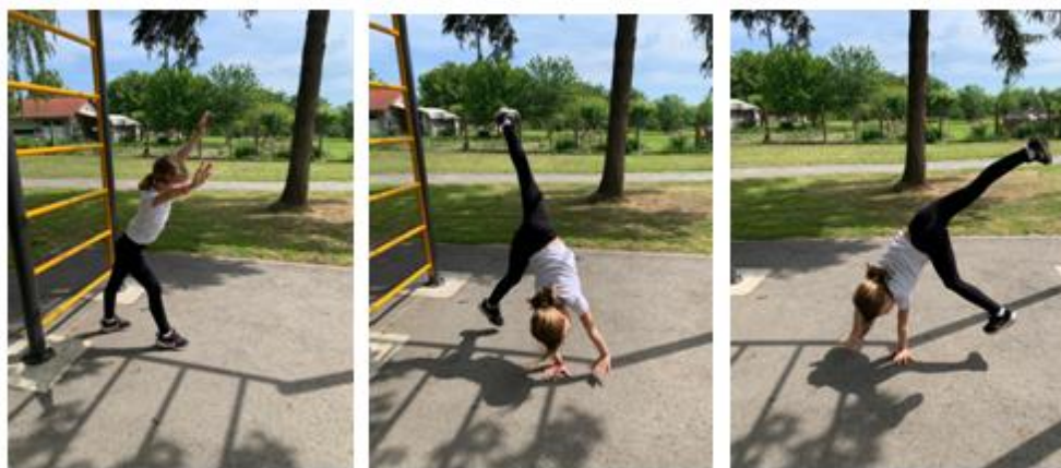
Slika 9. Premet strance (zvijezda)

Na Slici 8 može se vidjeti njihanje djeteta na igralištu pomoću sprave. Na ovaj način dijete predškolske dobi jača mišiće ruku, trupa, te razvija sposobnost ravnoteže i izdržljivosti. Ova vježba se također smatra relativno zahtjevnom jer dijete treba imati razvijene mišiće ruku za pravilno izvođenje ove vježbe. Prema tome, bitno je da odgajatelj bude prisutan te ukoliko je potrebno pomogne djetetu pri izvođenju vježbe.