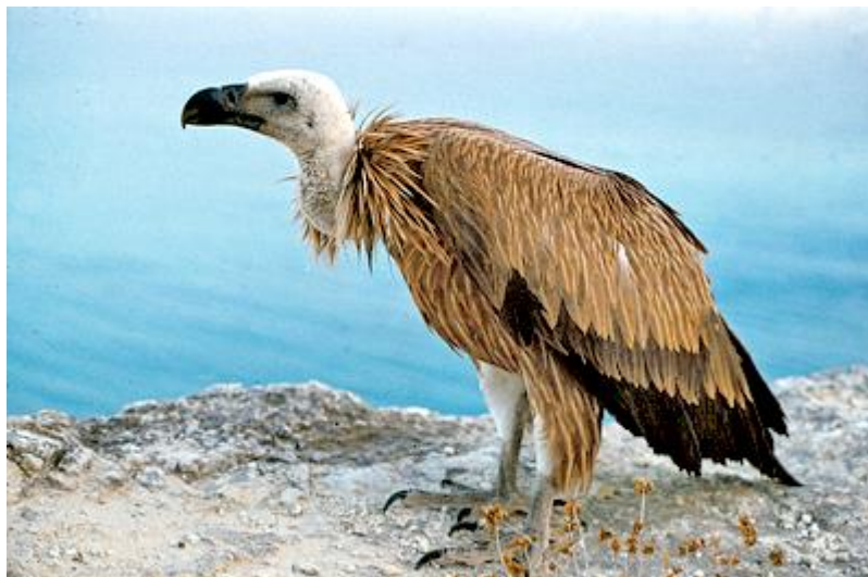
Slika 5. Bjeloglavi sup ( Gyps fulvus )