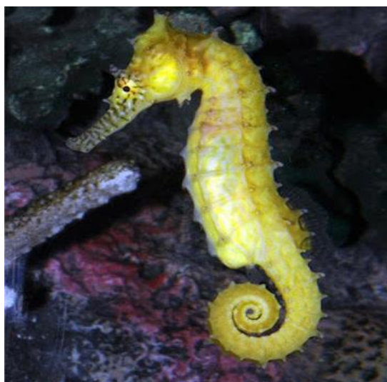
Slika 15. Morski konjić ( Hippocampus guttulatus )

Morski konjić/dugokljunić ( Hippocampus guttulatus ) prema IUCN kategoriji ugroženosti u Hrvatskoj svrstan je u osjetljive vrste. Opstanak mu ugrožavaju ribolov, strane vrste, hidrogradnja, onečišćenje priobalnog mora i prikupljanje morskih konjića kao suvenira. Brojnost mu je velika uz zapadnu obalu Istre. Raste u dužinu najviše do 16 cm. Ima izduženo tijelo, glava mu je prilično nagnuta prema prsima te oblikom podsjeća na šahovsku figuru konja. Boje tijela mogu biti različite, od smeđe i crne, preko crvenkaste do žute s brojnim plavim točkama. Trom je te uglavnom miruje među algama gdje se repom prihvaća za stabljike. Zanimljiv je po mnogočemu, a možda najviše po tome što je riba, ali izgledom to nimalo ne pokazuje te su kod ove vrste mužjaci zapravo majke koje liježu i brinu o potomcima, a ženke su te koje polažu jaja kod mužjaka (Jardas i sur., 2008).