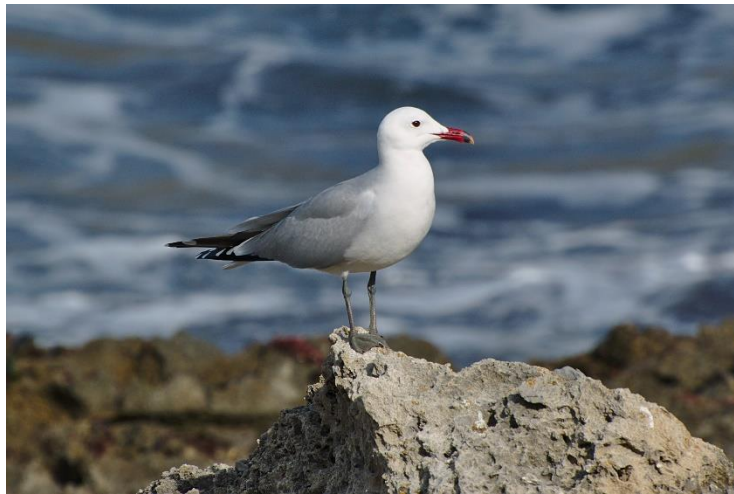
Slika 6. Sredozemni galeb ( Larus audouinii )