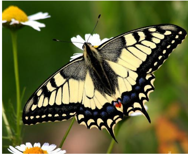
Slika 20. Lastin rep ( Papilio machaon )

veličinu od 7 cm. Pojavljuje se godišnje u dvije generacije, prva u proljeće, a druga ljeti. Razlika je u tome da je druga generacija puno veća. Tipična su staništa ove vrste travnjaci s puno cvijeća i vrtovi jer je ova vrsta u stalnoj potrazi za nektarom iz cvijeća. 15