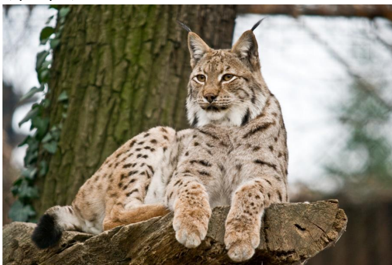
Slika 1. Ris ( Lynx lynx )

Najčešće nastanjuje šumska područja te se može naći u gorskim predjelima, u crnogoričnim i bukovim šumama (Frković i Tvrtković, 2006). Od velike je važnosti prilikom odabira najpovoljnijeg staništa upravo plijen; točnije srne i jeleni. Uz to, kriterij odabira staništa je i raspoloživi zaklon za dnevno odmaranje i za zaklon mladunaca. Uz lov i krivolov, najopasnije za njihov opstanak su sve intenzivnije gradnje prometnica jer osim što se narušava njegovo stanište, ris je često taj koji stradava na prometnicama (Majić-Skrbinšek i sur., 2005).