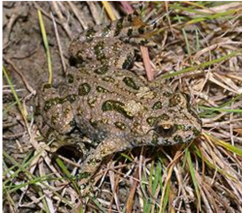
Slika 8. Crveni mukač ( Bombina bombina )