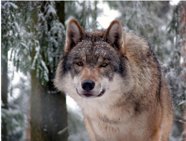
Slika 3. Sivi vuk ( Canis lupus )