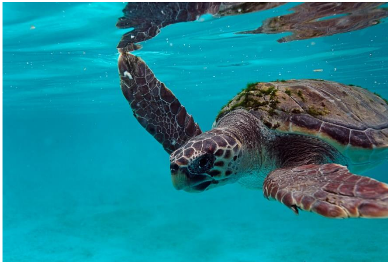
Slika 9. Glavata želva ( Caretta caretta )