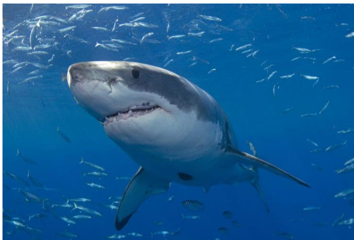
Slika 14. Pas ljudožder ( Carcharodon carcharias )