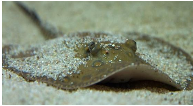
Slika 16. Raža kamenica ( Raja clavata )