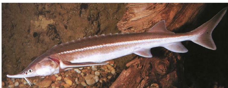
Slika 13. Kečiga ( Acipenser ruthenus )