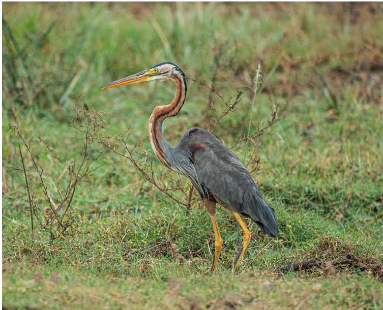
Slika 4. Čaplja danguba ( Ardea purpurea )