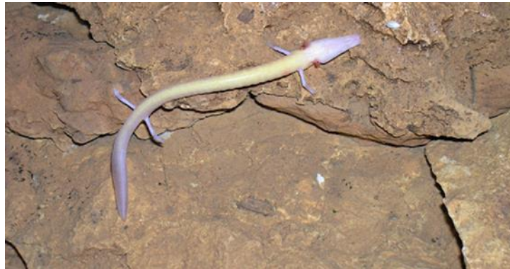
Slika 7. Čovječja ribica ( Proteus anguinus )