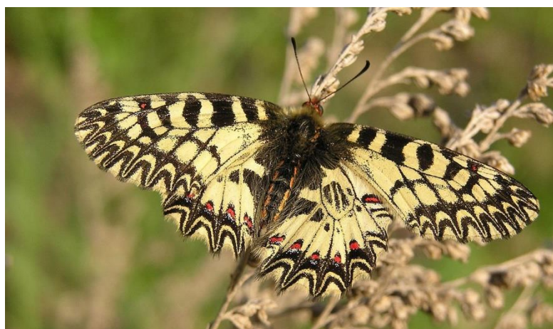
Slika 18. Dalmatinski uskršnji leptir ( Zerynthia cerisy dalmaciae )