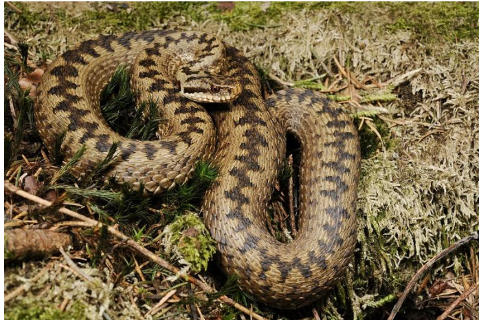
Slika 10. Riđovka ( Vipera berus )