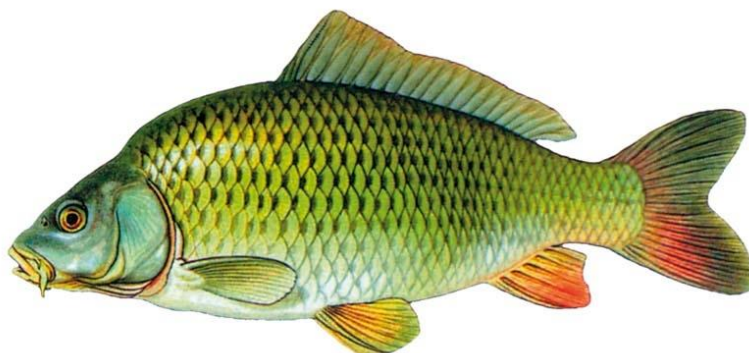
Slika 12. Šaran ( Cyprinus carpio )