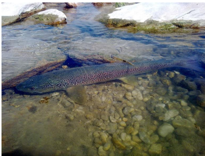
Slika 11. Glavatica ( Salmo marmoratus )

Glavatica ( Salmo marmoratus ) je riba iz porodice pastrvi te prema IUCN statusu u Hrvatskoj pripada kritično ugroženim vrstama. Postala je jedna od najugroženijih vrsta pastrve zbog toga što su je ribari na Neretvi u vrijeme mriještenja pretjerano izlovljavali. Također, zbog unosa uzgojnih pastrvi ne može opstati jer se potomci dalje ne mogu razmnožavati (Mrakovčić i sur., 2006). Njezin je životni vijek veoma dugotrajan te može doseći vrlo velike dimenzije. Raspoznatljiva je po prugama na tijelu koje nalikuju na mramor. Tijelo joj je izduženo, a glava velika. Nalazi se u brzim bistrim vodama koje su obogaćene kisikom. U Hrvatskoj ju nalazimo u rijekama Istre te u Neretvi. Zanimljivo je da je u susjednoj Bosni i Hercegovini lov na ovu ribu dozvoljen jer je brojnost u rijekama Uni i Drini prilično velika za razliku od rijeka u Hrvatskoj. 12