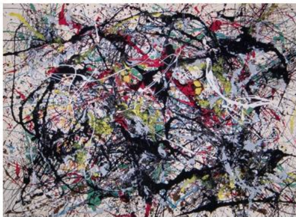
Number 34, 1949.