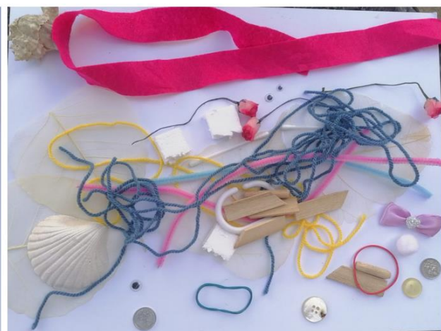
Slika 10. apstraktna umjetnost: djevojčica A lijevo, djevojčica B desno