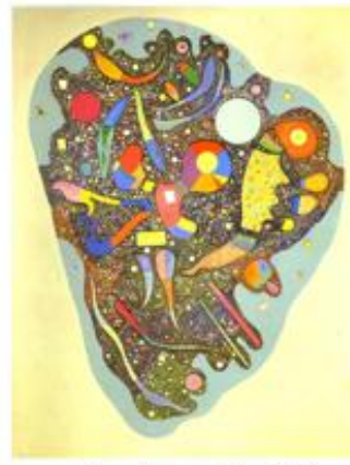
Šareni ansambl, 1938.