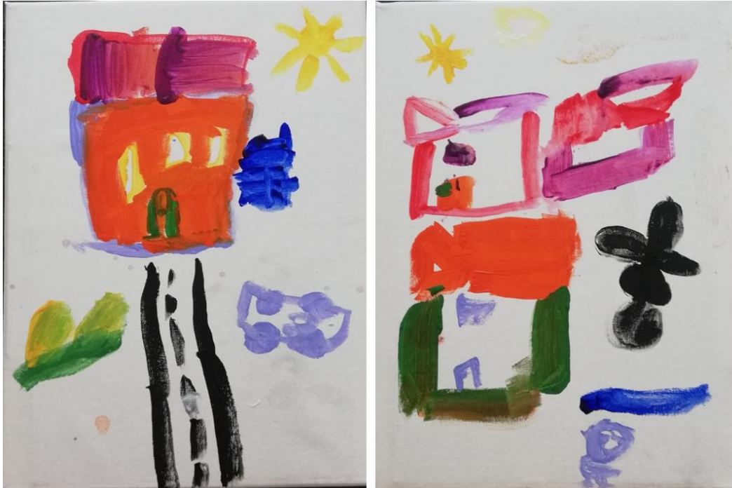
Slika 4. tempera: : djevojčica A lijevo, djevojčica B desno

Obje blizanke dobiveno platno okreću okomito te započinju slikanjem obiteljske kuće počevši od krova. Djevojčica A dodaje žute prozore i zelena vrata, a zatim kuću nadopunjuje narančastom bojom. Pokraj kuće plavom bojom slika šupu, a crnom bojom naznačuje put. S lijeve strane puta djevojčica A dodaje zeleno cvijeće, a s desne strane parkirani auto boje lila. U gornjem desnom kutu djevojčica dodaje sunce. Djevojčica B, nakon naslikanog krova, započinje slikanjem ostatka kuće, prozora i vrata. Pokraj opisane kuće dodaje šupu. Crtež sadrži još jednu kuću koja predstavlja kuću bake i djeda čiji je krov jedini popunjen bojom. Crnom bojom djevojčica B naslikala je cvijet, a plavom je naslikala put. Bojom lila djevojčica označava nepoznatu „djevojčicu koja hvata žabe“. Na kraju djevojčica dodaje sunce u gornjem lijevom kutu i oblake. [IP3.] Sličnost stvaranja blizanačkoga para vidi se pri okretanju danog papira te prilikom odabira kista i boje. Naime, od ponuđenih sedam kistova različitih veličina, obje blizanke odabiru kist iste veličine te slikanje započinju istom ružičastom bojom. Objе započinju crtanjem krova, a zatim kuće u cijelosti i šupe pokraj nje. Također, zanimljivo je to što oba crteža, uz navedeno, sadrže iste elemente poput cvijeća, puta i sunca koje su obje blizanke naslikale na samom kraju. Razlike su vidljive u postojanju određenih motiva kao što je „djevojčica koja skuplja žabe“, auto te kuća bake i djeda.