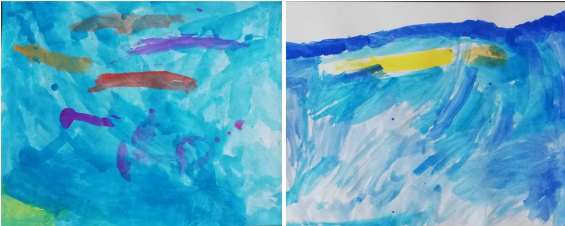
Slika 5. akvarel: djevojčica A lijevo, djevojčica B desno

Uvodna motivacija sljedeće aktivnosti postignuta je razgovorom o moru. Blizanke su navodile sve što su vidjele na moru: ribe, školjke, morsku travu, krokodila, brod, pijesak, kamenčiće i slično. Nakon razgovora korišteni su internetski izvori kojima je bilo prikazano navedeno.