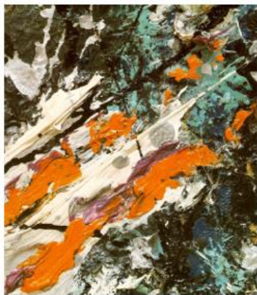
Full Fathom Five, 1947.

Zadatak započinje izlaganjem blizanačkoga para mnogim djelima apstraktne umjetnosti. Dolje prikazana umjetnička djela Vasilija Kandinskog i Jacksona Pollocka korištena su za uvodnu motivaciju ove aktivnosti. Blizanački par pitanjima, jedinstvenim izjavama i opisivanjem viđenog upoznaje pojam apstraktnog umjetničkog stvaranja. Zbog zasićenosti stvaranja kistom, djevojčicama je ponuđena „čarobna“ kutija napunjena raznim materijalima. Obje kutije sadrže u potpunosti iste materijale.