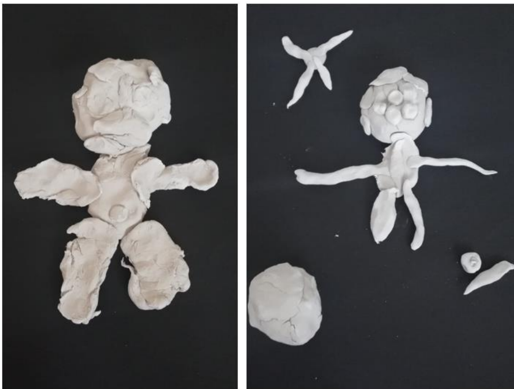
Slika 7. glinamol: djevojčica A lijevo, djevojčica B desno

Aktivnost započinje razgovorom o sličnostima i razlikama ljudi koji nas okružuju. Nakon navedene konverzacije blizanačkome paru ponuđena su zrcala kojima su uočavale detalje svoga tijela, ponajviše lica. Nadalje, ponuđena im je ista količina glinamola kojim su prikazale sebe i uočene karakteristike.