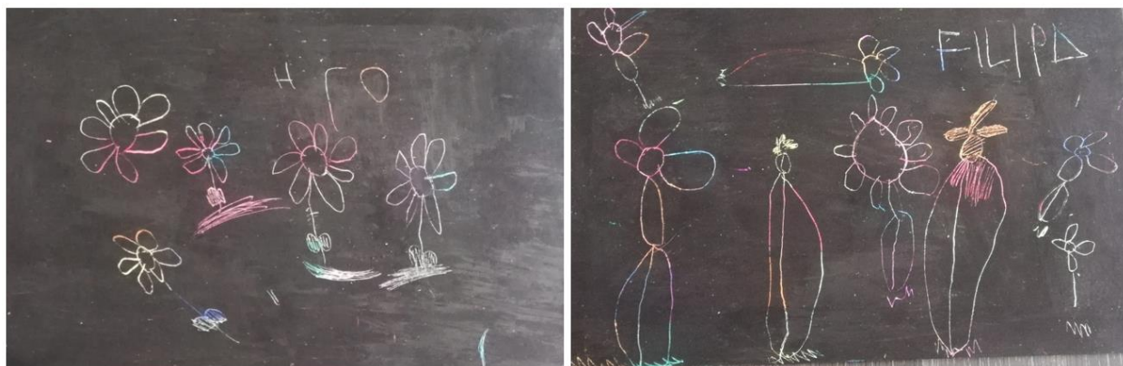
Slika 6. grataž : djevojčica A lijevo, djevojčica B desno

Aktivnost započinje proučavanjem cvijeća na dvorišnoj livadi obiteljske kuće blizanačkoga para. Blizanke su promatrale tratinčice te su njih nekoliko i ubrale što im je poslužilo kao poticaj pri slikanju.