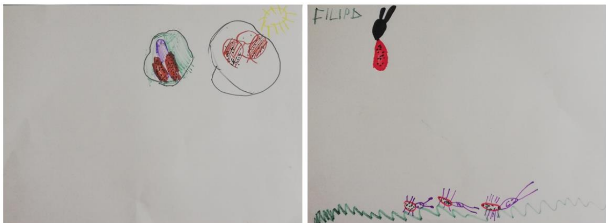
Slika 2. Flomaster: djevojčica A lijevo, djevojčica B desno

BUBAMARA Jedne noći bubamara jako tužna bila netko joj je sakrio točkice sa krila. Plakala je u samoći na mirisnom cvijetu nitko od nje nije bio, tužniji na svijetu. U zoru je došlo sunce, presretna je ona bila vratilo joj ono opet, točkice na krila. (narodna predaja)