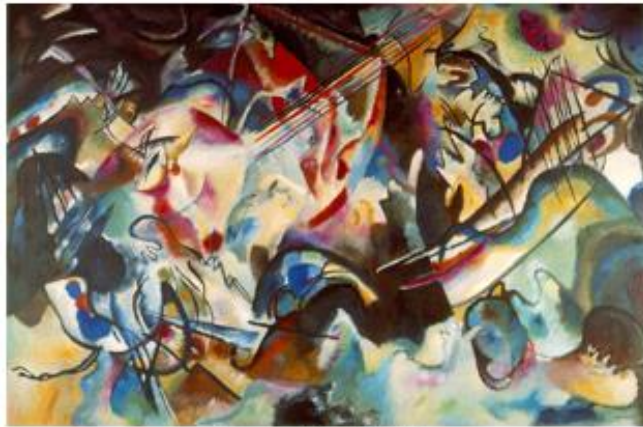
Kompozicija IV, 1913.