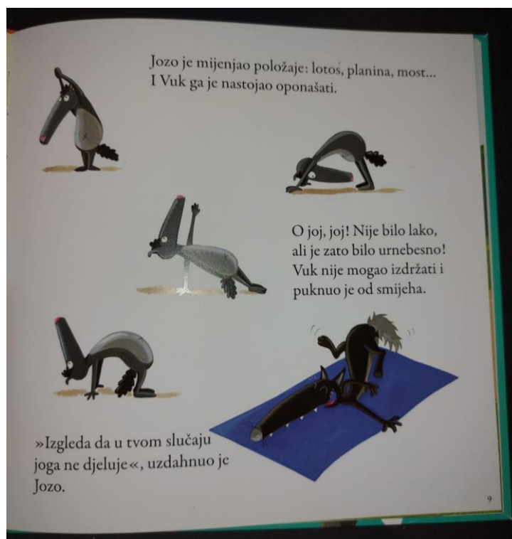
Slika 3 (fotografirano u slikovnici „Vuk koji je ovladao svojim osjećajima“)

Važno je napomenuti da, osim teksta i ilustracija, postoje i takozvane „praznine“ – mjesta neodređenosti između riječi i slika. Može se reći da su to mjesta prekida pričanja priče, odnosno vrijeme koje primatelj koristi kako bi se potrudio ostvariti smislen odnos između teksta i ilustracija, što je važno, budući da se kod primatelja pozornost konstantno kreće između ta dva segmenta, odnosno ne može istovremeno biti usmjerena na oba (Narančić Kovač, 2015).