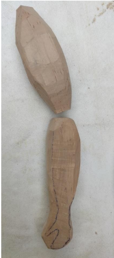
Fotografija 14. (vlastiti izvor) Fotografija 15. (vlastiti izvor) Fotografija 16. (vlastiti izvor)