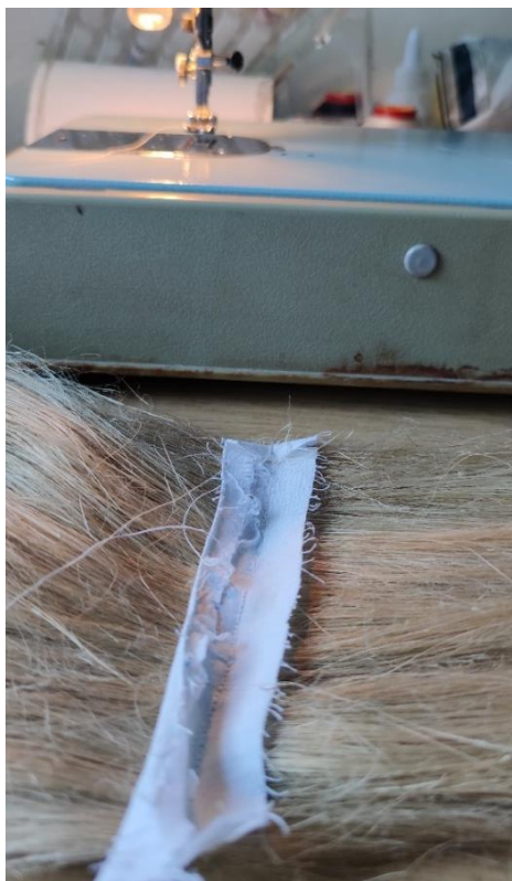
Fotografija 17