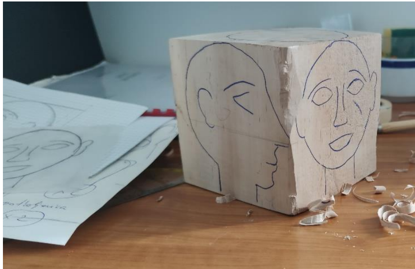
Fotografija 7.

Dimenzije komada drveta prije obrade su 10 x 10 x 7 centimetara. Prilikom izrade glave kocka drva se stavlja u škripu te se dlijetom skida višak. Na taj način iz drvene kocke izranja na površinu izranja reljef lica. Potrebno je paziti na najvišu točku kada lice gledamo sprijeda (nos) te uzeti u obzir kako skidamo drvo. Vrlo je važno obratiti pažnju na godove i na tok drva kako ne bi došlo do pucanja. Periodično glavu izvadimo iz škrice i olovkom označimo mjesta na kojima je potrebno skinuti još drva. Veće površine skidamo dlijetom, oblikujemo rašpom te na kraju obrađujemo dremelom.