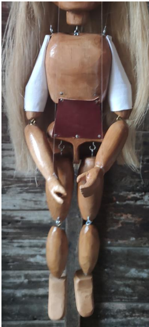
Fotografija 20.