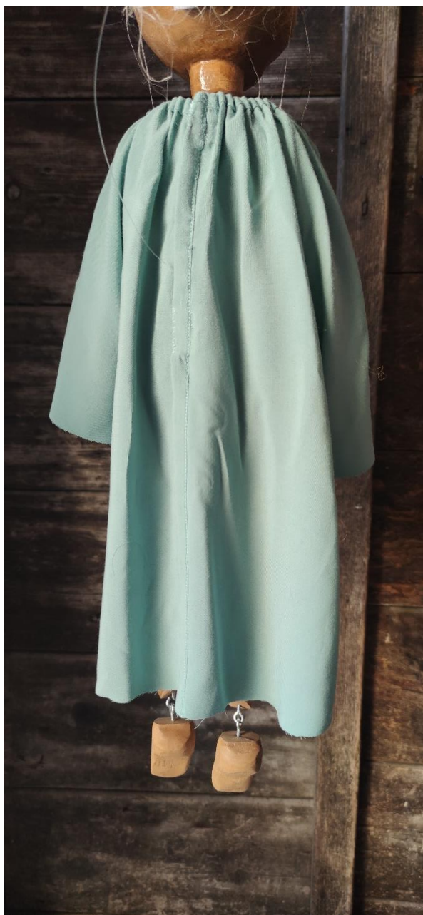
Fotografija 25.