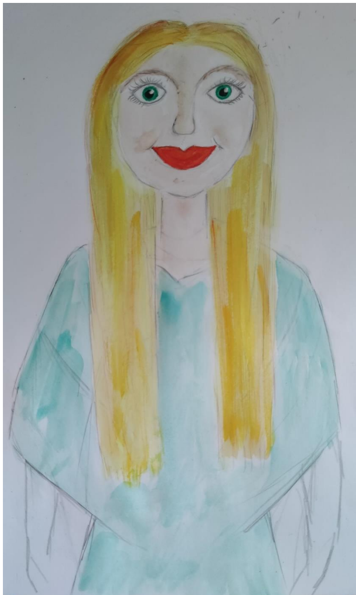
Fotografija 5.

Inspiracija za lik lutke je „Zora“, boginja praskozorja i povečerja. Prema slavenskoj mitologiji ona svako jutro otvara nebeska vrata za izlazak Sunca te ih svaku večer u suton zatvara. Ujedno predstavlja i božicu trojdnosti pri čemu predstavlja jutro, večer i noć ili djevicu, majku i staricu. Vlastita interpretacija Zore predstavlja boginju u svitanje, dok je jutarnja rosa na travnjacima, ona izranja zajedno sa Suncem. Plava kosa predstavlja zajedničko rađanje sa Suncem, zelene oči i haljina jedinstvo sa prirodom, a crvene usne i puni obrazi mladost i čednost (Spirin, 1997).