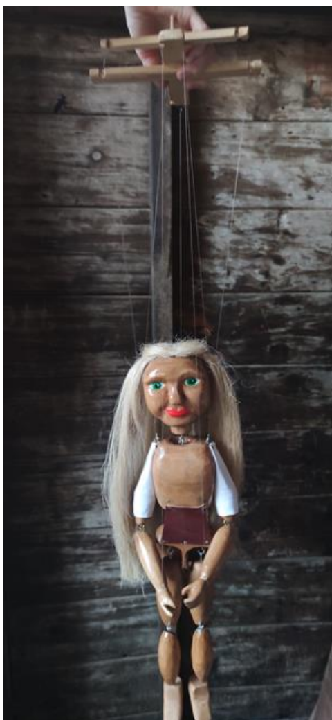
Fotografija 23.