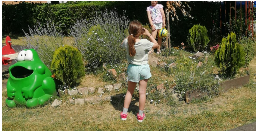
Slika 6. Djevojčica koristi šešir kao rekvizit