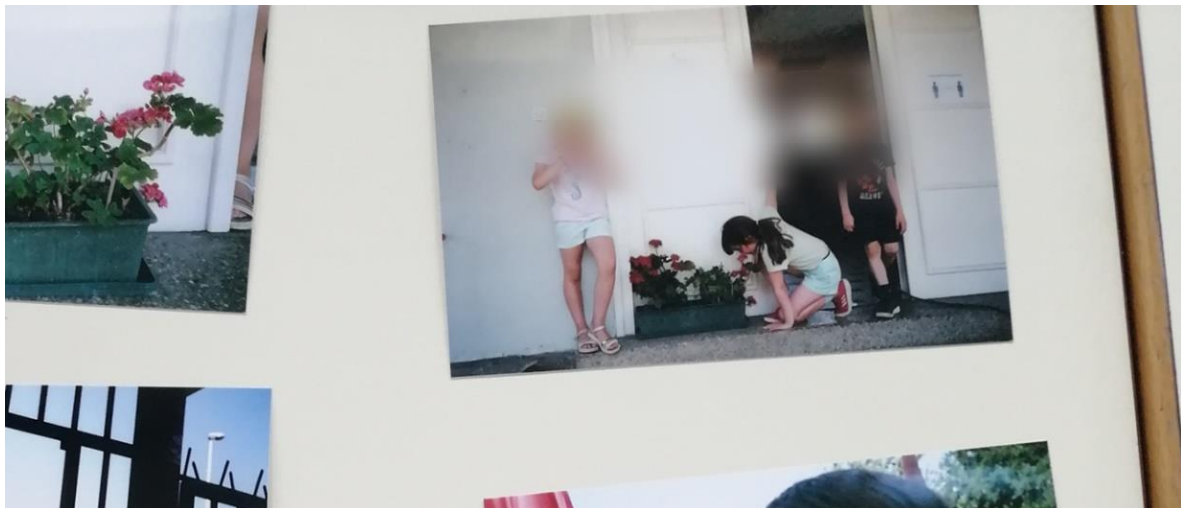
Slika 7. Djevojčica koristi cvijeće kao rekvizit