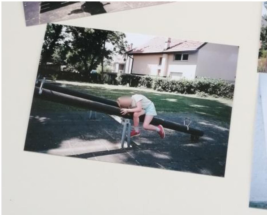
Slika 1. Poziranje djevojčice

svoj red i brojali svakom koliko fotografija još može fotografirati prije nego preda fotoaparat drugom djetetu. Zanimalo me kako će pristupiti fotografiranju, te koliko ćemo njihovog izražavanja vidjeti u načinu fotografiranja. Dvije djevojčice odlučile su se za poziranje, prva djevojčica je drugoj govorila kako da se stane i što da radi. Druga djevojčica pozirala je imitirajući već negdje viđene poze.