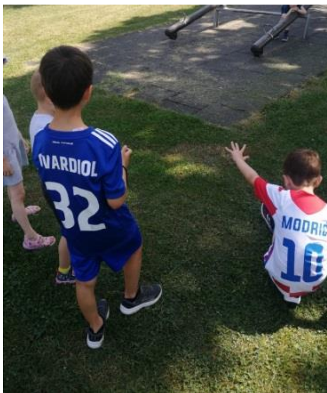
Slika 5. Dječak traži najbolji kut kadra